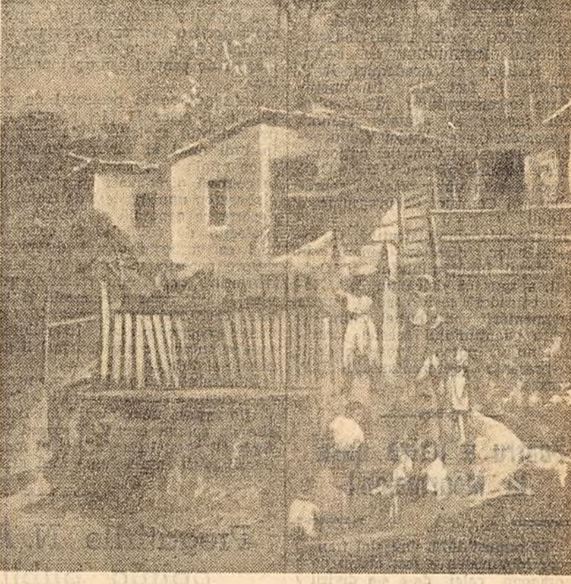
Ită o consecință a exploatarei economice a Americii Latine de către trusturile imperialiste: creșterea mizeriei. Săraca din punct de vedere economic, țările latino-americane au suferit pentru a face față cerințelor sîntății publice, educației, necesității de locuințe, de mijloace de transport. Creștea numărul populației înfometate, după cum o dovedește recensămîntul avut în curs la Rio de Janeiro. (Fotografie și text din săptămînalul brazilian „Novos Rumos” din 7-13 octombrie 1960.)

Textul inițial al acestui articol, a cărui adoptare fusese propusă de delegațiile țărilor socialiste, a fost aprobat cu o majoritate de 70 de voturi, nici unul contra și trei abțineri, printre care S.U.A. și Anglia.