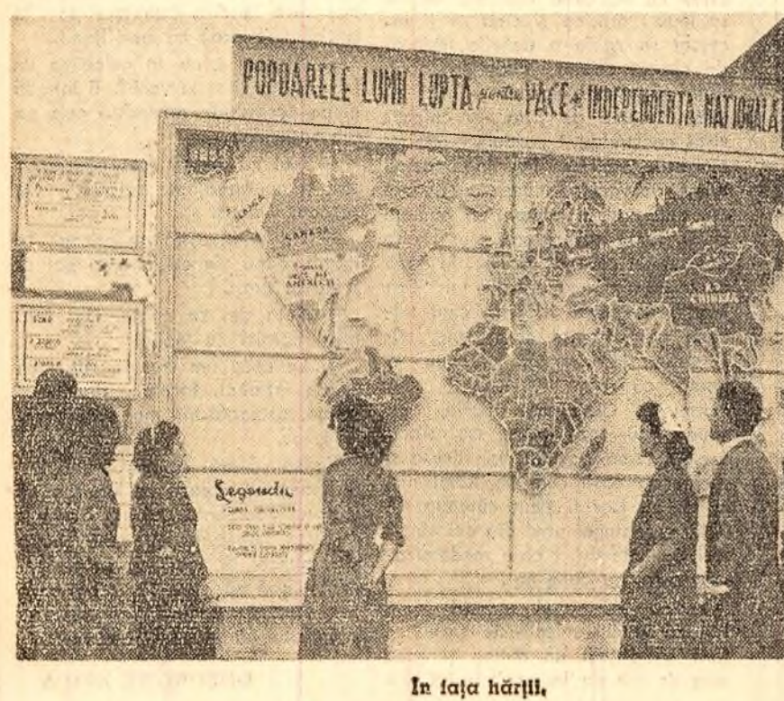
În fața hărții.