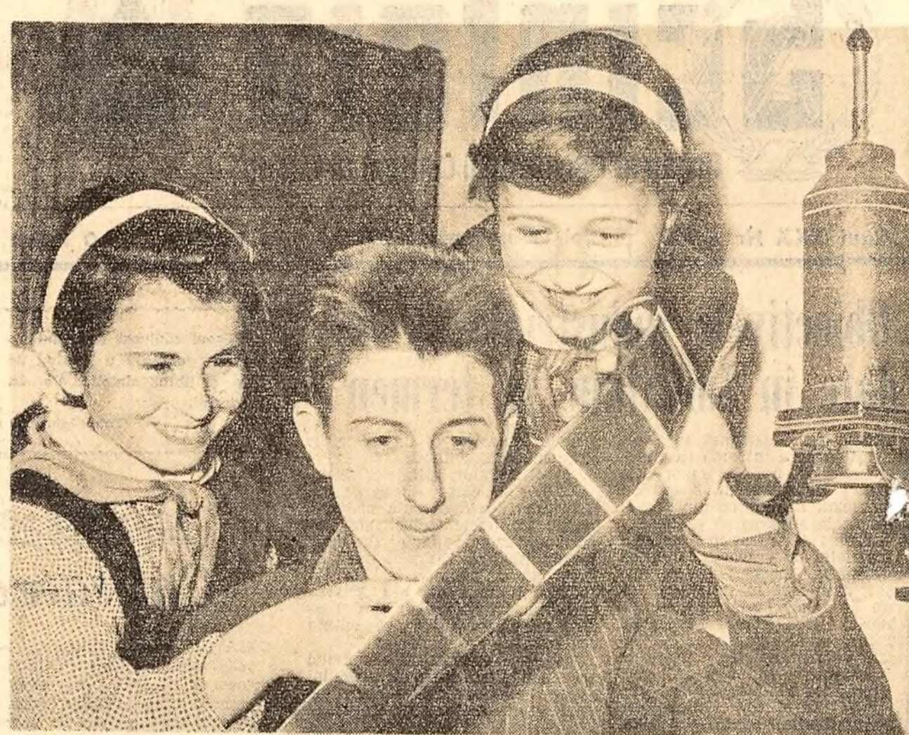
Acești tineri fotoamatori din Sibiu au toate motivele să se bucure: imaginele sînt reușite, îndrumările primite la cercul de fotoamatori al casei pionierilor din localitate le-au fost de folos în excursia documentară pe care au făcut-o, nu de puțin, în munși.

CLUJ (coresp. „Scinteia”). — La clubul muncitoresc „Victoria” a fost înființat studioul artiștilor amatori. Programul studioului prevede ca spectacolele prezentate să fie analizate, iar diletele formații culturale, ca brigăzile artistice de agitație, echipe de dansuri și altele să primească o îndrumare calificată. Primul spectacol al tîlului: „În jurul pînului” a fost prezentat de către brigada artistică de agitație a uzinei metalurgice „Unirea”. După program între membrii brigăzii și îndrumătorii altor formații artistice, care au luat parte la acest spectacol, a avut loc un rodnic schimb de experiență.