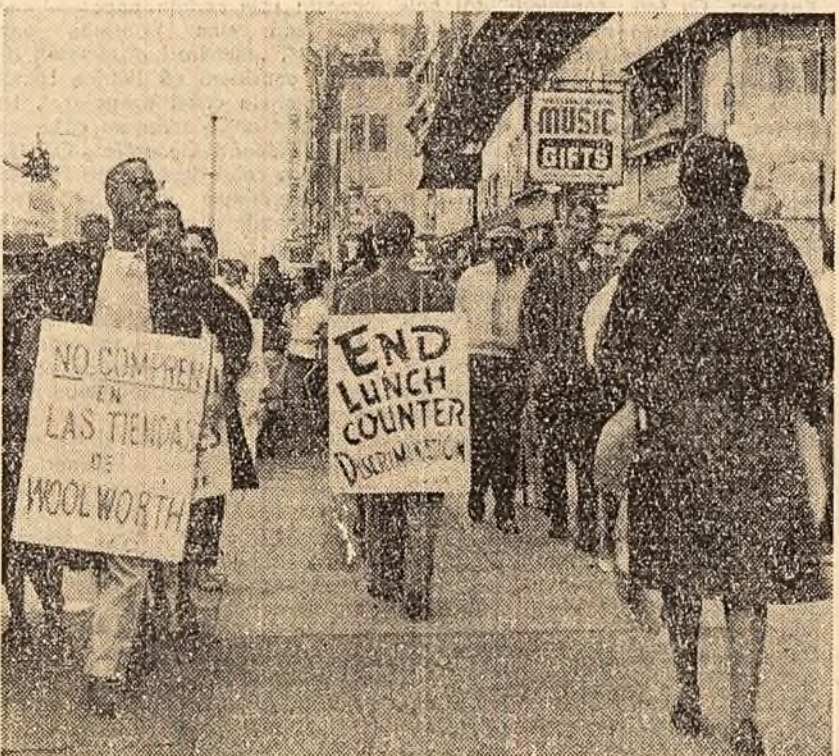
Aspect de la o demonstrație a negrilor din Harlem (New York) în fața unui magazin care practică discriminarea rasială.

Într-adevăr, componența grupului celor 11 țări (Birmania, Cambodgia, Ghana, India, Indonezia, Irak, Maroc, Nepal, R.A.U., Venezuela și Iugoslavia), cuprinde vaste regiuni de pe glob, cu o populație imensă. În rezoluția lor, cele 11 state propun o serie de directive, care, odată adoptate de Adunarea Generală, ar urma să constituie baza unui tratat de dezarmare generală și totală, încheiat ca rezultat al tratativelor dintre marile puteri.