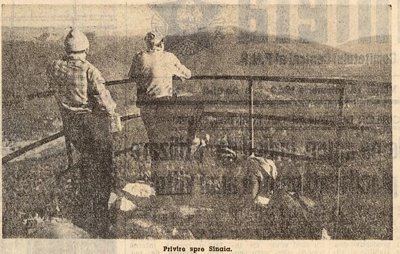
Privire spre Sinoia.