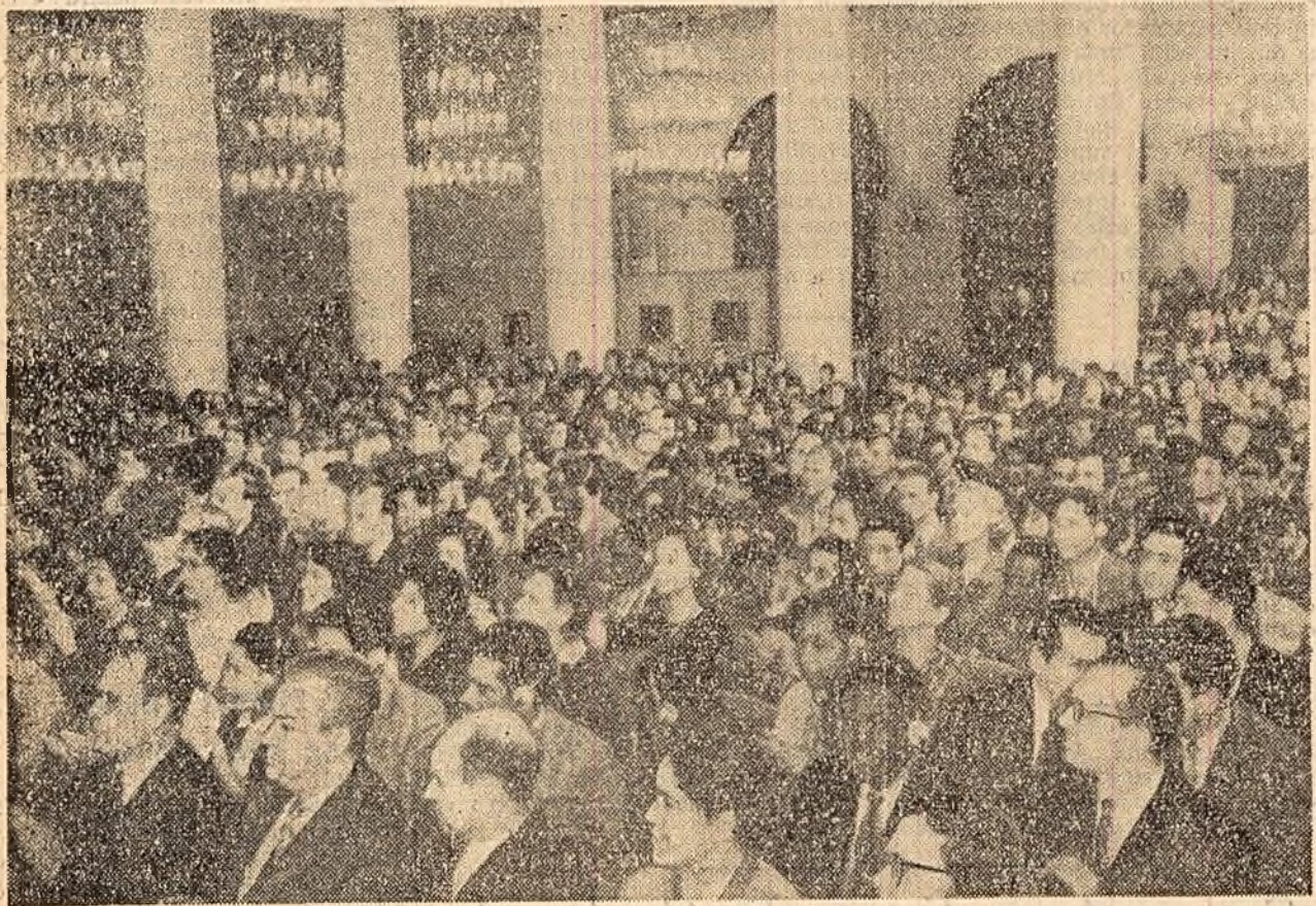
Participanții la deschiderea festivă a Universității Prieteniei Popoarelor de la Moscova.

Deschiderea festivă a Universității Prieteniei Popoarelor