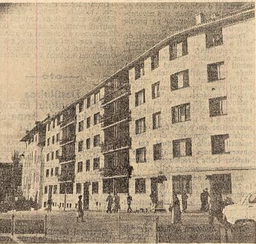
Un nou bloc cu patru etaje dat de curînd în folosință la Cralova.

François-Poncet consideră că poziția cancelarului Adenauer „este regretabilă“. „Acesta nu este poziția unui aliat sau prieten bun“, scrie el.