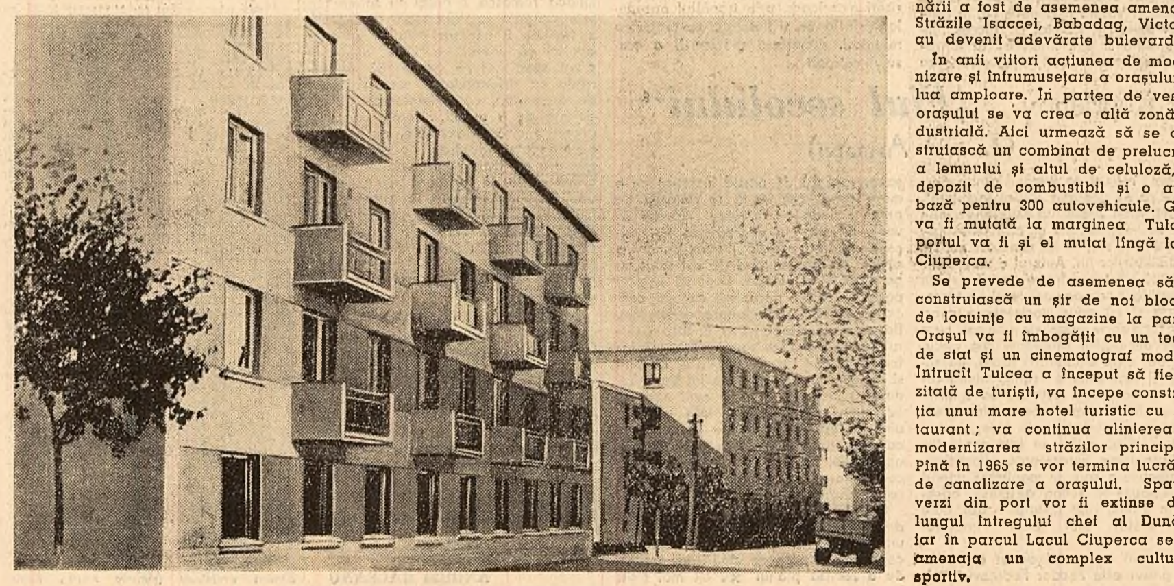
Blocuri noi construite pe strada Gării