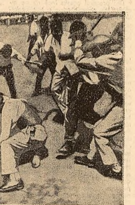
De cîtă „simpatie” se bucură membrii bandelor lui Mobutu din partea populației din Leopoldville se poate vedea din această fotografie, reproducă din presa occidentală: unul „mobutist” cetățenii îi aplică o geroșie în pînă strădă.

Corespondentul relatează că hungarii din rîndurile trupelor lui Mobutu au scos pe funcționari ai O.N.U. din automobile, iar pe alții din casele lor. Toată noaptea persoanele arestate au fost ștute sub gurile puștilor îndreptate spre ele. După încercările sterile ale O.N.U.,