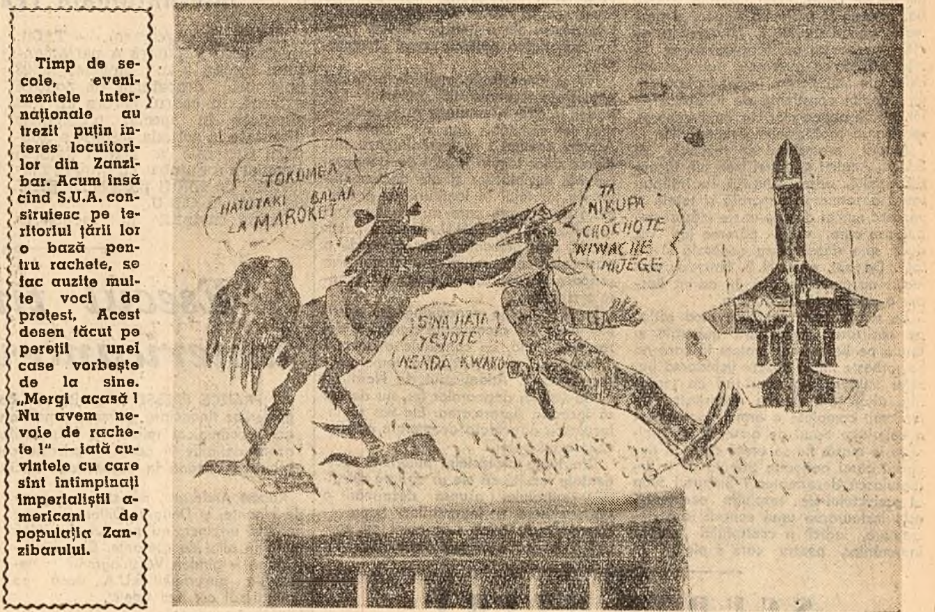
Timp de secolele evenimentele internaționale cu trezî puțin interes locuitorilor din Zanzibar. Acum însă cînd S.U.A. consiștează pe teritoriul țării lor o bază pentru rachete, se fac auzite multe voci de protest. Acest desen făcut pe pereții unei case vorbește de la sine. „Merți acasă! Nu avem nevoie de rachete!” — lădă cuvintele cu care sînt împingăți imperialiștii americani de populația Zanzibarului.

Sînt colonii pentru că „sînt înapoiate” Intre stăpînirea colonială și starea de înapoierie, de incultură, de mizerie în care trăiesc popoarele din colonii este o legătură directă. Jawaharlal Nehru, primul ministru al Indiei, în cartea sa „Descoperirea Indiei”, — arată că 187 de ani de dominație engleză în Bengal, regiune bogată și înfloritoare întrecut, au transformat populația într-o „masă jalnică de oameni săraci, flă-