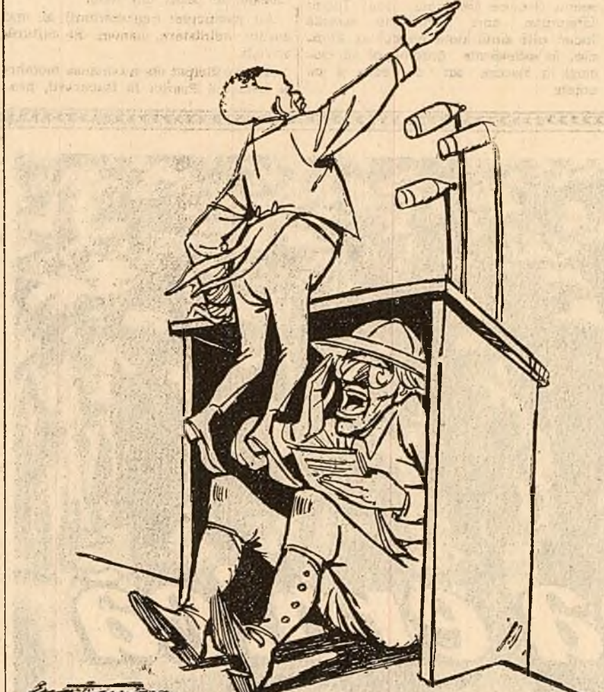
Kasavubu la O.N.U.: — Prin vocea mea vorbește masa! Desen de EUGEN TARU

NEW YORK 24 (Agerpres). — Ziarul „New York Times” anunță că S.U.A. întreprind o nouă demonstrație de forță în dreptul țărmurilor Africii. Prin această demonstrație, afirmă ziarul, se urmărește „stabilirea unor relații de prietenie” cu țările africane. Se știe însă că aceste „vizite” constituie procedeele preferate al colonialiștilor care exercită în felul acesta presiuni asupra guvernelor țărilor în care își fac apariția acești „oaspeți” înarmați. „New York Times” arată că porturile tuturor țărilor africane vor fi „vizitate” de o escadră de cinci distrugătoare. Ziarul face aluzia că s-ar putea ca acești „vizitatori” blindați să ajungă și în porturile Congoului.