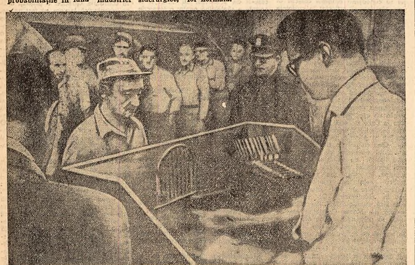
O imagine atît de frecventă astăzi în S.U.A.: în țară crește șomajul și numeroși muncitori primînd salariul se întrebă cu multă neliniște: nu e oare ultimul? Tristețea, dezamăddea de pe chipurile muncitorilor dintr-o întreprindere americană, pe cale să-și reducă personalul, a fost surprinsă de un fotoreporter al revistei „New York Times Magazine”.

DELHI. Luînd cuvîntul la 24 noiembrie în Camera Populară a parlamentului Indian, primul ministru al Indiei, Nehru, a declarat: „Armata lui Mobutu s-a transformat într-o bandă de hoți”. Actualmente în Congo domnește samavolnicia. Primul ministru Nehru și-a exprimat de asemenea dorința de a se înfișur propunerea Indiei cu privire la dezarmarea armatelor congoleze și la stabilirea controlului asupra lor.