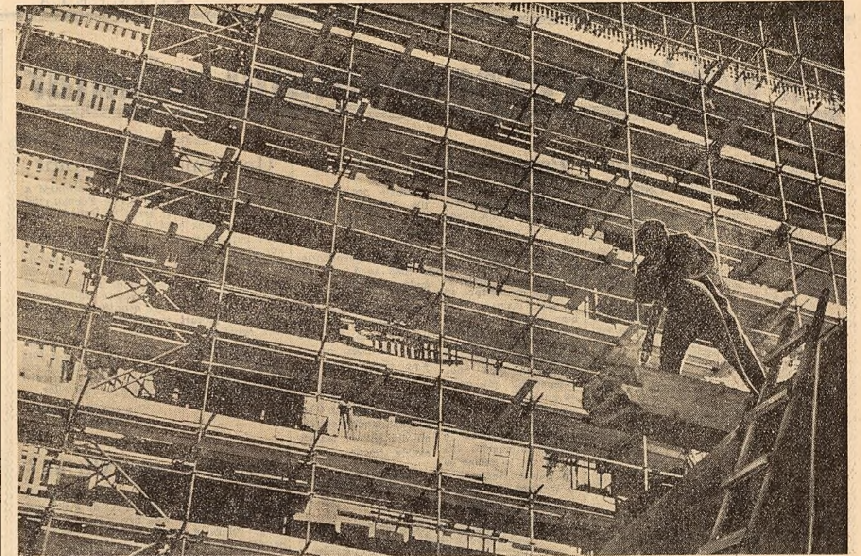
Pelsaj bucureștean, 1960

Primirea a decurs într-o atmosferă de caldă prietenie. (Agerpres)