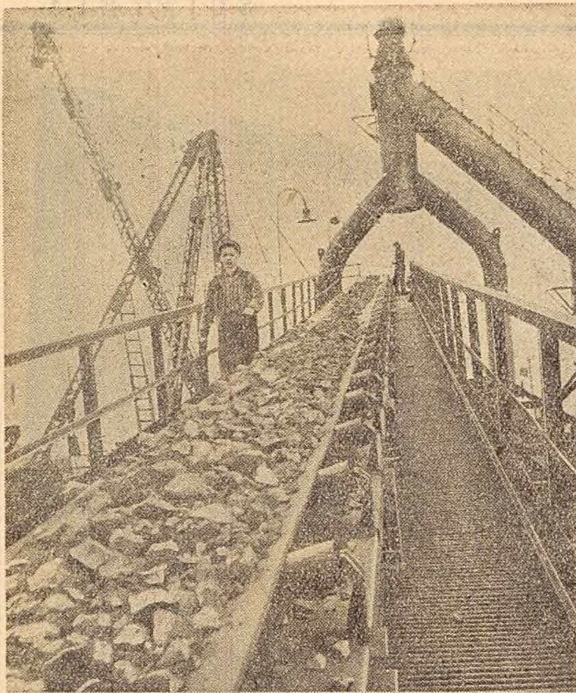
Furnalul nr. 1 a Combinatului siderurgic Hunedoara cu lăptuș de masă tehnico-organizatorică în vederea realizării încă de pe acum a indicilor de utilizare a agregatelor prevăzute pentru anul viitor.

din Marea Britanie, Partidul Comunist din Maroc, Partidul Comunist din Martinica, Partidul Comunist din Mexic, Partidul Popular Revoluționar Mongol, Partidul Comunist din Nepal, Partidul Socialist din Nicaragua, Partidul Comunist din Norvegia, Partidul Comunist din Noua Zeelandă, Partidul Comunist din Olanda, Partidul Popular din Panama, Partidul Comunist din Paraguay, Partidul Comunist din Peru, Partidul Muncitoresc Unit Polonez, Partidul Comunist din Portugalia, Partidul Comunist din Reunion, Partidul Muncitoresc Român, Partidul Comunist din Salvador, Partidul Comunist din San Marino, Partidul Comunist din Siria, Partidul Comunist din Spania, Partidul Comunist din Sudan, Partidul Comunist din Suedia, Partidul Comunist din Tailandă, Partidul Comunist din Tunisia, Partidul Comunist din Turcia, Partidul Muncitoresc Socialist Ungar, Partidul Comunist al Uniunii Sovietice, Partidul Comunist din Uniunea Sud-Africană, Partidul Comunist din Uruguay, Partidul Comunist din Venezuela, Partidul celor ce muncesc din Vietnam și alte partide.