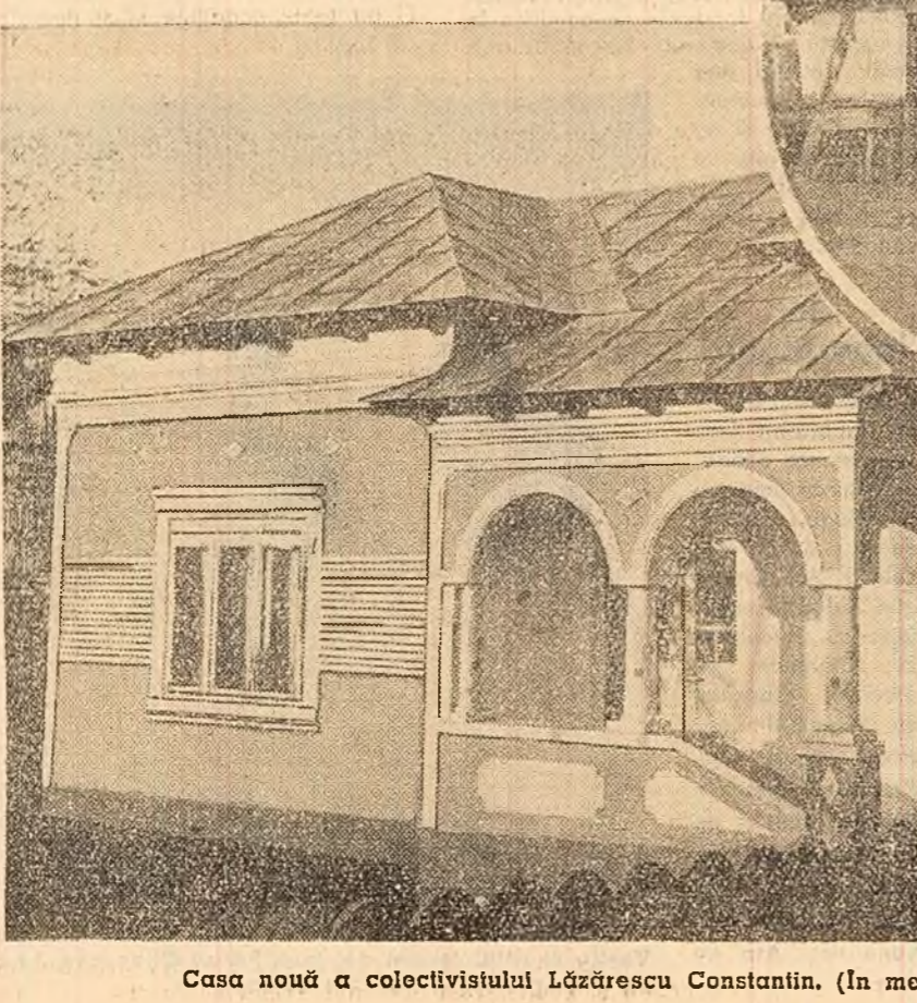
Casa nouă a colectivității Lăzărescu Constantin. (În medalion — casa veche).

În luna noiembrie colectivul termocentralei electrice Grozăvești din Capitală a economisit o cantitate de combustibil convențional cu care se poate produce energia electrică necesară alimentării unei întreprinderi de mărime fabricii de confecții „Gh. Gheorghiu-Dej” pe timp de un trimestru.