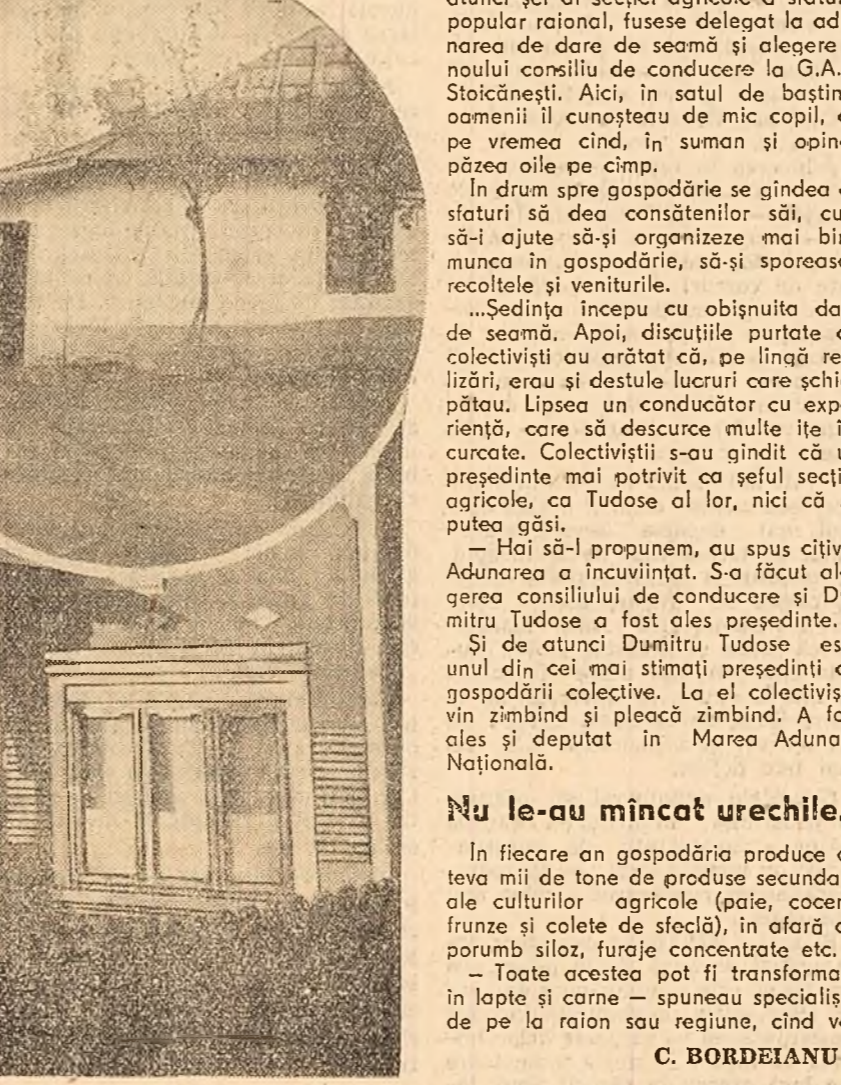
Casa nouă a colectivității Lăzărescu Constantin. (În medalion — casa veche).

Cind entuziasmul spectatorilor se mai potolii, răsună un glas bătrânesc. — Heni, taică, hen! Și bătrînul cu pricina trase pe nepoțelul neastîmpărat lângă el și pufni minios din lulea. Păi asta-i orbluțu?