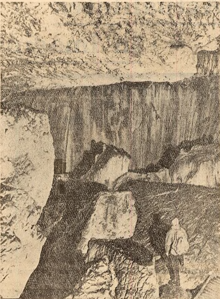
Munții Bucugi, peștera Ialomicioarelor.