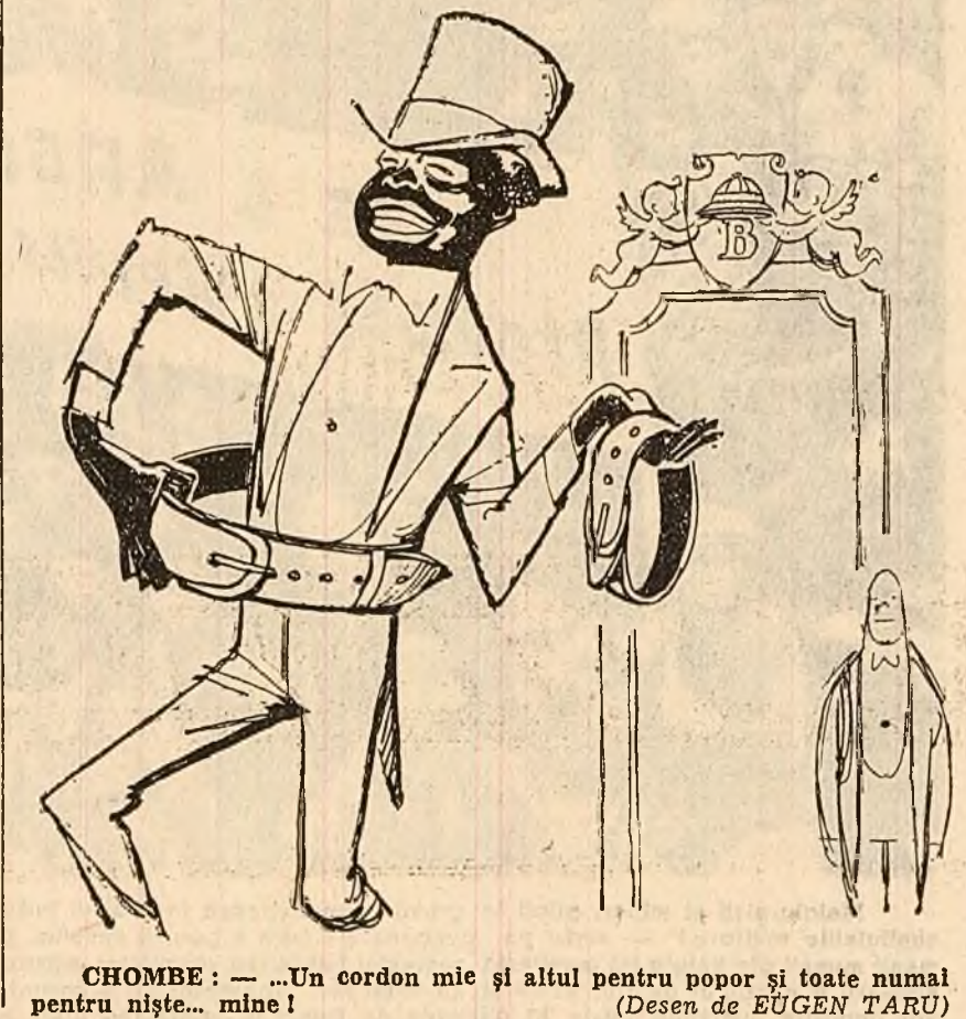
CHOMBE: — „Un cordon mic și altul pentru popor și toate numai pentru niște... mine!” (Desen de EUGEN TARU)

Conducătorul marionetă al provinciei congoleze Ka-tanga, pe teritoriul căreia se găsesc mine de uraniu, aur, etc., aflat în prezent în vizită în Belgia, a fost decorat de rege cu marelui cordon al „Ordinului co-ronat”. (Ziarele)