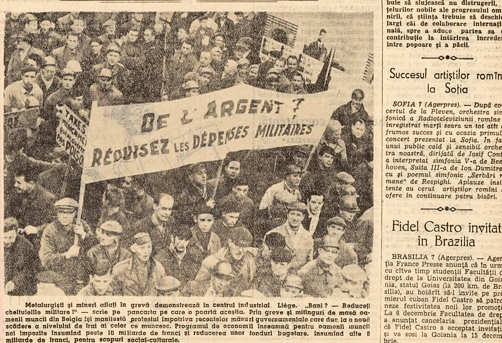
Metalgurii și mineri din Liège, în grevă demonstrează în centrul industrial Liège. „Bani? — Reduceți cheltuielile militare!” — scrie pe pancartă pe care o poartă această. Prin greve și mitinguri de masă oamenii muncii din Belgia își manifestă scderea a nivelului de trai al celor ce muncesc. Programul de economii înseamnă pentru oamenii muncii noi impozite însumînd peste 10 miliarde de franci și reducerea unor fonduri bugetare. Oamenii muncii 8 miliarde de franci, pentru scopuri social-culturale.

Publicul spectator a răsplătit cu vil aplauze măiestria interpretativă a artistei sovietice. (Agerpres)