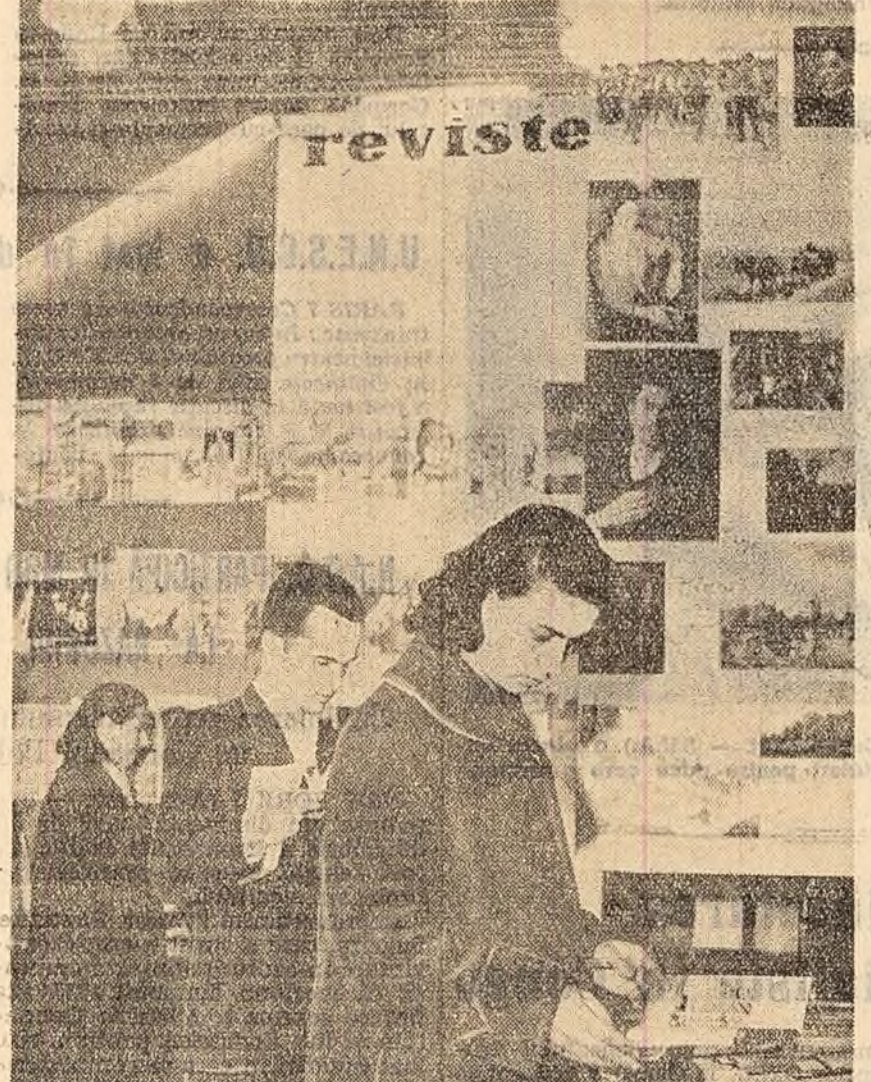
Sala „Nicolae Cristea” din strada Brezoianu nr. 23—25 găzduiește de câteva zile „Expoziția industrială poligrafică pe anul 1960”.

TG. MUREȘ (coresp. „Scintei”). — Du-minecî în mîni, la stațiunea climatică Lacul Rosu, s-au întrînit 140 de studenți din București, Iași și Brașov. Ei au admirat Cheik Băezăul, au urcat muntele Suhard și au vizitat șantierul hidrocentralului „V. I. Lenin” de la Bicaz.