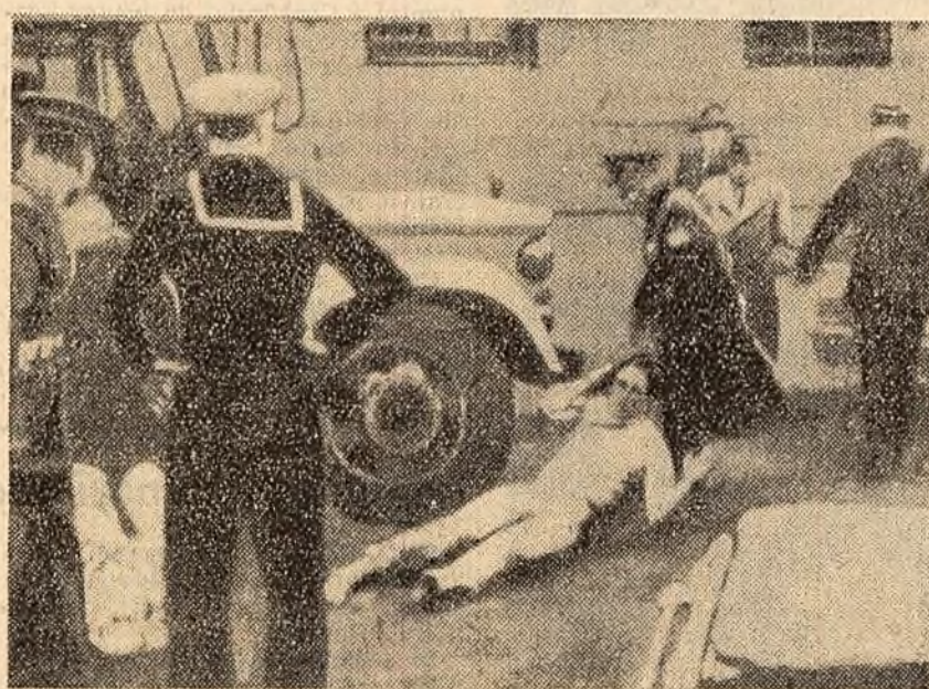
Politia din New Haven (statul Connecticut — S.U.A.) a atacat cu brutalitate demonstrația tinerilor luptători pentru pace care protestau împotriva înarmării atomice.

După cum anunță agenția Reuter, guvernul Verwoerd a trimis câteva nave de război spre coasta Pondolandului. Avioanele de război efectuează raiduri sistematice deasupra întregului teritoriu.