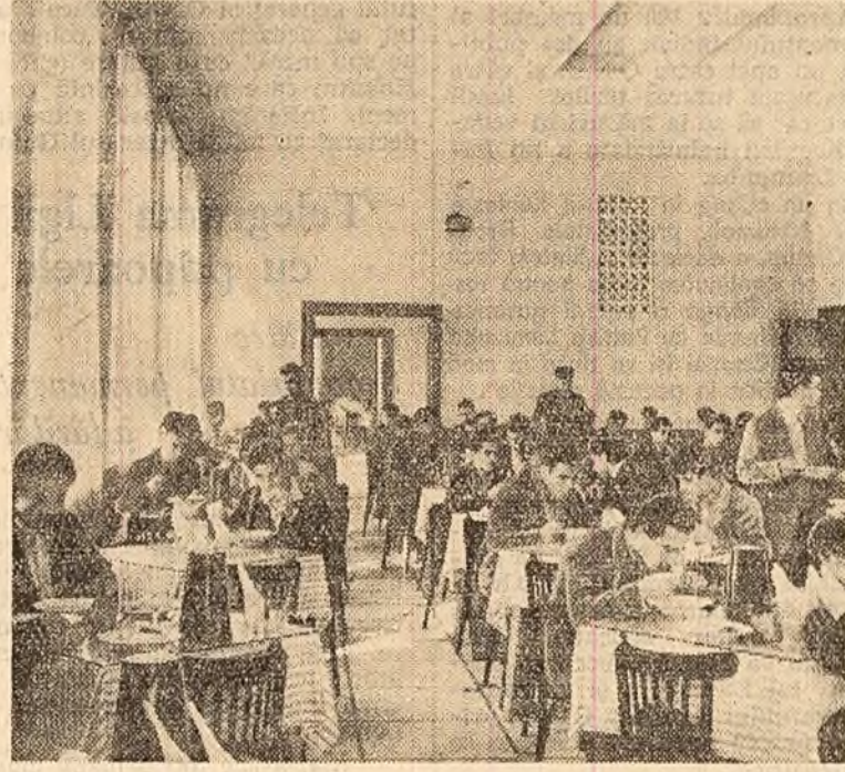
La masă, în noua cantină cu 1.800 locuri a studenților Universității „Al. I. Cuza” din Iași.