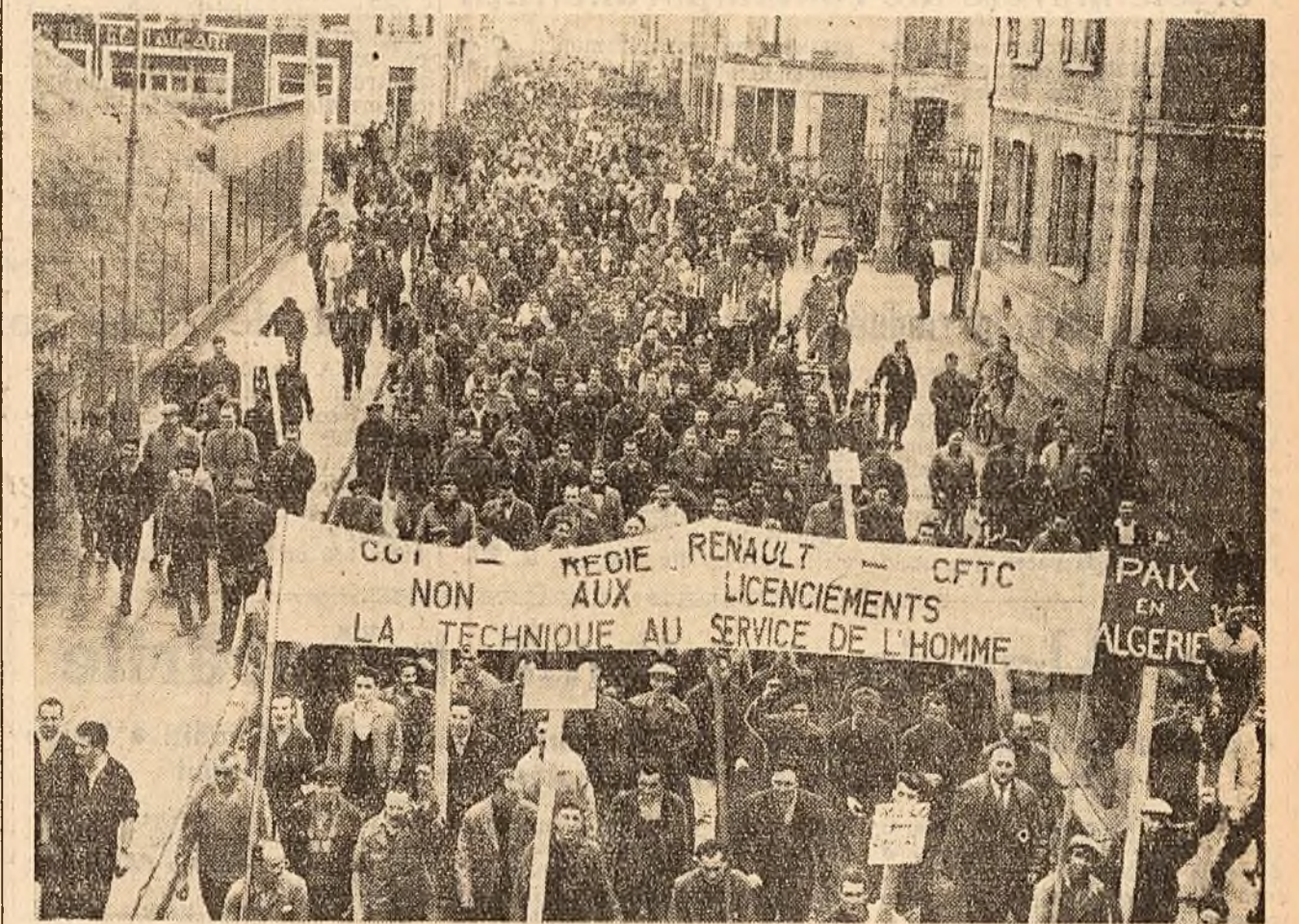
Recent au avut loc la Mans (Franța) puternice manifestații ale muncitorilor de la uzinele Renault, împotriva concedierilor masive și pentru pace în Algeria.

Termocentrala Baltica va fi principala sursă de alimentare cu energie electrică a regiunilor din nord-vestul U.R.S.S.