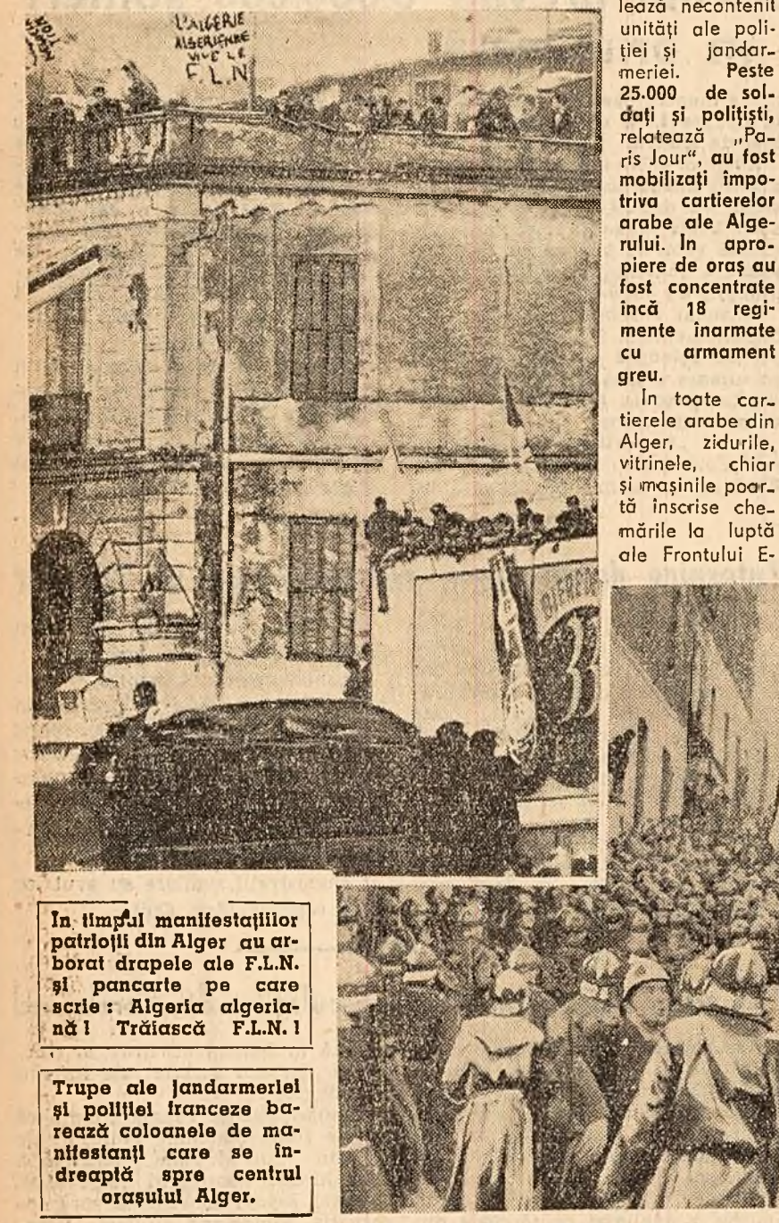
În timpul manifestaţiilor patriotice din Alger au arborat drapelul F.L.N. şi pancarte pe care scrie: Algeria algeriană! Trăiască F.L.N.!

PARIS 13 (Agerpres). — Regele Marocului Mohammed a adresat poporului algerian o declaraţie, difuzată prin radio, în care îşi exprimă ataşamentul faţă de lupta dreaptă a celor care au căzut „îndeplinindu-şi datoria sacră sub drapelul algerian”. Guvernul Marocului a trimis un protest guvernului francez în legătură cu moartea a sute de algerieni „ca urmare a acţiunii armatei franceze”.