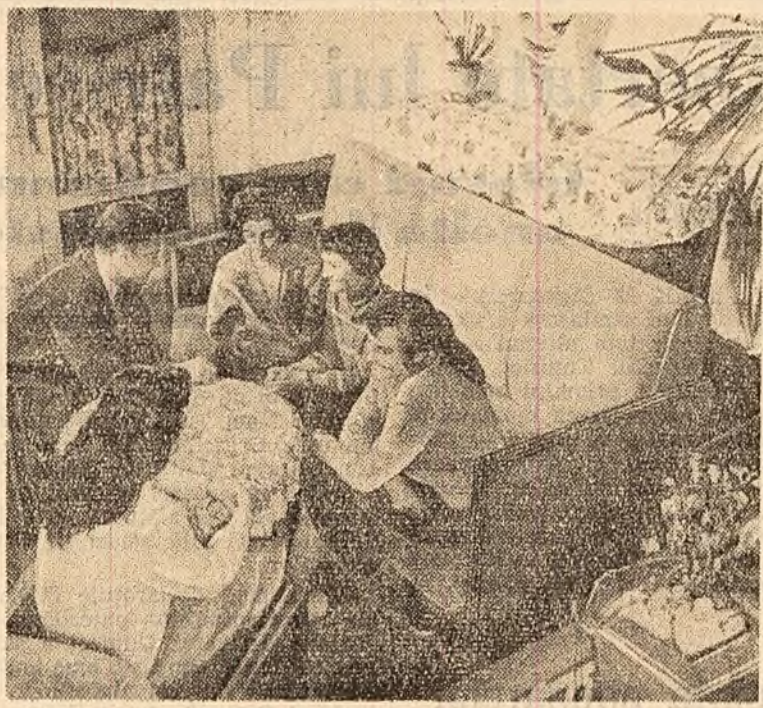
Intr-unul din căminele Universității Babeș-Bolyai din Cluj.