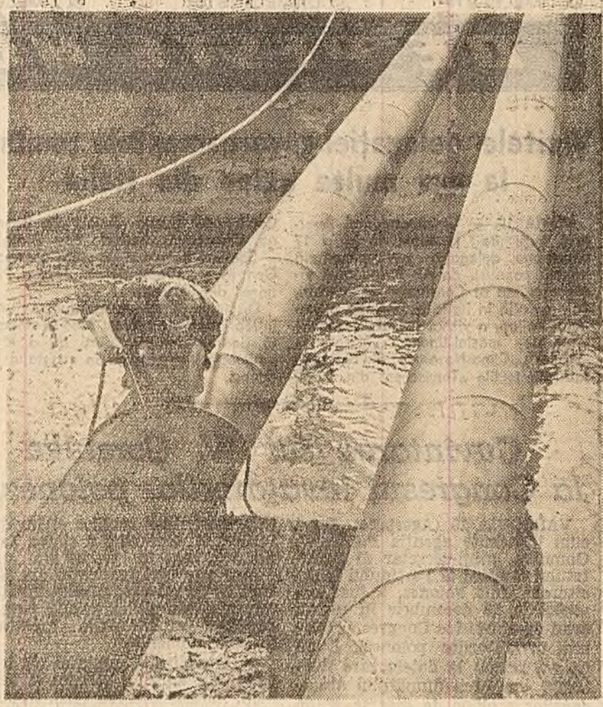
Se lucrează la conductele de termoficare ce traversează Dimboviza în dreptul uzinei Grozdevești.

Biografia bătrînilor oraș de pe Tironova se împletește estăbi cu biografia năilor și cronicari. Și e firesc. Cronică și zărilor noastre o scriu oamenii, cu izbinăle lor.