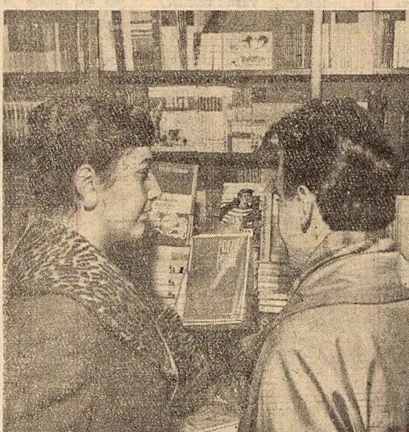
Ce carte ne alegem?