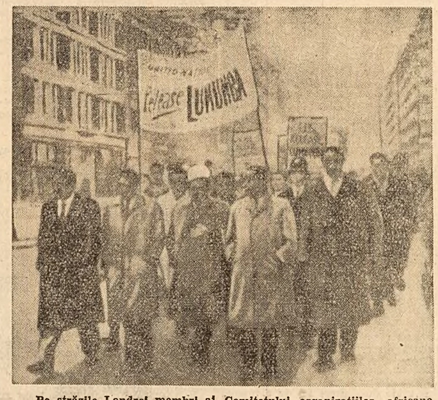
Pe străzile Londrei membri ai Comitetului organizațiilor africane demonstrează pentru eliberarea lui Patrice Lumumba.

Partidul progresist național din Birmania a dat publicității o declarație în care sprijină lupta justă a poporului congolez.