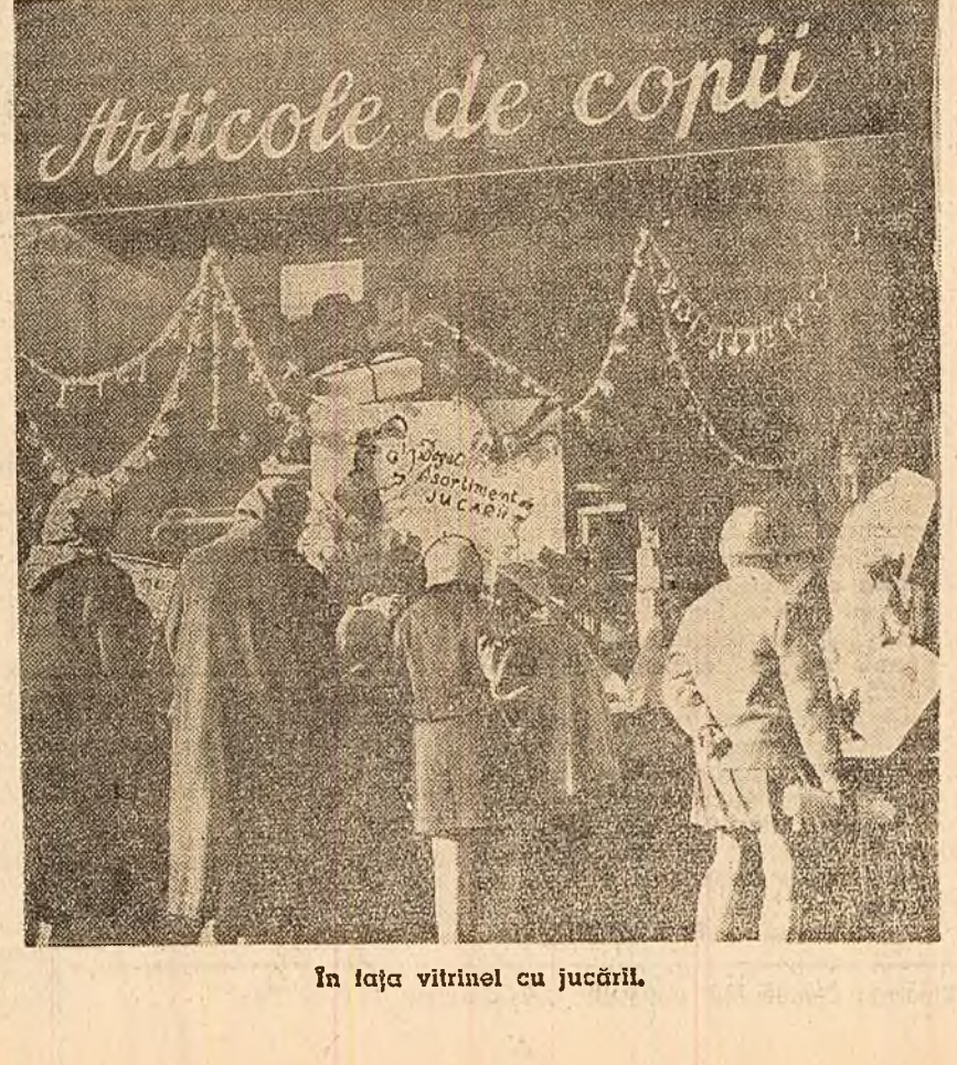
În fața vitrin

Anglia este încă țara cu cel mai mare hinterland colonial. Cuprinzînd 8 milioane km. p. și o populație de 48 milioane de locuitori, acesta reprezintă ca populație 52 la sută, iar ca suprafață 54 la sută din totalul teritoriilor coloniale. În Africa, principalele ei colonii sînt: Kenya, Rhodesia, Nyassaland, Basutoland, Bechuanaland, Gambia, Zanzibar, Tanganica, Uganda ș.a. În Uganda, al cărei teritoriu e declarat în proporție de 90 la sută „domeniu al coroanei britanice”, din 100 de nou-născuți 40 nu ating vîrsta de 15 ani. În Rhodesia de sud este în vigoare „legea cu privire la stăpîni și slujă”, potrivit căreia populația autohtonă este ținută în condiții de sclavie. Două companii guvernamentale engleze, care jefuiesc în colonii au realizat într-un singur an un profit net de 200.000.000 lire sterline.