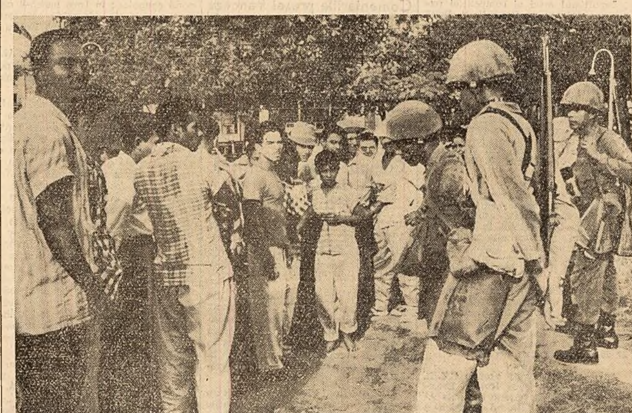
La Puerto Armuelles (Panama) au avut loc recente incidente sîngeroase între armata și muncitorii greviști de la întreprinderile monopolului nord-american „United Fruit Company”, supranumit și „Monstrul verde”. În cișeu: un aspect din timpul grevelor.

Se crede că dacă „United Fruit Company” nu-și va schimba poziția,