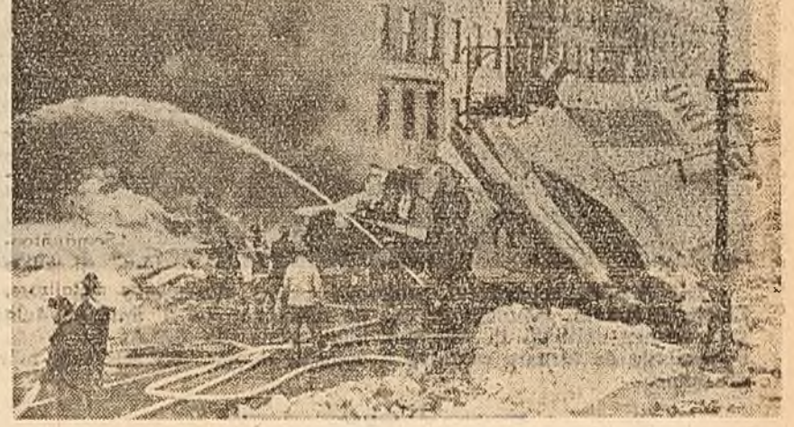
Recent, deasupra New Yorkului s-au ciocnit două avioane de pasageri. În această catastrofă aeriană și-au găsit moartea 135 de persoane. În clipa: pompieri stingînd incendiul provocat de prăbușirea unuia din cele două avioane.