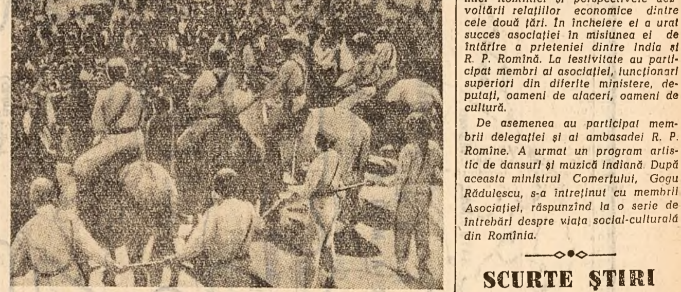
La Quito, capitala statului Ecuador, au avut loc violente demonstrații împotriva politicii S.U.A. Fotografia înfățișează un aspect de la aceste demonstrații: cordoane de soldați apară ambasada S. U. A. de mulțime.

NEW YORK 24 (Agerpres). — La 23 decembrie Chaqu, ambasadorul Indiei la Washington, l-a convins pe secretarul de stat al S.U.A., Herter, asupra situației grave din Laos și a propunut pentru relarea imediată a activității Comisiei internaționale de supraveghere și control în Laos.