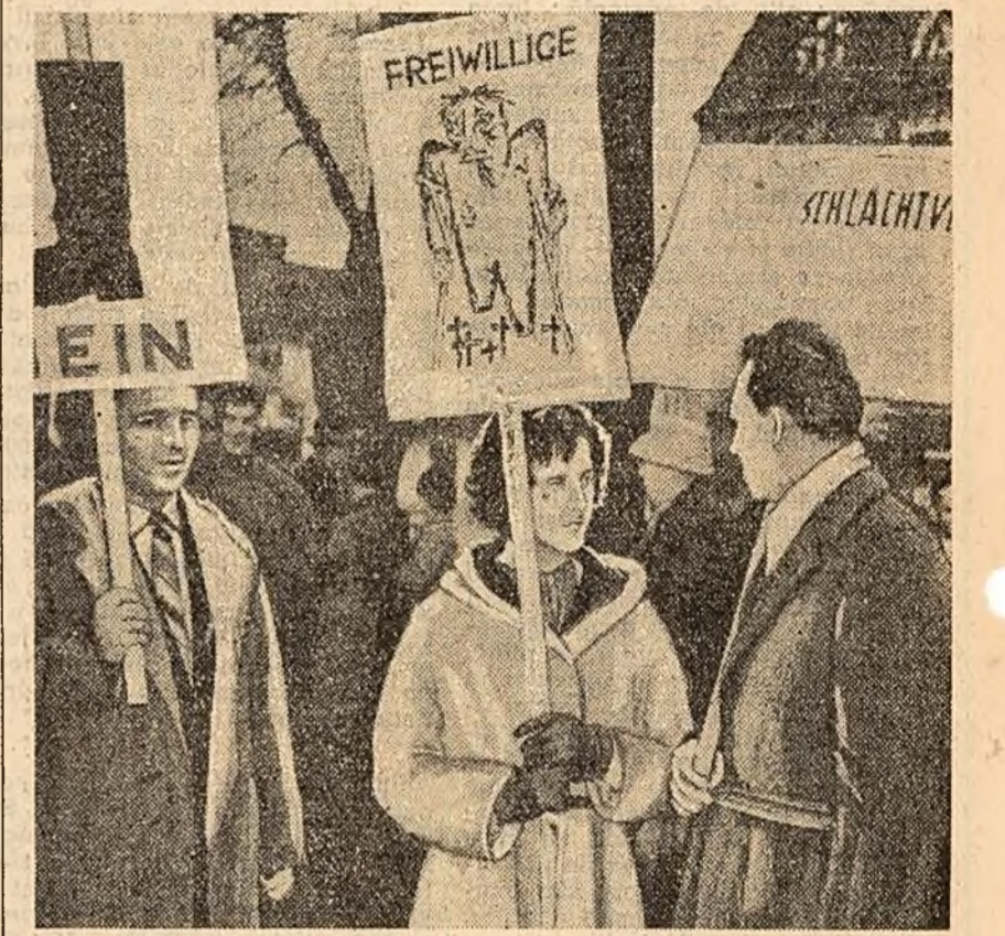
Cetățeni din orașul vest-german Neumünster demonstrează împotriva înarmării atomice a Bundeswehrului.