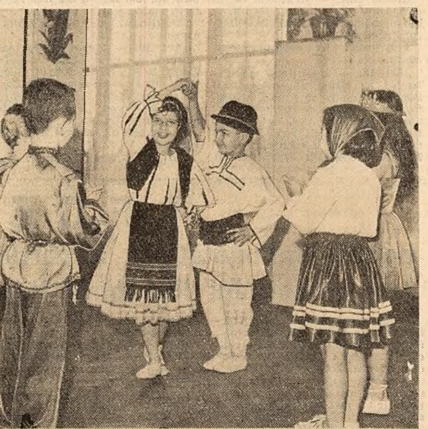
Grupuri de oameni ai muncii, folosind excursiile organizate de O.N.T. Carpați, au mers duminică pe Valea Exchovoi pentru a încerca zăpada proaspătă a munților. Tatăl la Predeal urcînd în trenul care-l va aduce acasă. (Fotografia din stînga). Copiii muncitorilor fabricii de confecții „Gh. Gheorghiu-Dej” din Capitală pregătesc un dans pentru serbarea pomului de iarnă în întreprindere. (Fotografia din dreapta).

PETROȘANI (red. ziarului „Steagul Rosu”). — Cresterea nivelului de trai al minerilor din Valea Jiului este oglindită, între altele, și de cifrele care arată volumul și valoarea bunurilor de consum cumpărate de ei în cursul acestui an. Astfel, ei au cumpărat textile și încălăminte a căror valoare depășește cu 6 milioane lei pe aceea a produselor si-