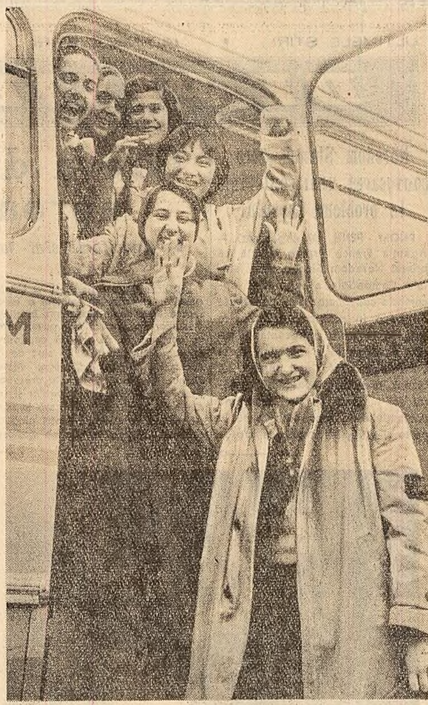
În vacanța de iarnă. Un grup de elevi de la Școala de 7 ani mixtă nr. 76 din Capitală a pornit cu autocarul să facă turul Bucureștilor.