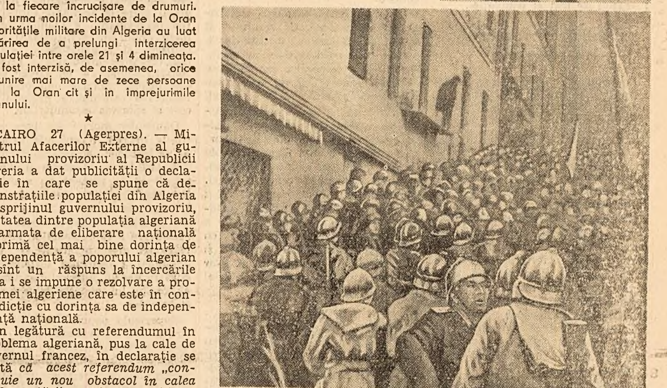
Fotografia de sus înfățișează un militar răufăindu-se cu o fetiță care strigă „Trăiască Algeria liberă!”. În clișeu de Jos, puternicele detașamente militare încearcă să înăbușe o demonstrație a populației algeriene.

În numele partidului republican radical și radical-socialist, Felix Gaillard, președintele acestui partid, s-a pronunțat împotriva apropiatului referendum, subliniind atitudinea negativă a radicalilor față de însuși principiul referendumului. El a declarat că partidul său va vota împotriva politicii guvernului în problema algeriană.