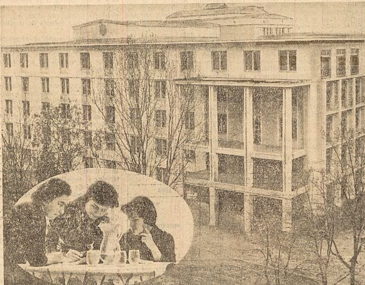
Noua clădire a căminului studențesc din Capitală, str. Plevnei nr. 66. Căminul are 1.000 locuri, cantină cu o capacitate de 350 locuri, săli de lectură etc. În medalion: citeva studenți, noi locatari ale căminului, își pregătesc lecțiile.