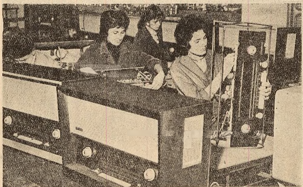
Fabrica „Electronica” din Captaia. La banda de asamblare a aparatelor de radio „Fantezia”.