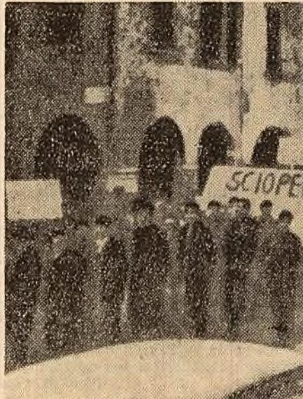
La Pesaro (Italia) circa 4.000 de muncitori, în majoritate tineri, din industria lemnului sînt în grevă de câteva zile. Ei cer majorarea salariilor și condiții mai bune de muncă. În clișeu: Un grup de muncitori manifestează pe străzile orașului.

PNOM PENH 27 (Agerpres). — Agenția France Presse anunță că prințul Norodom Sianuk, șeful statului Cambodgia, a cerut la 27 decembrie convocarea unei conferințe de pace în problema Laosului la care să ia parte reprezentanții țărilor participante la conferința de la Geneva din 1954. După părerea lui Sianuk, la această conferință, al cărei țel urmează să fie încheierea armistițiului în Laos, trebuie să ia parte și țările învecinate cu Laosul.