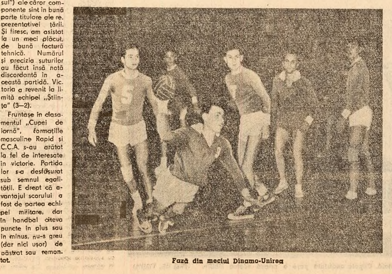
Faza din meciul Dinamo-Unirea

Sportul care a inaugurat anul sportiv 1961 a fost handbalul, iar locul "inaugurat" - sala Floreasca. Aici s-au disputat leri după-amiază, nu mai puțin de șase meciuri în cadrul fazei pe Capitală a "Cupei de Iarnă".