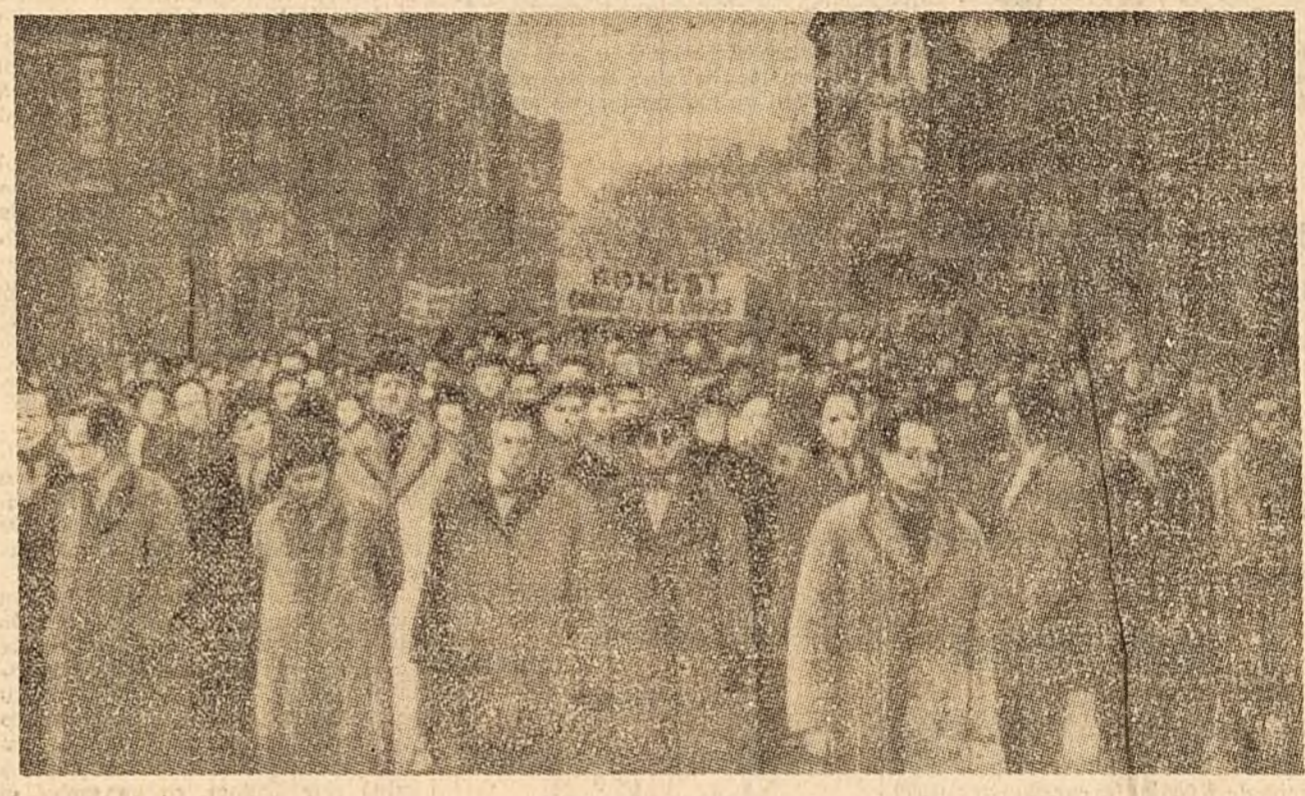
Demonstrație a greviștilor belgieni pe străzile Bruxellesului.