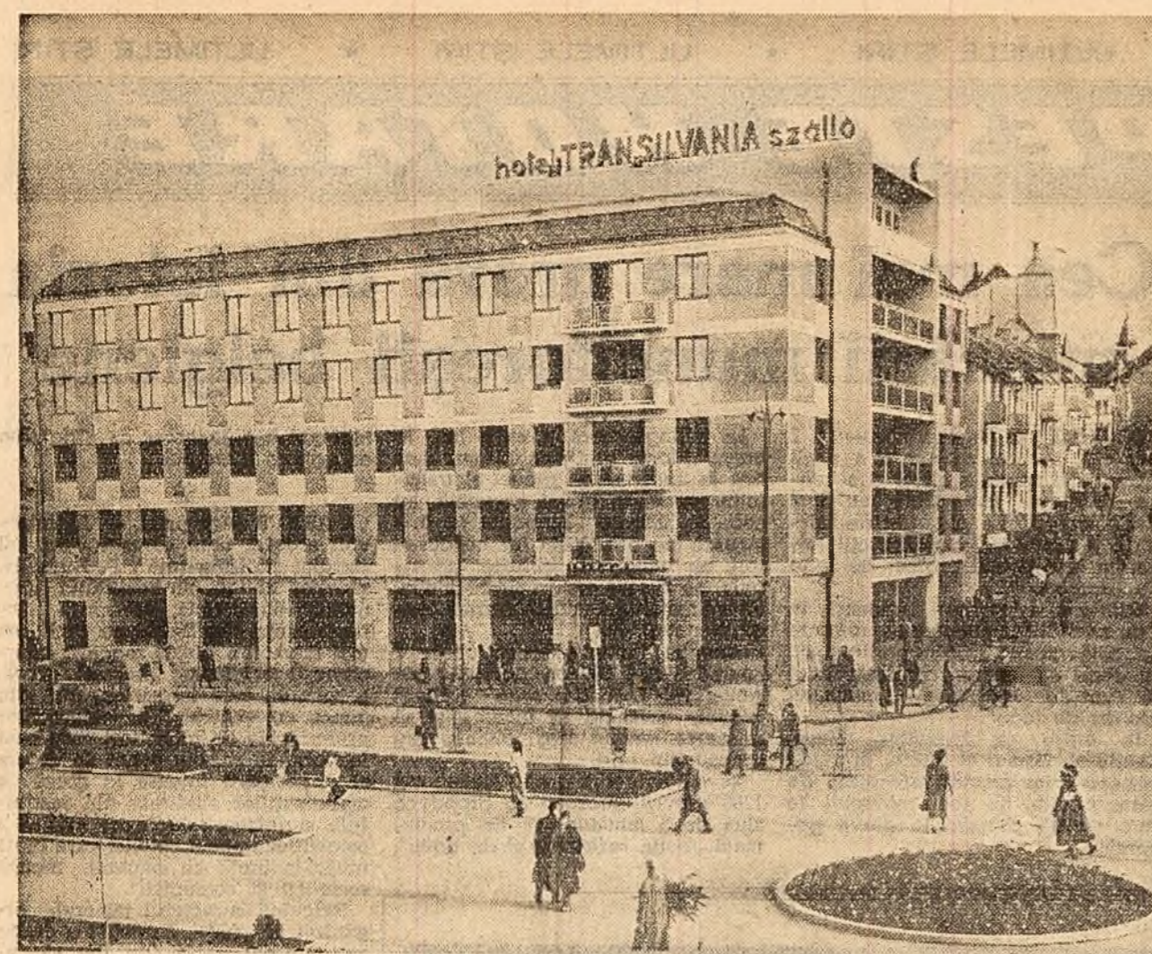
A fost dat în folosință noul hotel din centrul orașului Sibiu. Apartamente, camere cu unul și cu două paturi și camere mari pentru sportivi, în total 126 de camere și 256 de locuri stau la dispoziția oaspeților. Ele sunt mobilate cu gust, au radio și telefon. La parterul stău la dispoziția oaspeților de deservire.