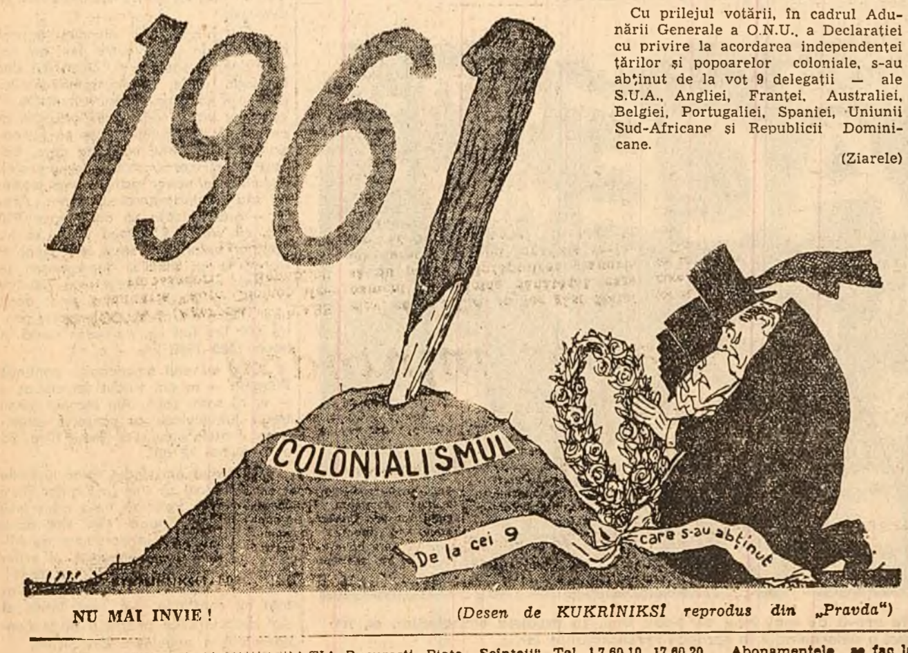
NU MAI INVIE! (Desen de KUKRINIȘKI reproduc din „Pravda“)

HANOI 2 (Agerpres). — La 1 ianuarie reprezentantul guvernului legal al Laosului, Quinim Folsena și președintele Comitetului Central al Partidului Neo Lao Haksat prințul Sudavong au adresat primul ministru al Laosului, prințul Suvanna Fumma, o telegramă în care îl invită să se înapoieze cît mai grabnic în Laos.