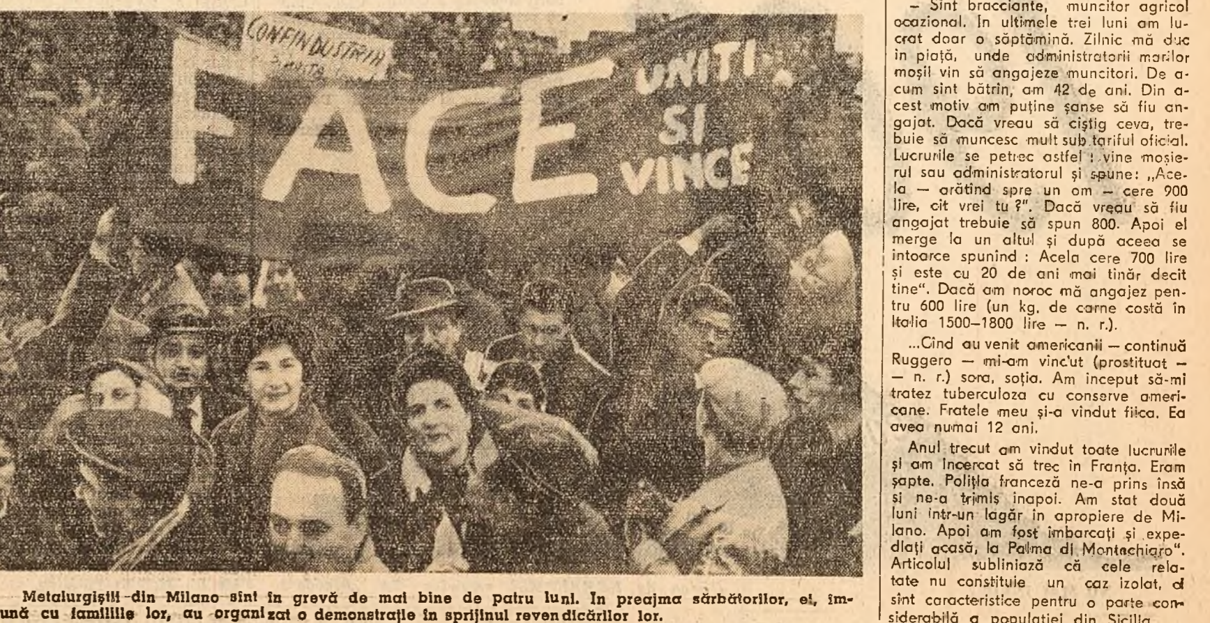
Metalurgiștii din Milano sînt în grăv de mai bine de patru luni. În precăma sărbătorilor, ei împreună cu familiile lor, au organizat o demonstrație în sprijinul revendicărilor lor.

„Reportaj despre Sicilia. Zadarnic veți căuta însă în el sursele și descrierile despre primăvară, atât de frecvente în proiectele de călătorie. Respirul o mizerie strîngătoare la cer. În toate acestea nu se potec undeva departe, în inima Africii, ci într-un stat cucerit de un guvern democrat-crescîn, membru al N.A.T.O.” — scrie, printre altele, autorii unui articol apărut în revista vest-germană „Der Stern”.