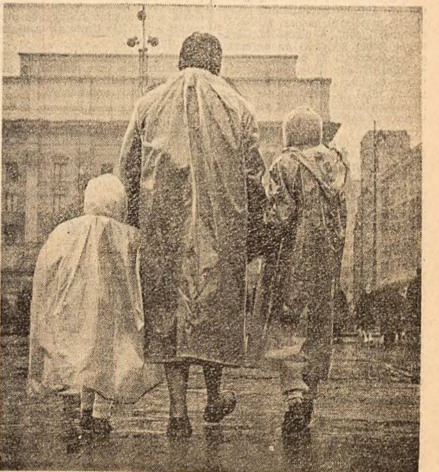
O duminică ploioasă

Vîntul va sufla pînă la potrivit din sectorul nord-vest. Temperatura în scădere ușoară în celelalte regiuni ale țării. În cursul nopții minimele vor oscila între minus 3 și minus 8 grade în nordul țării și între minus 2 și plus 3 grade în celelalte regiuni, exceptînd litoralul unde vor fi mai ridicate. Ziua maximele vor fi cuprinse între minus 2 și plus 8 grade.