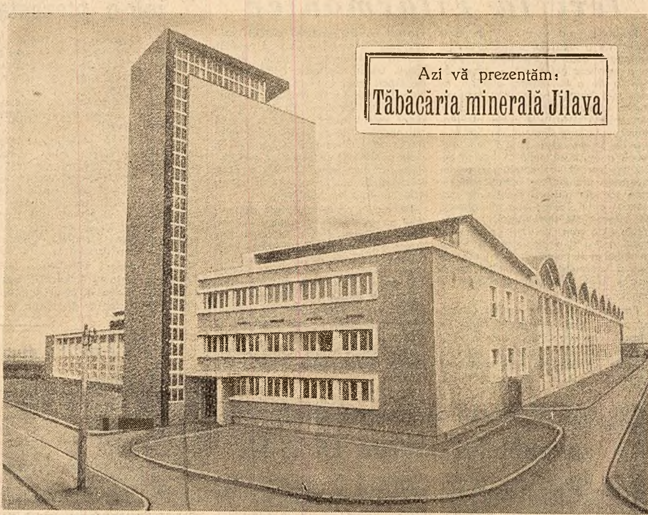
Azi vă prezentăm: Tăbăcăria minerală Jilava

Totul trebuie organizat operativ — dar cu răspundere și seriozitate — încît într-un timp scurt contractul colectiv și bugetele financiare și de asigurări sociale să fie definitivare în toate întreprinderile.