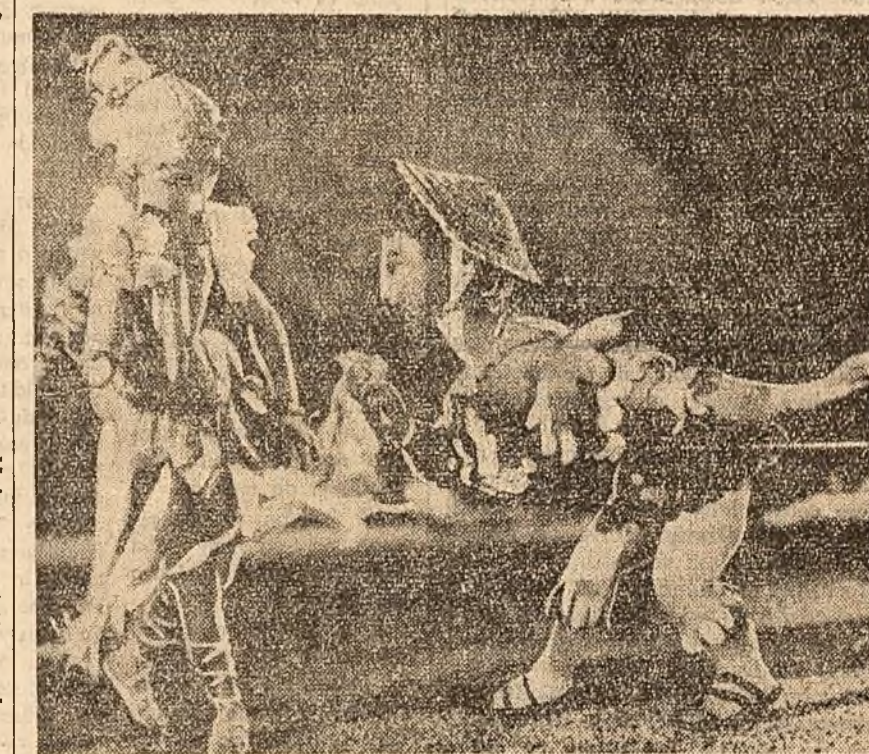
Iată doi dintre interpretii-păpuși ai filmului lui Trnka „Visul unei nopți de vară”, după Shakespeare.