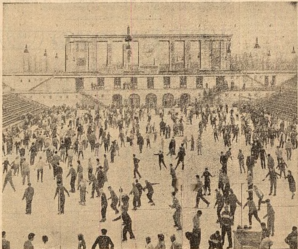
Afluență la palinocruzul „23 August” din Capitală (foto 1). Sostrea în Capitală a elevilor școlii sportive nr. 1 care și-au petrecut vacanța la Bușteni și Lacul Roșu (foto 2). Ieri, la Palatul pionierilor din Capitală, peste 700 pionieri au venit să vizioneze spectacolul „O călătorie nemăpomenită”, interpretat de colegii lor, membri ai cercurilor de artă dramatică și coregrafe de pe lângă palat. Iată o scenă din spectacol (foto 3).