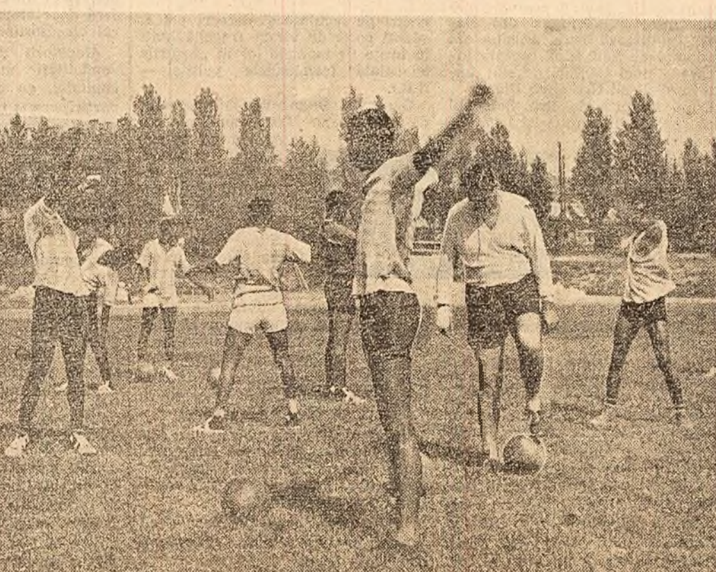
Echipa națională de fotbal a Guineei, la un antrenament.