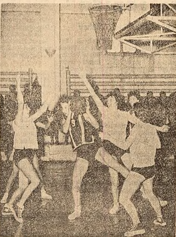
Un moment al meciului Rapid-C.S. Oradea.

Campionatele republicane de baschet, în plină desfășurare, au programat ieri o serie de meciuri echilibrate, care — firesc — au atras în mod special atenția publicului spectator. În campionatul feminin, „capul de afiș” l-a deținut partida Rapid-C.S. Oradea. Lucru normal, întrucât ambele echipe sînt frunzașe ale clasamentului (Rapid — pe primul loc, C. S. Oradea — pe locul trei). Acest meci a prezentat importanță majoră pentru rapidiste, datorită faptului că la sfîrșitul săptămîinii ele vor susține o partidă internațională cu A.S.J. Varșovia pentru „Cupa campionilor europeni”.