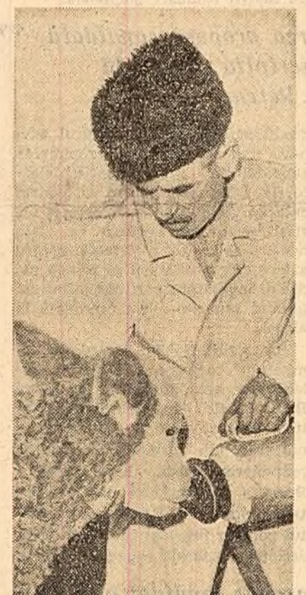
La gospodăria de stat Urziceni, regiunea București, se crește un mare număr de tineret bovin. Prin alăptarea vitelor cu biberonul s-a reușit să se obțină un mare spor de creștere în greutate vie.