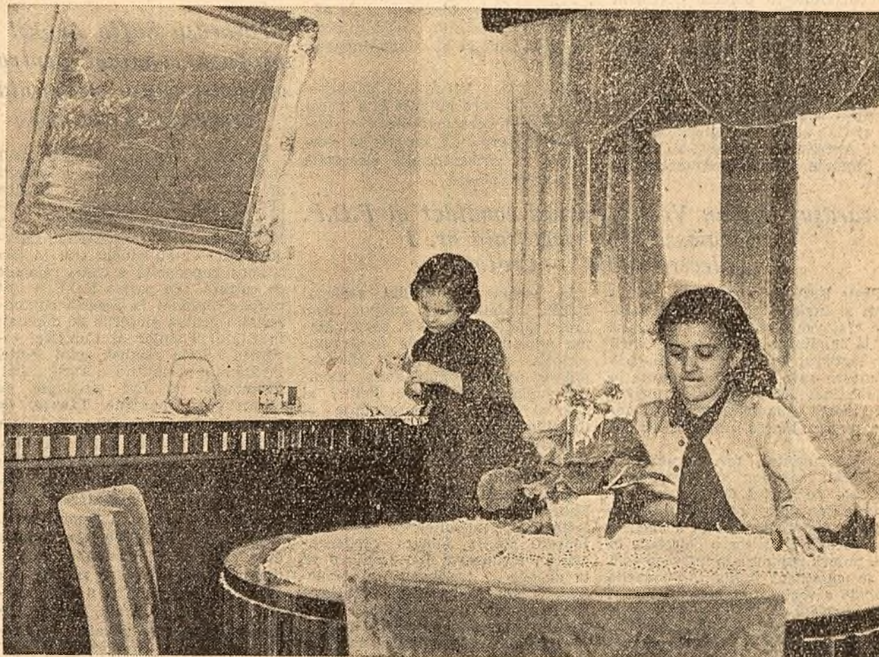
În noua locuință îi e mai mare dragul să puț fiecare lucru la locul lui.

ÎN ÎNTEAGA ȚARĂ CONTINUĂ PROPUNERILE DE CANDIDAȚI ÎN MAREA ADUNARE NAȚIONALĂ; TOTODATĂ AU ÎNCEPUT PROPUNERILE DE CANDIDAȚI ÎN ALEGERILE PENTRU SFATURILE POPULARE. ÎN PAGINA 2-a: RELATĂRI DE LA ADUNĂRILE OAMENILOR MUNCH PENTRU PROPUNERI DE CANDIDAȚI AI FRONTULUI DEMOCRATIEI POPULARE.