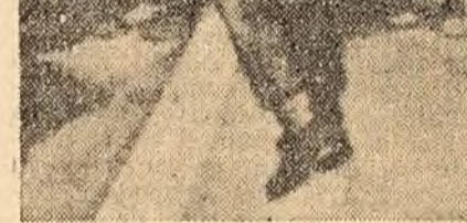
Bande înarmate ale lui Mobutu atacă populația care demonstrează împotriva amestecului imperialist în Congo.

Hammarskjöld și-a scurtat călătoria prin țările africane și asiatice în legătură cu convocarea, la cererea Uniunii Sovietice, a Consiliului de Securitate al O.N.U. pentru examinarea situației din Congo.