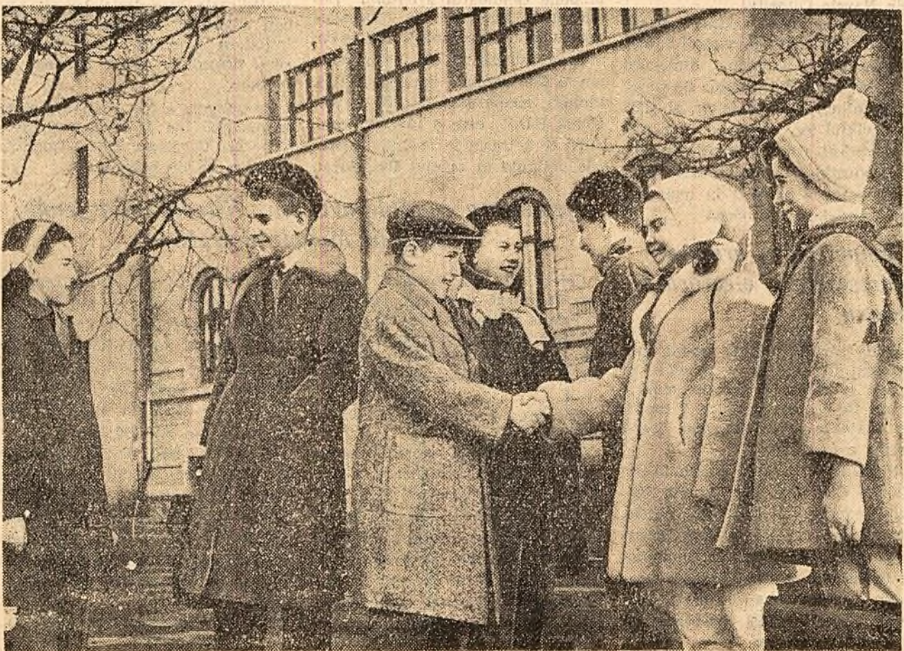
Tu cum îi-ai potrecut vacanța?