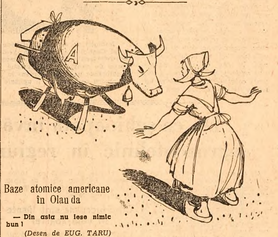
Baze atomice americane în Olanda. — Din asta nu iese nimic bun! (Desen de EUG. TARU)

NEW YORK 12 (Agerpres). — Agenția U.P.I. relatează că în urma grevei personalului remorcherelor din portul New York, care a intrat în a treia zi, marea metropolă americană este amenințată cu reducerea jumătate a aprovizionării cu alimente. Greviștii sînt sprijiniți de Sindicatul din New York al șoferilor de camioane, care numără 125.000 de membri și care au refuzat să treacă prin liniile pichetelor de grevă pentru a încălca alimentele, de carbune și alte mărfuri sosite la gări și stațiuni terminus. Muncitorii feroviar și alți muncitori de la operațiunile de încărcare și descărcare a mărfurilor sprijină de asemenea greva. Autoritățile au declarat că din cauza grevei, la 12 ianuarie aprovizionarea New Yorkului cu carne, fructe și vegetale proaspete a fost redusă la jumătate. La 12 ianuarie au început tratative între sindicatul muncitorilor din portul New York și cele 11 societăți de care depind remorchererele și ferry-boaturile din acest port.