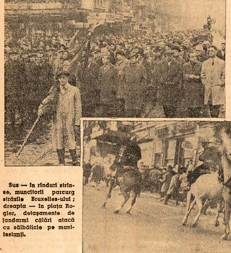
Sus — în rîndul strîns, muncitorii parcur strălele Bruxelles-ului; droapla — în placa Rogier, detașamente de jandarmii cătării atacă cu sălbăticie pe manifestanți.

ultima săptămîină a grevei. O vom duce pînă la capăt. Va trebui să mai facem cîțva timp sacrificii. Vom rezista mai multă vreme decît adversarii noștri”. În continuare, André Renard a cerut încă o dată retragerea proiectului de lege de „economii” și a overtizat că greviștii din Valonia vor recurge la ultima armă — singurea fumalelor înalte la oțelării și bateriile de cocs. Deși în unele centre a fost reluat lucrul, în întreaga Valonie și în unele orașe importante din Flandra, ca de pildă, portul Anvers, greva continuă. Agenția France Presse relatează că greviștii, care sînt ferm hotărîți să continue lupta lor, au întreprins o serie de acțiuni împotriva spărgătorilor de grevă în sectorul căilor ferate, împiedicînd reluarea traficului feroviar pe o serie de linii importante.