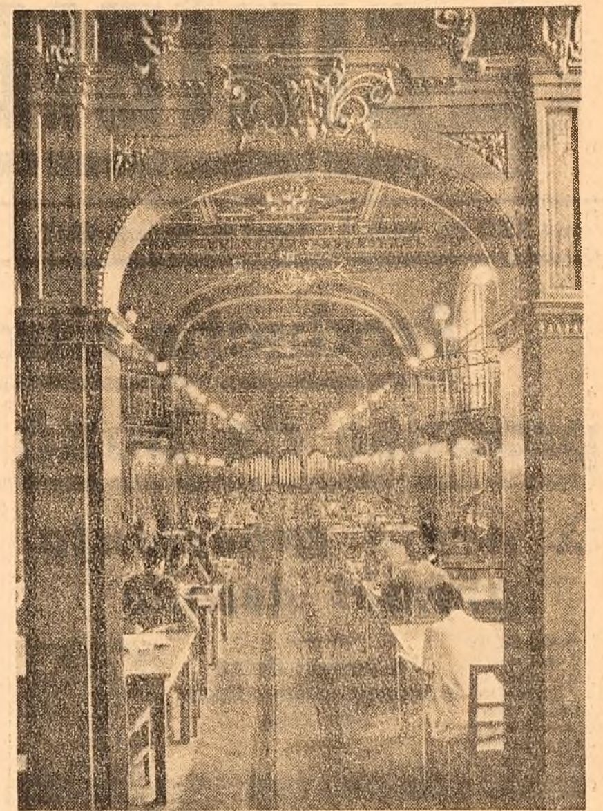
La biblioteca Institutului politehnic din Iași.