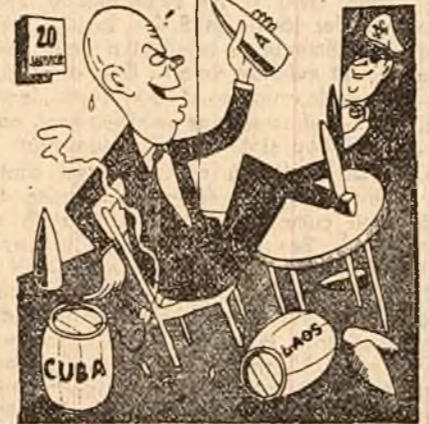
Desen apărut în ziarul „L'HUMANITE”.

Model de atitudine leninistă față de examinarea problemelor de importanță vitală pentru construcția comunistă — după cum subliniază ziarul „Pravda” în articolul său de fond — lucrările Plenarei C.C. al P.C.U.S. reflectă înalta grijă a partidului față de bunăstarea și interesele poporului.