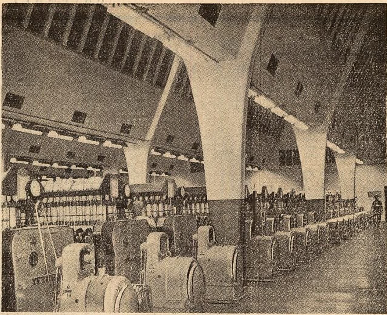
Aspect de la noua filatură a uzinelor textile „Gheorghe Doja” din Sl. Gheorghie.