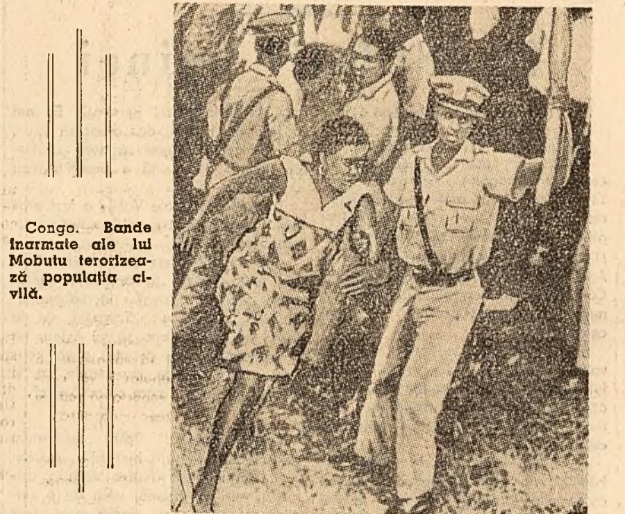
Congo. Bande înarmate ale lui Mobutu terorizează populația civilă.