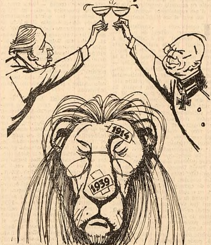
LEUL BRITANIC: — „Îmi amintesc de toate ciocnirile...” (Desen de EUGEN TARU)