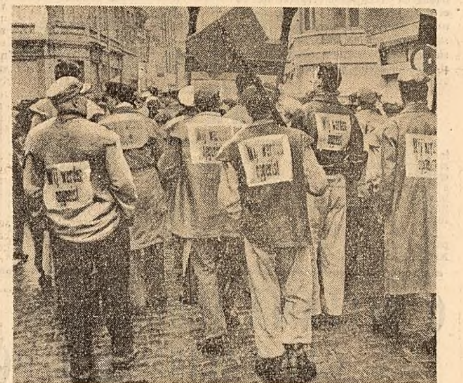
Anvers (Belgia). Salariații din instituțiile municipale, rechiziționați la lucru cu forța de către autorități, își manifestă solidaritatea cu greviștii purtînd pe spate placarde cu inscripția: „Am fost forțați!”.