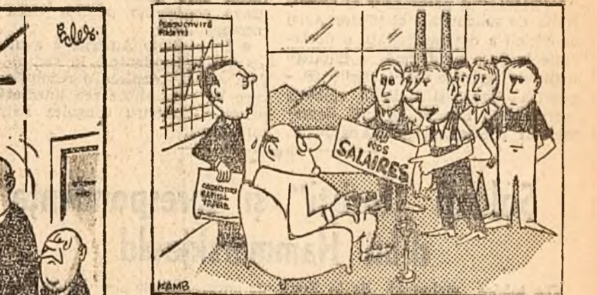
Desenul de mai sus, apărut în ziarul „L'Humanité”, satirizează pretențiile monopolurilor de a-și „cointeresa” pe muncitori sub forma demagogică a asociației „capital-munca”. În explicație se spune: Pentru că vrei să ne „cointeresezi”, să vorbim despre ce ne interesează? Desenul din stînga, reprodus din ziarul „Daily Worker”, se referă la situația a mii și mii de muncitori cărora patronii le hărăzesc o săptămîni incompletă de lucru cu scăderea corespunzătoare a salariilor. Desenul este însoțit de următorul text: Și în felul acesta, începînd de azi dimineață, veți lucra săptămînal tot atîtea ore ca și în trecut. voustru.