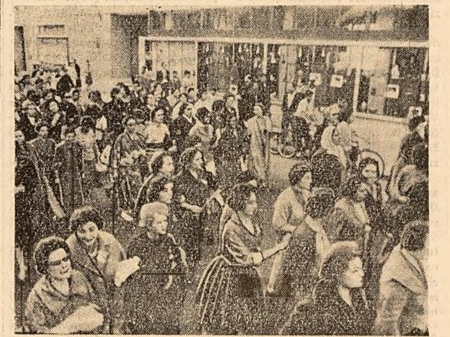
Cairo. Prima conferință a femeilor din țările Asiei și Africii, care s-a deschis la 15 ianuarie în capitala R.A.U., s-a încheiat cu o mare demonstrație în cursul căreia participanții au cerut încetarea amestecului imperialist în Congo și a războiului colonialist francez împotriva poporului algerian.