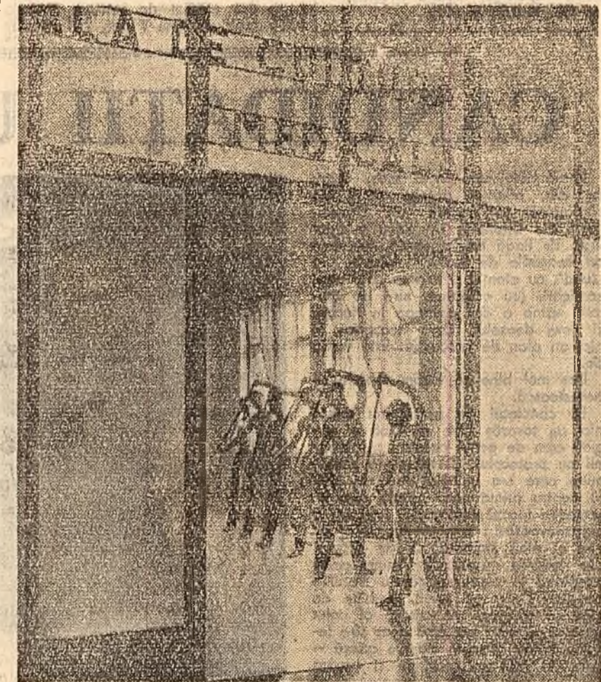
În plină lărnă, în sala de cultură fizică medicală a sanatoriului balnear din Eforie.