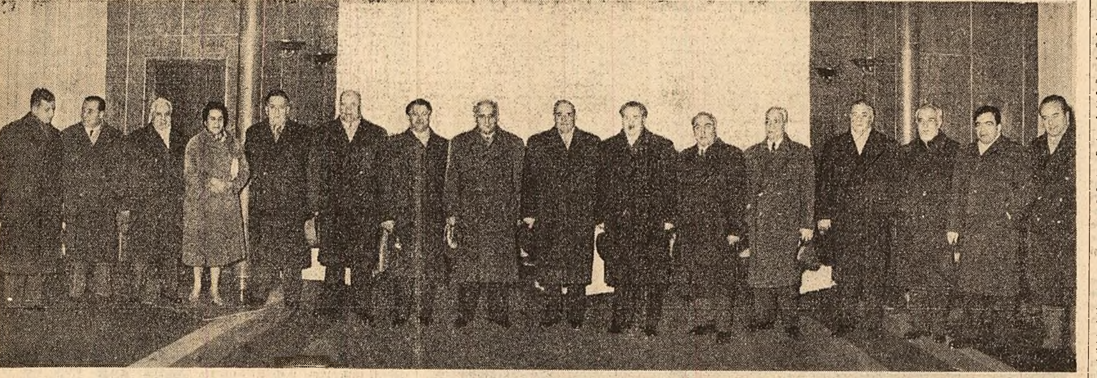
Pe peronul gării Băneasa, în seara zilei de 20 ianuarie, la plecarea oaspeților bulgari spre patrie. Tovarășii Teodor Jivkov, Anton Iugov și Dimităr Ganev, împreună cu tovarășii Gheorghe Gheorghiu-Dej, Chivu Stoica, Ios Gheorghe Maurer și alți conducători de partid și de stat.

COMITETUL CENTRAL AL PARTIDULUI MUNCITORESC ROMÂN