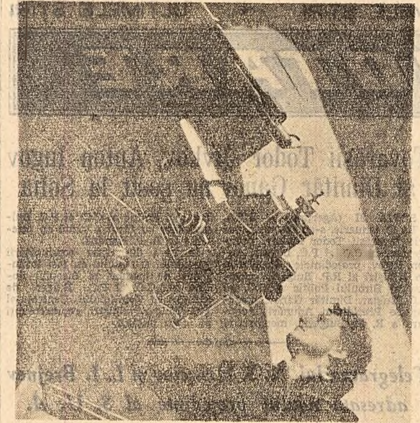
Observatorul astronomic din București. La luneta solară care a fost montată aici cu ocazia anului geografic internațional s-au adaptat dispozitive speciale pentru studierea polarizării luminii în coroana solară.