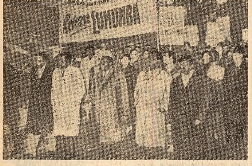
LONDRA. Demonstrație la „Hyde Park” pentru eliberarea primului ministru al Republicii Congo, Patrice Lumumba.