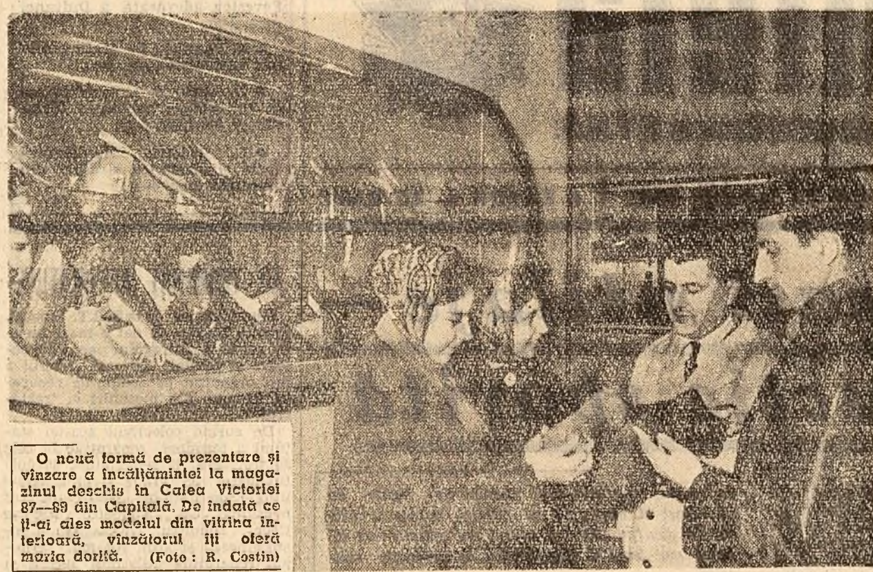
O nouă formă de prezentare și vizuare a încălzimii la mogașul deșezii în Calea Victoriei 87-89 din Capitală. De îndată ce în-oi cles modelul din vitrina interioară, vizitatorul îi oferă maziă dorită.