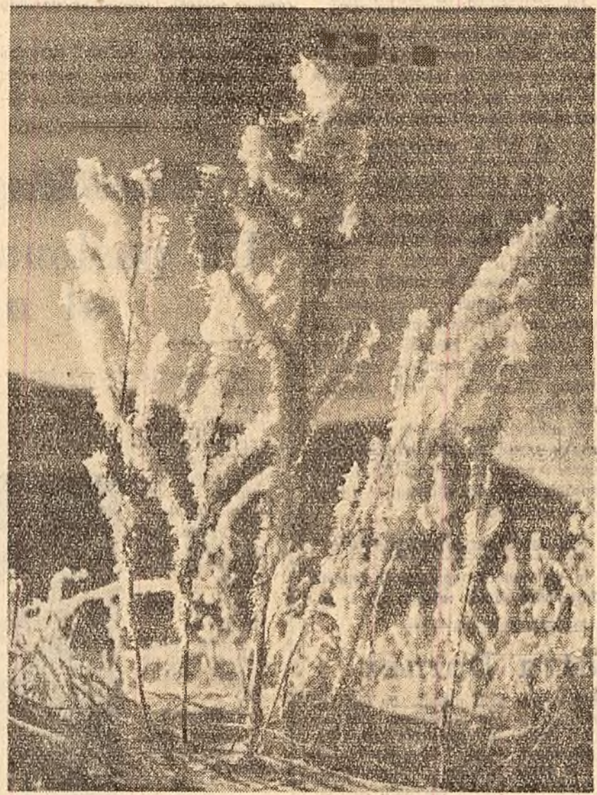
Flori de iarnă.