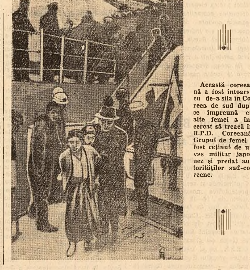
Această coreeană a fost întorsă cu de-a sila în creșea de sud după ce împreună cu alte femei a încercat să treacă în R.P.D. Coreeană. Grupul de femei a fost reținut de un vas militar japonez și predat autorităților sud-coreene.

GUATEMALA CITY 26 (Agerpres). — Corespondentul din Guatemala al agenției Associated Press anunță că trupele care au rămas credincioase vechii junte conducătoare din Salvador au ocupat poziții în fața palatului guvernamental. Studenții au organizat o demonstrație în sprijinul juntei răsturnate.