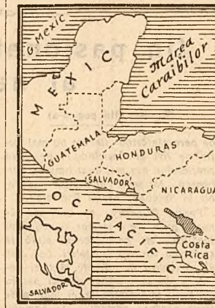
al S.U.A., guvernul juntei militare civile din Salvador a fost răsturnat la 25 ianuarie în urma unei lovituri de stat.