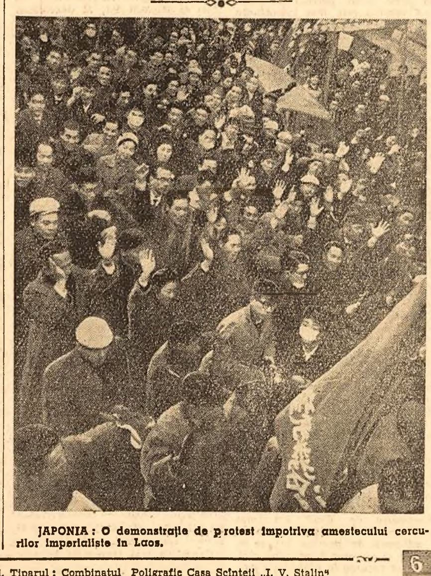
JAPONIA: O demonstrație de protest împotriva amestecului cercurilor imperialiste în Laos.

Luînd cuvîntul în parlament, Kostopolos, deputat din partea „Mișcării transformării naționale”, a subliniat că, încercînd să salveze pe cîțiva miniștri, guvernul grec a pierdut interesul național al țării. Reprezentanții opoziției au cerut demisia guvernului.