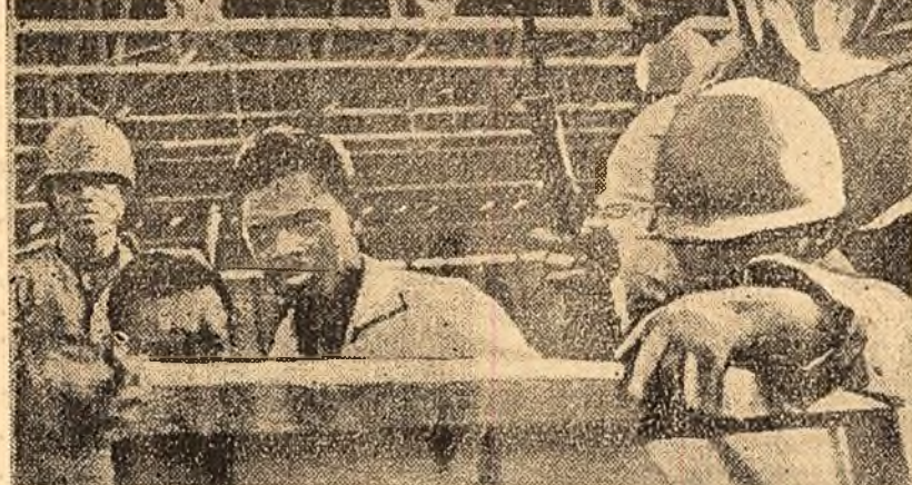
PLUS ON LE CHARGE DE CHAINES PLUS IL GAGNE DE TERRAIN

Bucurîndu-se de sprijinul populației, trupele guvernului legal și forțele