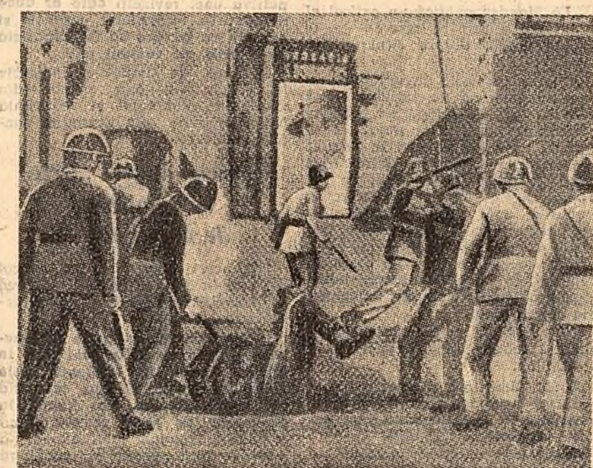
La Lisabona, capitala Portugaliei, a avut loc o manifestație împotriva regimului lui Salazar. Poliția a reprimat cu cruzime demonstrația.