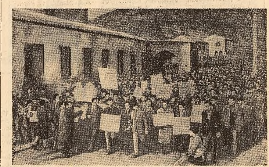
La Cagliari (Italia) o manifestație a minerilor și altor categorii de muncitori greviști.

Subliniind că Ghana, care și-a cucerit independența printr-o luptă dreaptă a tuturor popoarelor Africii drept propria ei cauză și de a crea un periaștilor să ne jefuiască, nu vom tolera ca ei să reprime pe frații noștri din Africa. Imperialismul este dușmanul tuturor popoarelor africane”.