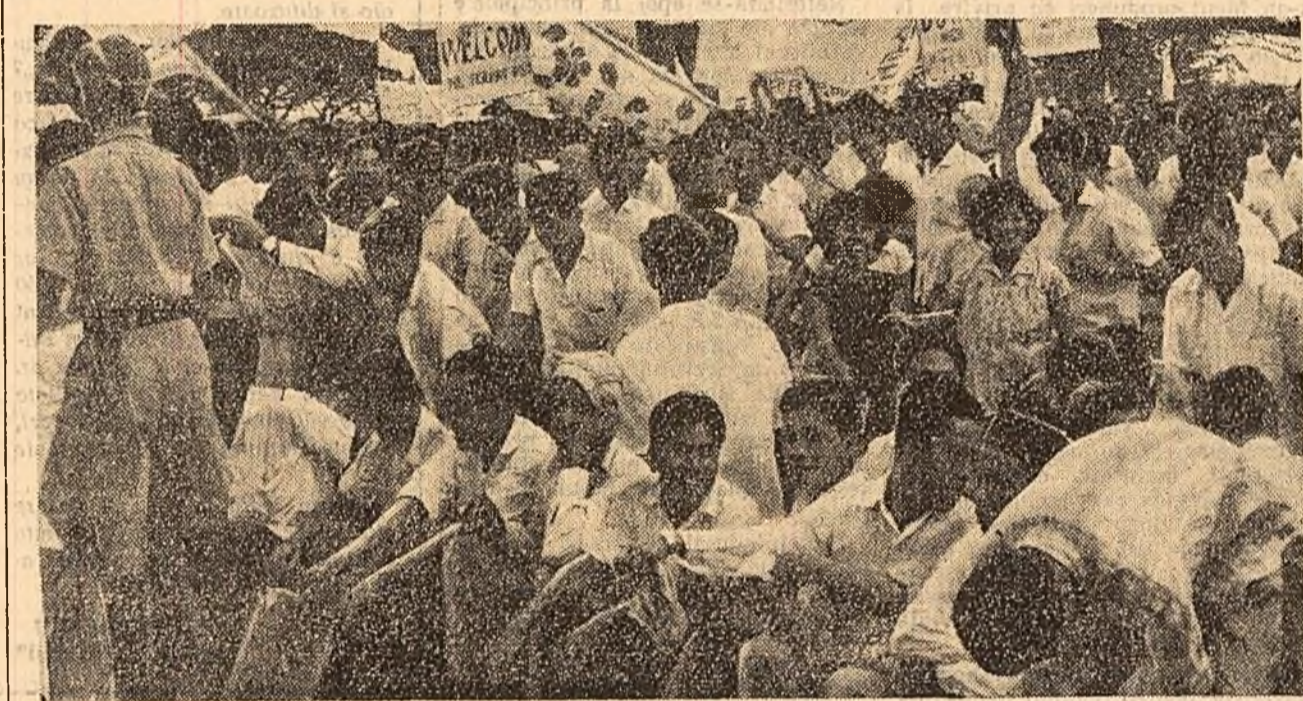
Populația din Singapore întâmpină pe Fehat Abbas, președintele guvernului provizoriu al Republicii Algeria, aflat în drum spre Malacia.