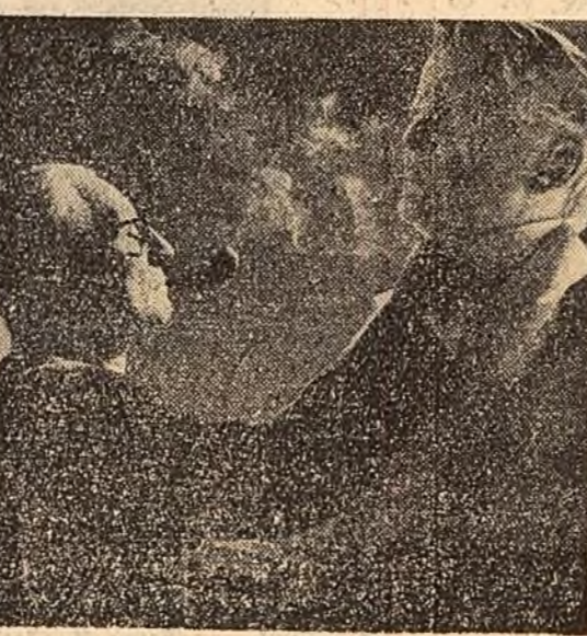
Sculptorul Ion Jalea, artist al poporului, este cunoscut de oamenii muncii ca sursitor devotat al artei plastice românești, ca cetățean care participă activ la viața obștească. În semn de prețuire a activității sale multilaterale, cetățenii circumscripției electorale Dorobanți din Capitală l-au propus candidat în alegerile pentru Marele Adunare Națională.