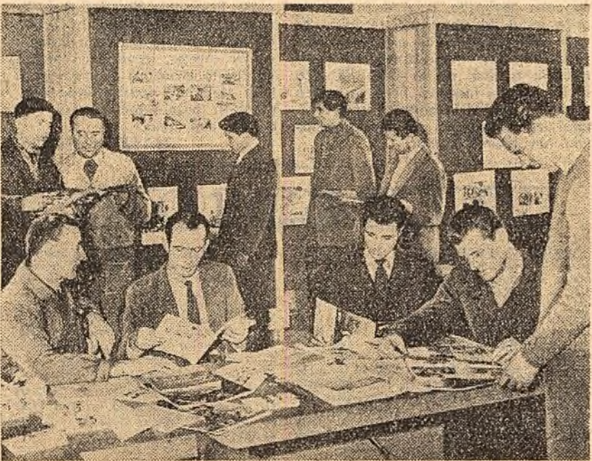
La Casa alegătorului, amenajată la Clubul uzinelor „Republică” din Capitală, vin zilnic numeroși cetățeni. Aici ei participă la diferitele acțiuni organizate de Colegiul Casei alegătorului, citesc broșuri și reviste, iau cunoștință cu ajutorul graficelor și planșelor de realizările social-culturale din cuprinsul raionului 23 August.