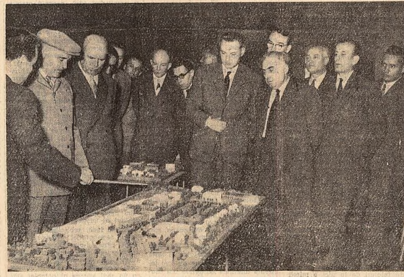
Tovarășii Gheorghe Gheorghiu-Dej, Chivu Stoica și Petre Borilă examinînd macheta unuia din viitoarele cartiere ale orașului Brașov.

În ce privește problemele de circulație și transport, a fost acceptată amplasarea, precum și macheta noii stații de cale ferată pentru călători, aprobîndu-se continuarea lucrărilor de construire a acestei stații. S-a indicat Comitetului executiv al sfatului popular regional să elaboreze proiectul de ansamblu al pieței din fața gării, precum și al legăturilor de circulație cu centrul orașului. Pentru îmbunătățirea transportului în comun, orașul Brașov va căpăta anul acesta mijloace suplimentare de transport. (Agerpres)