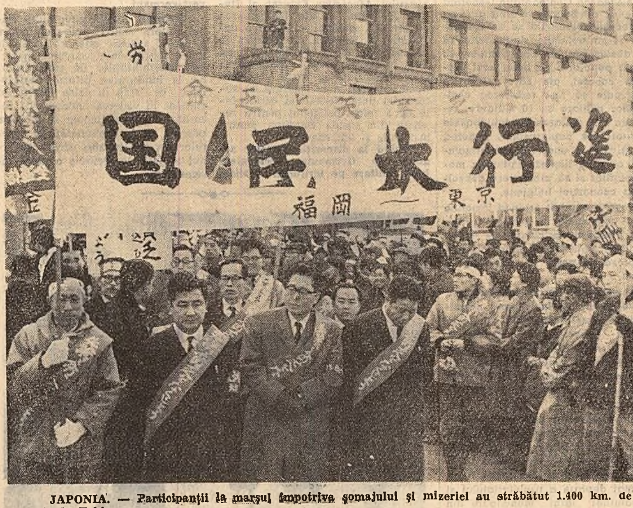
JAPONIA. - Participanti la marşul împotriva şomajului şi mizeriei au străbătut 1.400 km. de la Omuta la Tokio.

MOSCOVA. Prezidiumul Sovietului Suprem al U.R.S.S. l-a numit pe Averil Aristov ambasador al U.R.S.S. in R.P. Polona. Plot Abrasimov a fost eliberat din aceasta functie in legatura cu trecerea sa in alta munca.