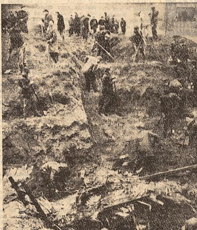
În ultimii ani în Belgia, datorită lipsei de grijă pentru oamenii muncii, s-a produs un mare număr de catastrofe. Recent la Mouli-sous-Fleron un munte de zgură înalt de peste 100 m. s-a prăbușit distrînd 50 de locuințe muncitorești. În fotografie: Aspect din timpul lucrărilor pentru salvarea victimelor.

VARȘOVIA (coresp. „Scînteia”). În seara zilei de 7 februarie, la ambasada R. P. Romîne din Varșovia a avut loc un cocktail cu ocazia prezenței în R. P. Polonă a delegației Uniunii Ziarștilor din Republica Populară Romînă la festivitățile celei de-a 300-a aniversări a presei poloneze. Au fost de față membri ai C.C. al P.M.U.P., conducători ai Uniunii Ziarștilor din R. P. Polonă, reprezentanți ai Ministerului Afacerilor Externe, redactori șefi ai ziarelor centrale și agenților de presă, precum și numeroși alți ziarști și publiciști.