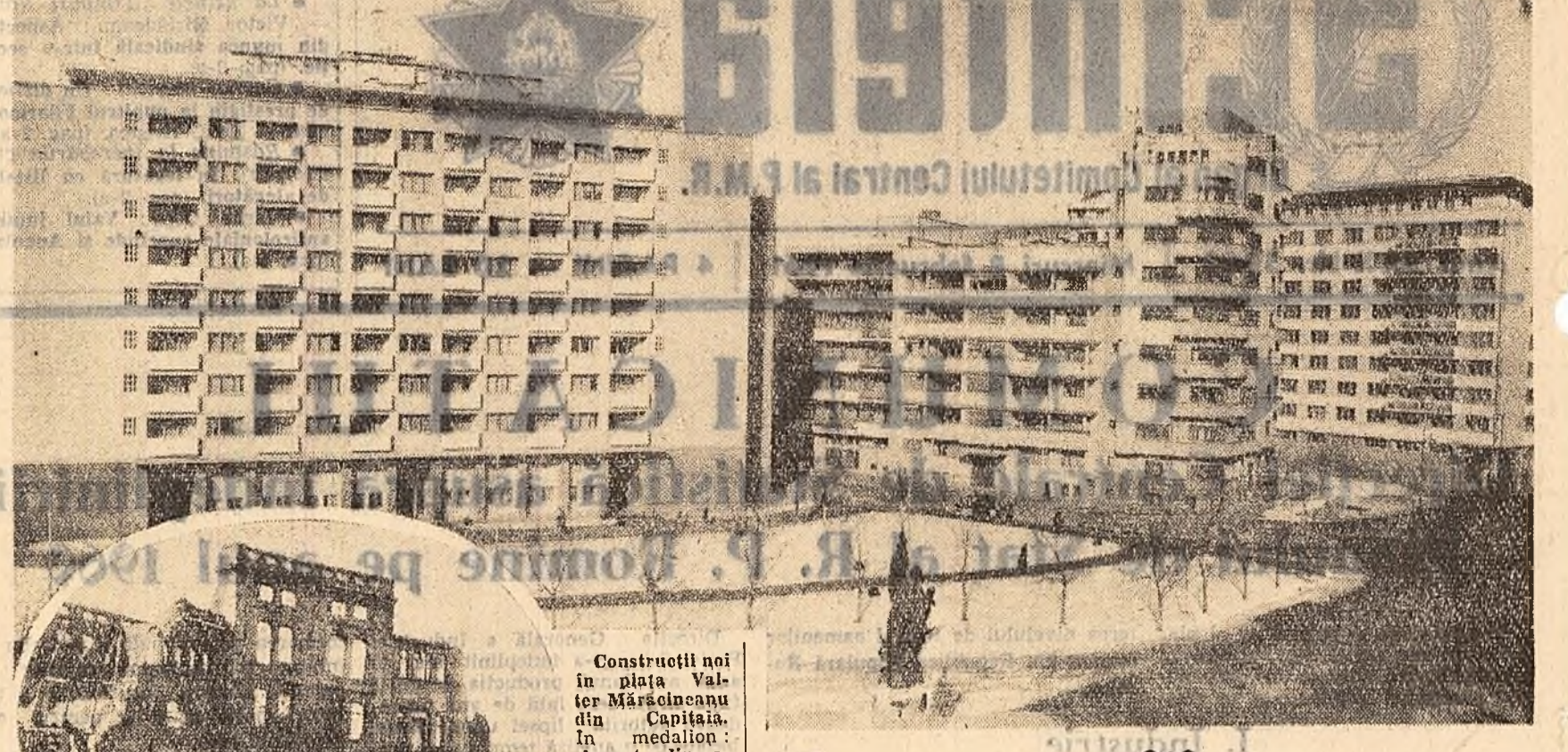
Construcții noi în Piața Valter Mărculeanu din Capitală. În medalia: Aspect din aceeași piață la sfîrșitul celui de-al doilea război mondial.