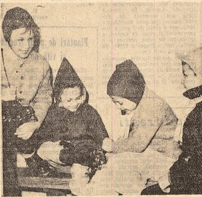
Și acum, pe pînnoar.

TELEZIUNEA: orele 16.00 — Emisiunea pentru cluburile din întreprinderi. Din cuprins: în vizită cu aparatul de filmat la