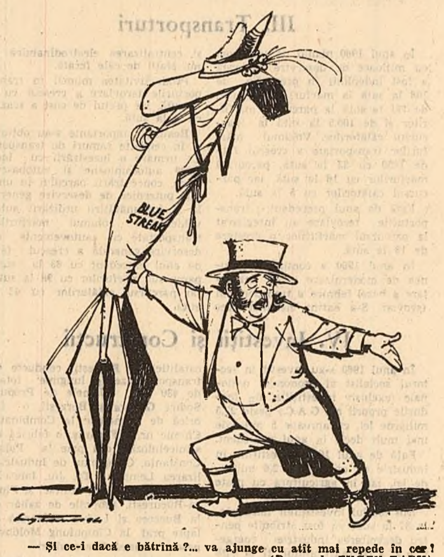
— Și ce-i dacă e bătrînă?... va ajunge cu afit mai repede în cer! (Desen de EUGEN TARU)

Anglia încearcă să plaseze partenerilor europeni învechita armă-rachetă „Blue Streak" în scopul de a fi folosită în vederea cercetărilor cosmice.