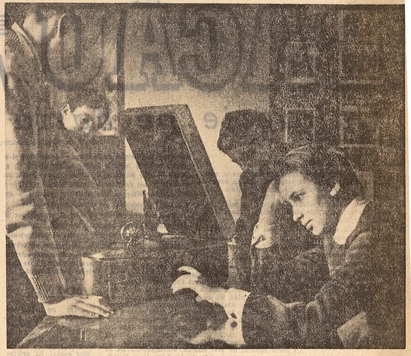
SIMFONIA A IX-A