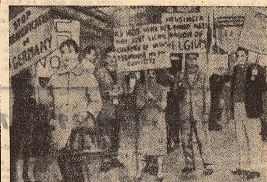
Demonstrație la San Francisco împotriva nimirii lui Housinger în funcția de președinte al Comitetului militar permanent al N.A.T.O.

LONDRA 10 (Agerpres). — La Londra, în districtul Ilford, s-a deschis o expoziție de artă populară românească organizată de Biroul englez pentru expoziții de artă și de I.R.R.C.S.