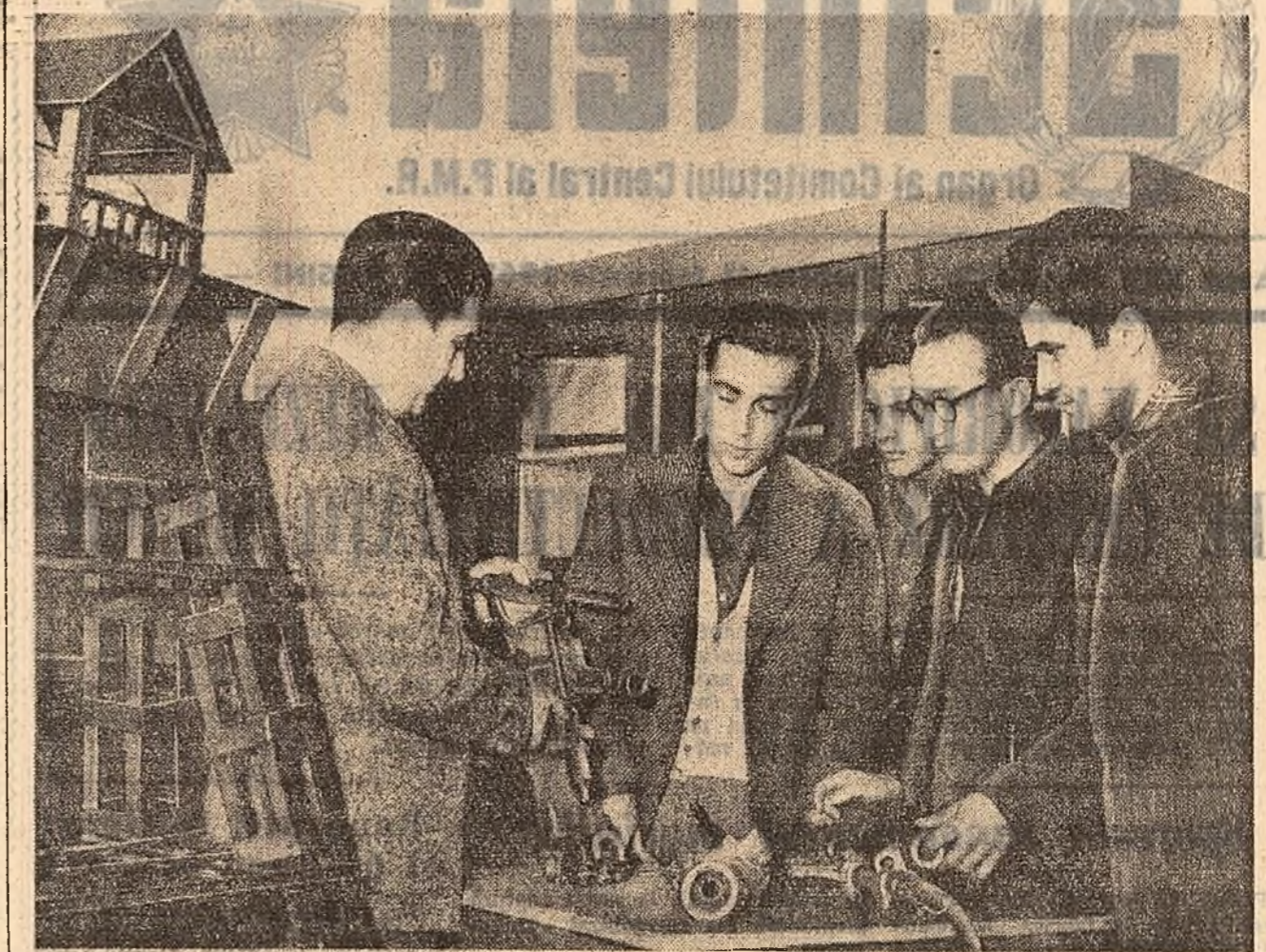
La grupul școlar din Bala Mare se pregătesc cadre de muncitori, tehnicieni și ingineri cu înaltă calificare...