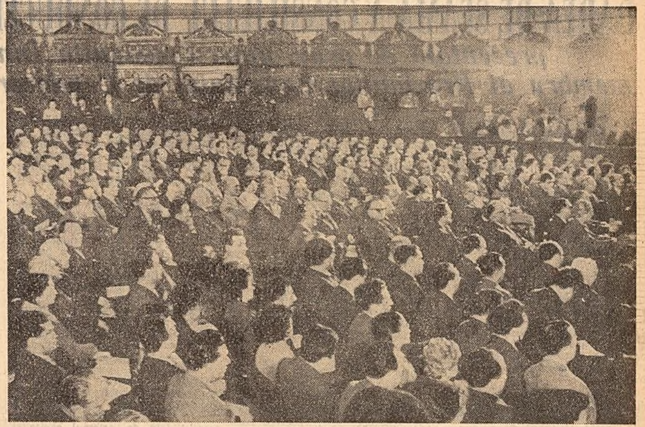
În timpul lucrărilor conferinței.

Vineri dimineața, la Ateneul R.P. Romine au început lucrările Conferinței pe țară a Societății pentru Răspîndirea Științei și Culturii.