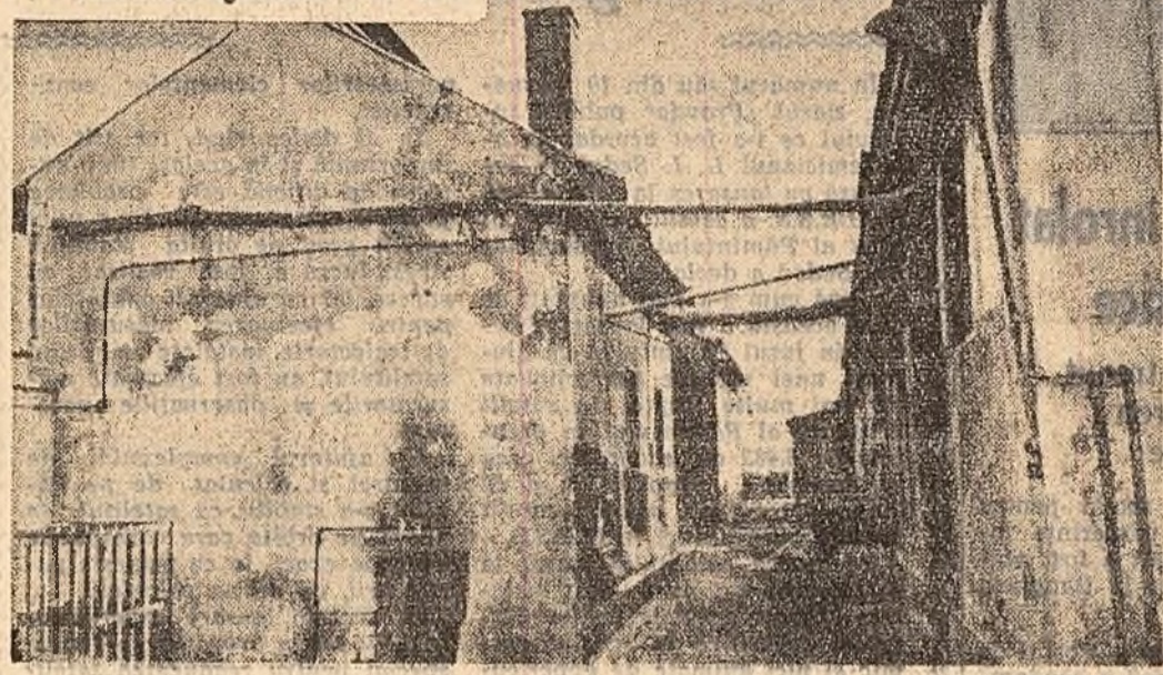
In 1937, la marginea Codlei, concernul german „I. G. Farbenindustrie“ a înălțat o sucursală pentru prelucrarea coloranților aduși din Germania. Toată „fabrica“ se compunea din câteva clădiri înalturi (fotografia de sus). După naționalizare, fabrica s-a dezvoltat mult; au fost ridicate hale și secții noi, dotate cu mașini moderne. În fotografia de jos: Uzinele „Colorom“ Codlea azi.