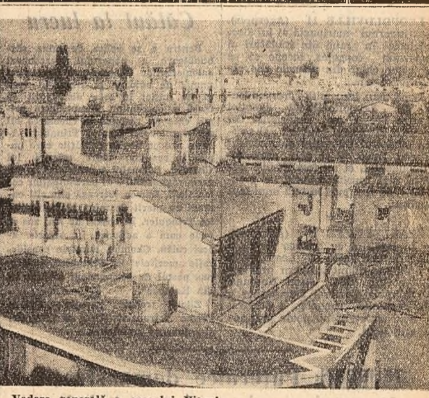
Vedere generală a orașului Nicosia

Patria chiparosului și a cedurii era mistulă de vîndetă și de lupte fratricide alătate de stăpînitorii venetici. În vremea aceasta în