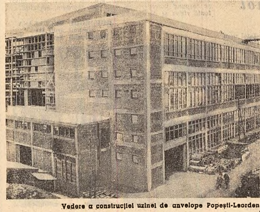
Vedere a construcției uzinei de anvelope Poapești-Leordeni.

De cîteva zile copiii tîrîmilor din satul Fișez, raionul Ilia, învață în școala nouă. Aceasta este cea de-a 85-a școală construită în regiunea Hunedoara în perioada care a trecut de la ultimele alegeri de deputați în Marea Adunare Națională și pînă acum. În satele regiunii alte 65 de școli sînt în prezent în construcție. (Agerpres)