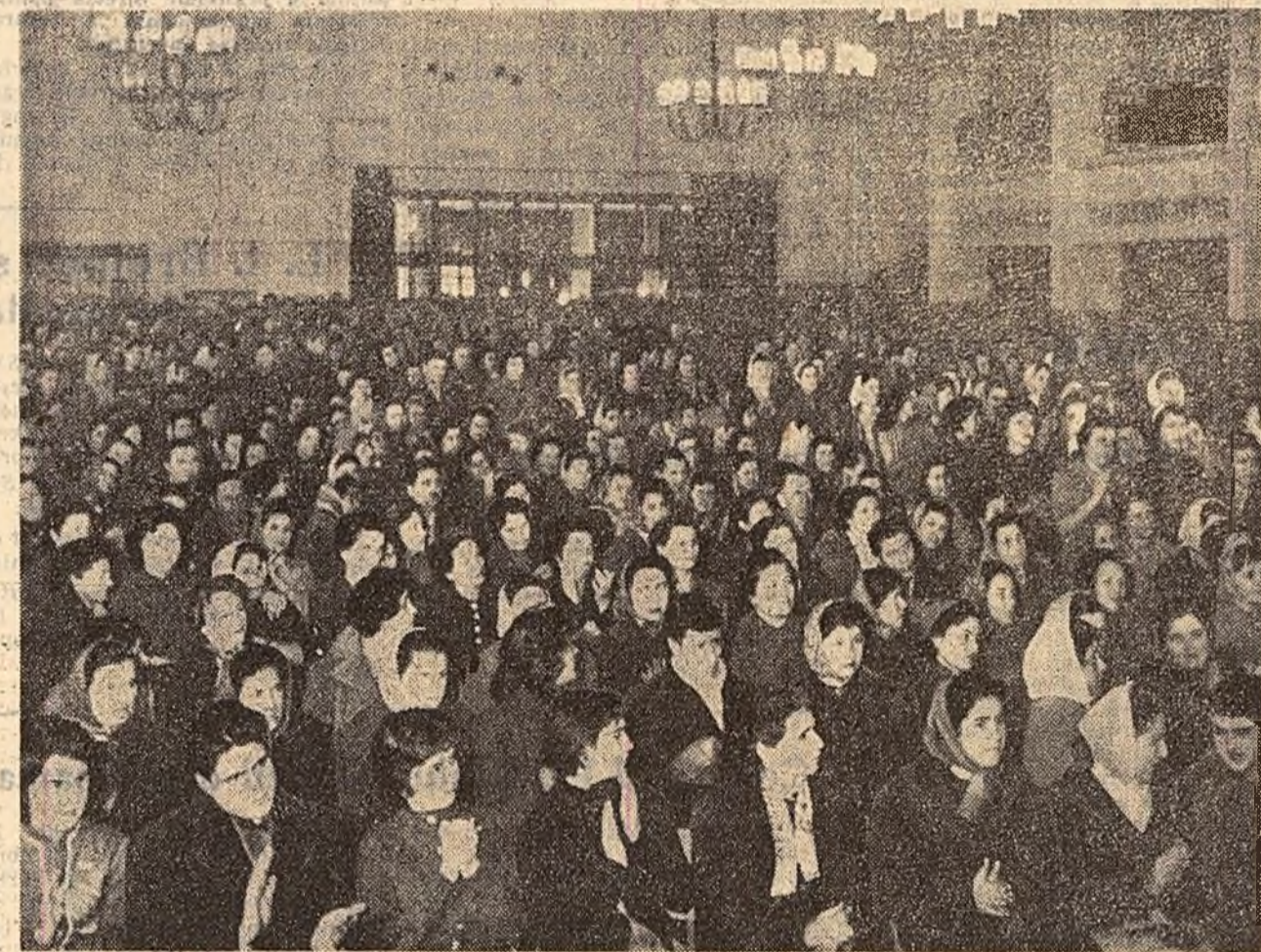
La adunarea de la Fabrica de confecții „Gh. Gheorghiu-Dej“ din Capitală.

Opinia publică din România infierează cu minie pe criminali și pe avocații colonialiștilor care la adăpostul vorbelor mari rostite la tribuna O.N.U. despre „drepturi“ și „legalitate“ s-au dovedit de fapt complici ai asasinilor patrioților congolezi și ai dușmanilor libertății popoarelor africane.