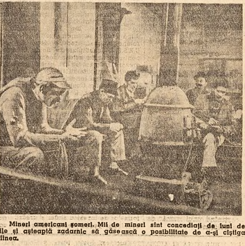
Mineri americani șomeri. Mii de mineri sînt concediați de luni de zile și așteaptă zadarnic să găsească o posibilitate de a-și cîștiga pînă.

secție era de calitate două, in ultimul timp procentul acesta a fost redus la mai puțin de jumătate. Dar cu toate succesele obținute pînă acum, oamenii știu că pot da producție de și mai bună calitate. In fabricile și uzinele din întreaga țară, muncitorii, tehnicienii, inginerii își afirmă hotărîrea fermă de a depune noi eforturi pentru îmbunătățirea continuă a calității produselor, așa cum cer Directivele C.C. al P.M.R. Organizațiile de partid, conducerile de întreprinderi, sindicatele au datorită să studieze amănunțit criteriile principale ale întrecerii socialiste și să întocmească, pe baza analizei temeinice a calității produselor - precum se arată in Directive - planuri proprii de îmbunătățire a calității, prevăzînd măsurile necesare pentru ca fiecare produs să fie realizat la cel mai înalt nivel tehnic și calitativ. Insufletește de chemările Directivelor, colectivele întreprinderilor din întreaga țară muncesc cu entuziasm pentru a întîmplina a 40-a aniversarea a întrecerii partidului cu noi succese in lupta pentru o calitate superioară a produselor.