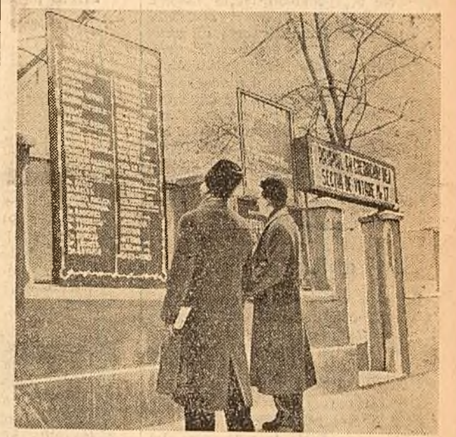
În Capitală se amenajează secțiile de votare. Așa cum se vede în fotografie, la intrarea în secții se află panouri pe care sînt scrise cu litere mari numele străzilor care sînt de secția respectivă.