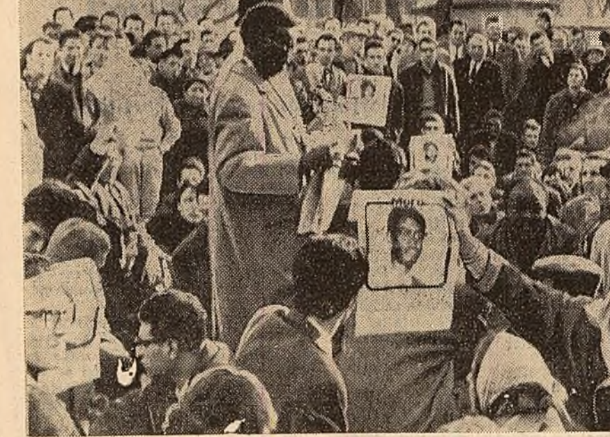
În ciuda interdicției de către autoritățile vestgermane a demonstrațiilor de protest împotriva asasinării lui Lumumba și a celorlalți patrioți congolezi, numeroși studenți din Frankfurt pe Main au organizat puternice demonstrații în fața Universității „Wolfgang Goethe”.