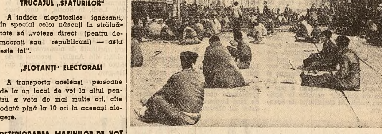
SEUL: Numeroși invalizi de război au stat recent, pe o nădăpă geroasă, în fața parlamentului, cerînd guvernului să ia in considerare mizeria in care se zbat.