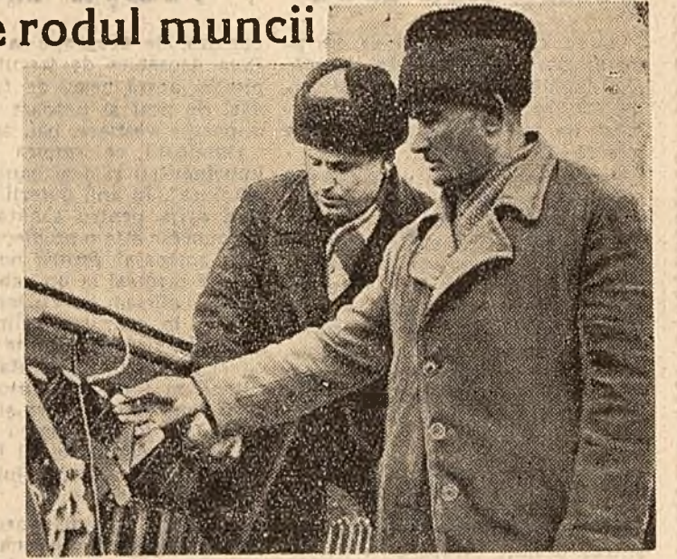
din toată inima candidații F.D.P., candidații noștri, ai întregului popor.

De cînd am pășit pe drumul arătat de partid, drumul belșugului și al buneii stări, s-a schimbat mult și viața noastră. În sat la Cobadin s-au construit și reconstruit aproape 200 de