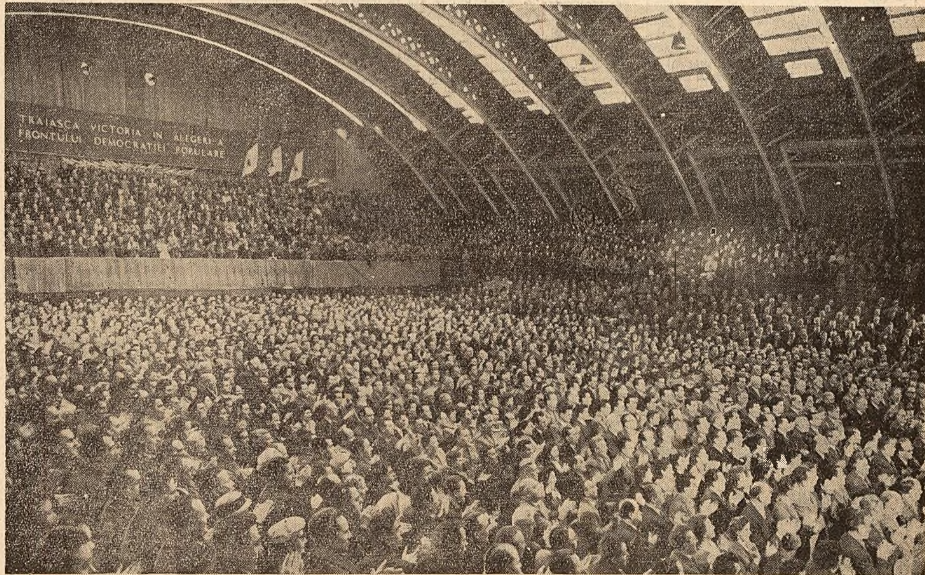
În sala Floreasca, în timpul adunării electorale.