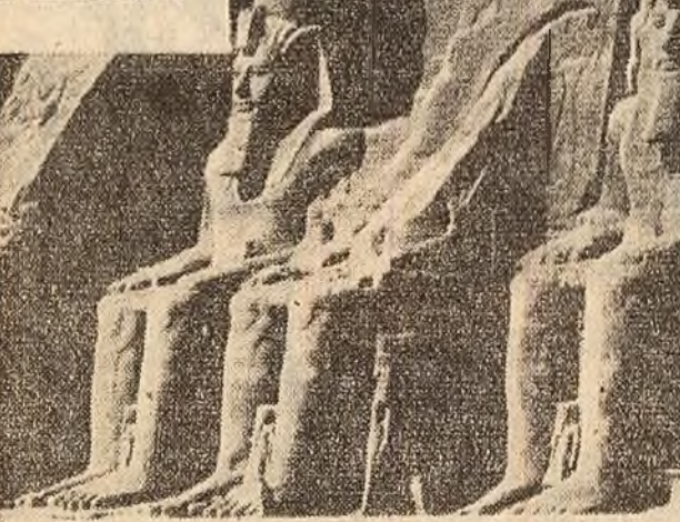
Marele templu al lui Ramses al II-lea (în prezent templul egiptean Abou Simel din R.A.U.) va fi înălțat cu 62 m. deasupra nivelului său actual pentru a nu fi cunundat sub apele zăgăzuite de barajul de la Assuan. Lucrările de înălțare a acestui bloc de 300.000 de tone vor dura 70 de luni.