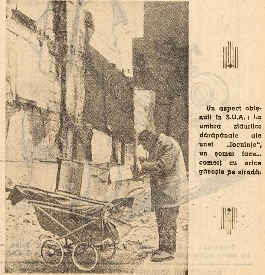
Un aspect obișnuit în S.U.A.: La umbra zidurilor dărăpănate ale unei „locuințe”, un șomer face... comerț cu orice găsește pe stradă.

lipsei acute de locuințe, construcția de locuințe se reduce. El a arătat că în 1960 s-au construit cu 18 la sută mai puține case decât în 1959 și mai puține case decât în orice alt an din ultimul deceniu. Președintele a propus o serie de măsuri pentru stimularea construcției de locuințe și îndeeșebii acordarea de credite în condiții avantajoase antreprenorilor din industria de construcții.