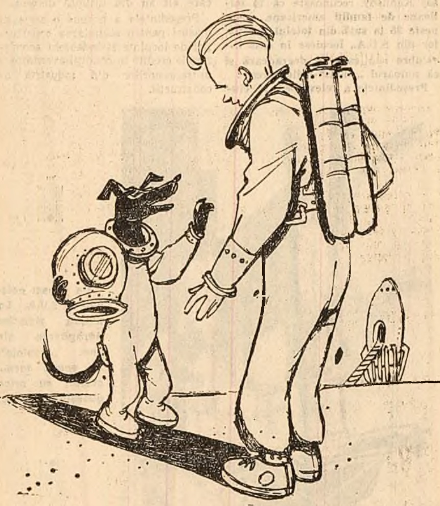
Cer-nușka: — Nu știți unde le pot găsi pe Strelka și Belka, — să facem schimb de impresii? (Desen de EUG. TARU)