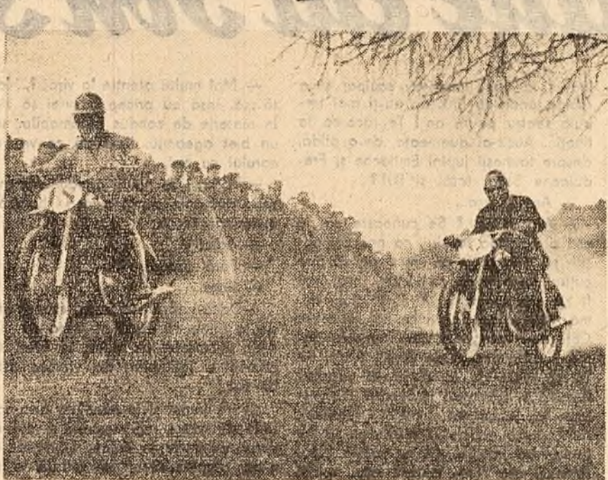
Mline, pe cunoscutul traseu din împrejurimile stadionului I.T.B. (șos. Olteanilor) și avea loc primul concurs de motocros al anului. Organizatorii — clubul Metalul — au invitat la întreceri și o serie de motocicliști fruntași. Startul în prima probă — la ora 10 dimineața. În fotografie: aspect de la un recent concurs de motocros.