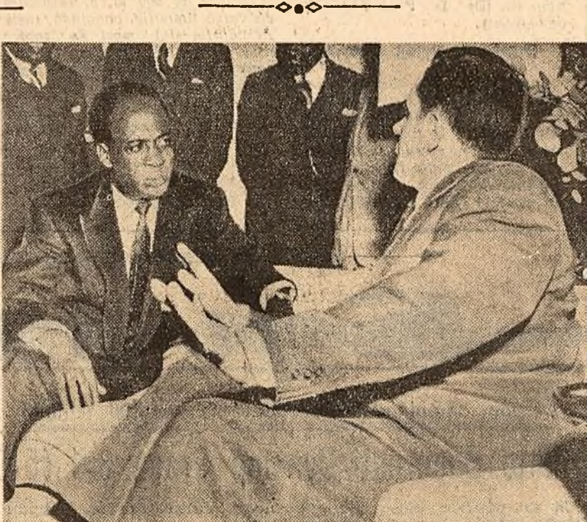
A. A. Gromiko, ministrul Afacerilor Externe al U.R.S.S. discutind la O.N.U. cu președintele Ghana, Kwame Nkrumah.

În luna Ianuarie au fost înregistrate ca șomeri. El a subliniat că acesta „este cel mai ridicat procentaj al șomajului înregistrat în Canada în ultimii 20 de ani“.