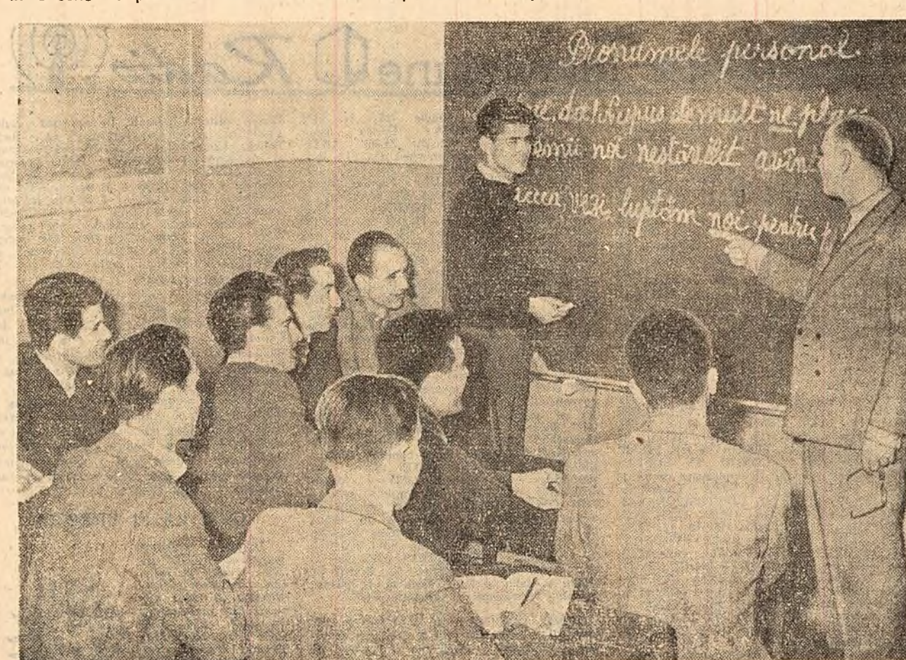
Oră de limba română la cursurile de pregătire de la școala medie serală a uzinelor „23 August”.

asigurarea cadrelor didactice și a sârilor de clasă, repartizarea judicioasă a sarcinilor obștești, organizarea activității extracurculare etc. — probleme care ar contribui la buna desfășurare a învățării.