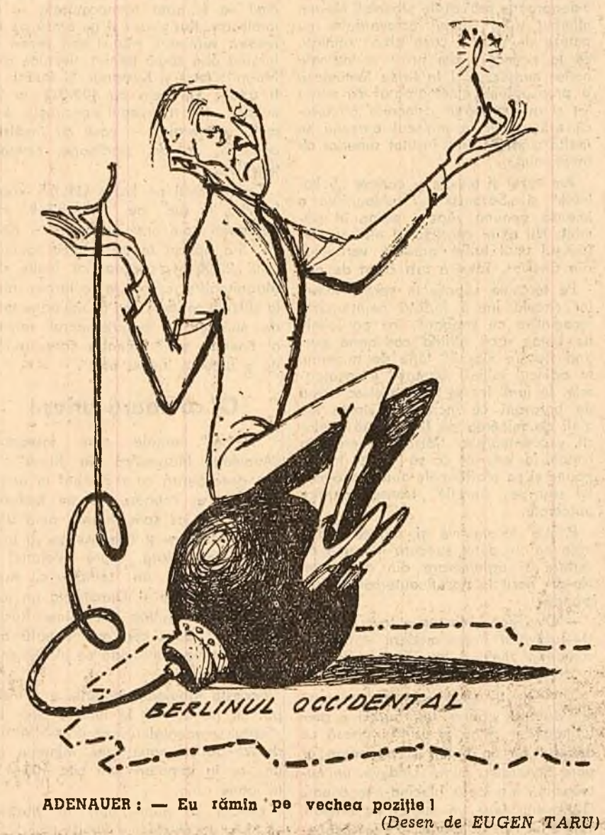
ADENAUER: — Eu rămîn pe vechea poziție! (Desen de EUGEN TARU)

de luptă Patet Lao, se șperie în comunicat, au întreprins o serie de operațiuni ofensive active împotriva rebelilor. În cele trei zile au fost zdrobite pozițiile dușmanului din apropierea localității Sala-Fukun. Forțele patriotice ale Laosului au ocupat din nou localitatea și continuă să-l urmărească pe inamic.