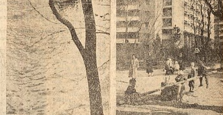
Vine primăvara.

Colectivul de aici a chemat la întrecere pe toți muncitorii, tehnicienii și inginerii din întreprinderile de transport auto din țară.