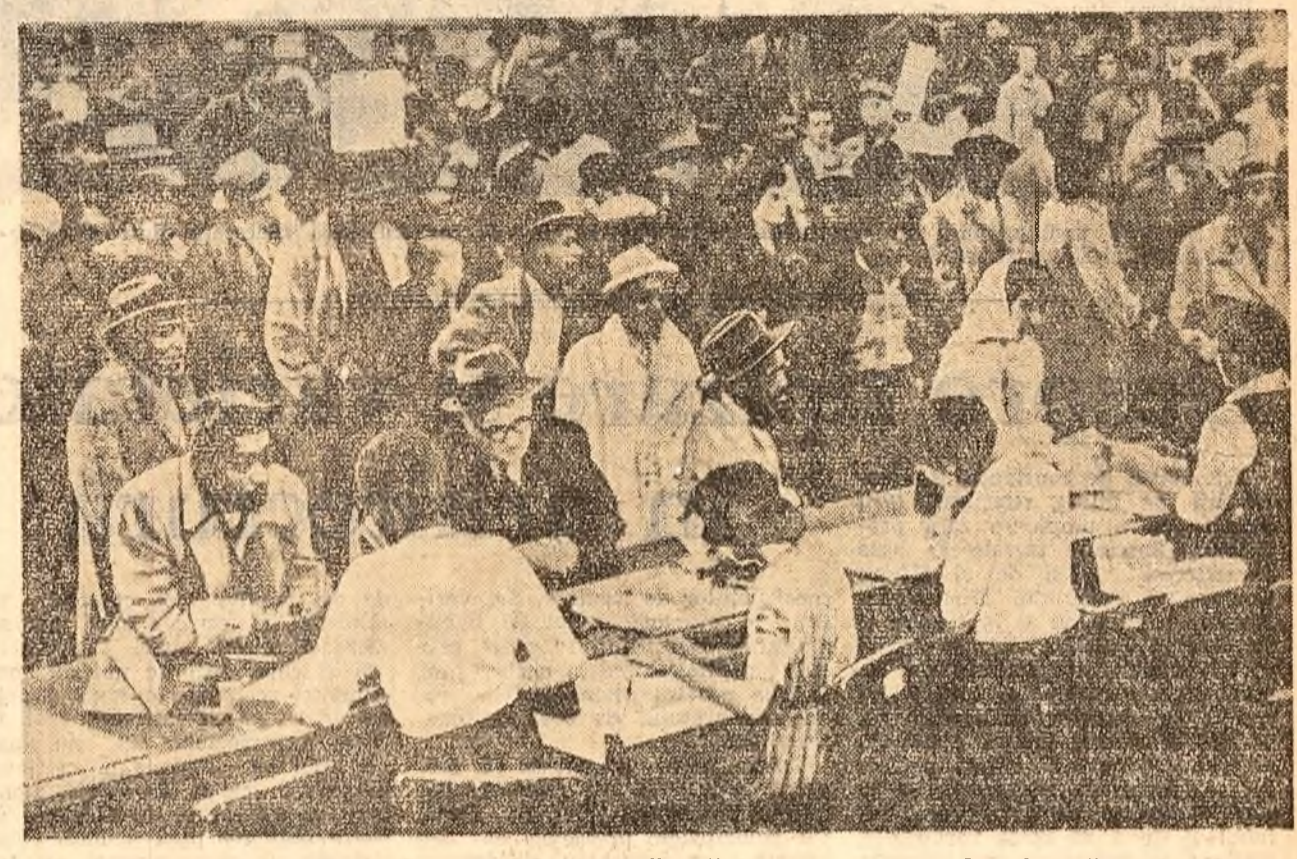
Aspect de la un oficiu de înregistrare a șomerilor din orașul american Detroit: albi și negri așteaptă în fața ghișeelor în căutare de lucru.

Rezultă că, pînă în țările slab dezvoltate numai jumătate din prețul fiecărei tone de petrol E.S.S.O. își însușește fără plată jumătate din cantitatea de petrol extras în fiecare din aceste țări. Astfel, în 1959, monopolul petrolier al Rockefellerilor și-a însușit în mod gratuit 50 milioane tone „petrol negru“ — cantitate echivalentă cu importul de petrol din acele țări din Africa, India și Japoniei — luate la un loc. Pe de altă parte, aprovizionarea cu petrol a țărilor lumii capitaliste de către magnații americani reprezintă una din cele mai puternice pirghii cu ajutorul cărora imperialismul american nu numai controlează, dar și exploatează țările așa-zise „lumi libere“.