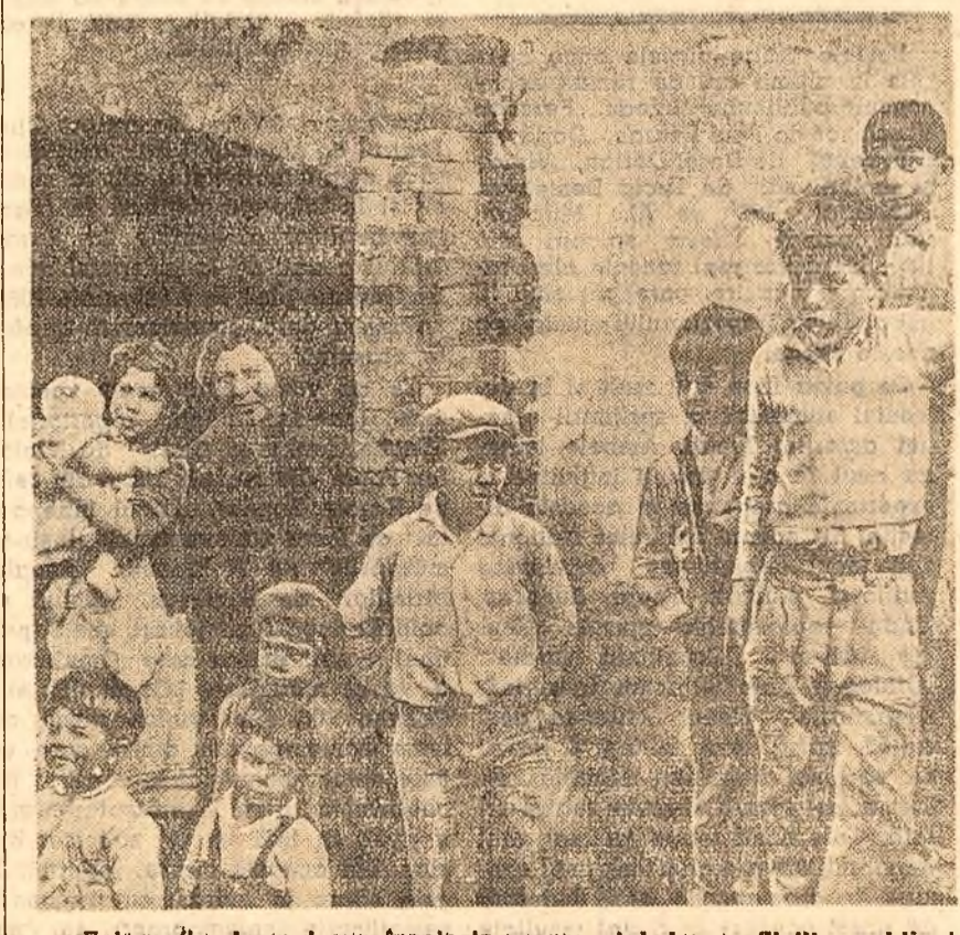
Fotografia de mai sus însoțește un reportaj despre Sicilia, publicat de revista vest-germană „Der Stern“. În această grozăvie, fără însoțire — scrie revista — trăiesc o mamă cu fiica ei și cei 11 copii ai lor“.

...și a avut indiciile re- ...toare. Înca de la căderea Romei ...depravarea morală, descompunerea ...cu fost un semn că istoria și-a pronunțat ...verdictul capital împotriva ...respectivei societăți. „Dolce vita“ a zilelor noastre, constituie și ea un simptom în plus ...că societatea capitalistă actuală, ...cîdită pe etica profitului maximal, ...și-a trăit trailul. ...istoria și-a avut indiciile re- ...toare. Înca de la căderea Romei ...depravarea morală, descompunerea ...cu fost un semn că istoria și-a pronunțat ...verdictul capital împotriva ...respectivei societăți. „Dolce vita“ a zilelor noastre, constituie și ea un simptom în plus ...că societatea capitalistă actuală, ...cîdită pe etica profitului maximal, ...și-a trăit trailul.