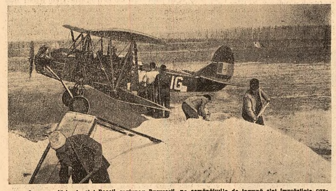
La gospodăria de stat Roseji, regiunea București, pe semănturile de toamnă sînt împrăștiute cantități însemnate de îngrășăminte chimice, lucrare care se face cu avionul. Fotografia reprezintă încărcarea îngrășămintelor în avion.