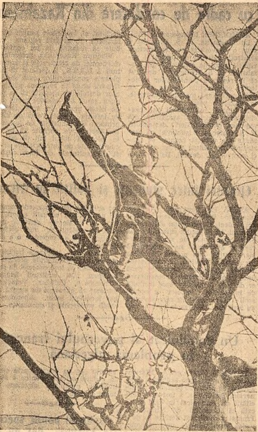
Toaletă de primăvară.

A apărut în limba romînă nr. 3 pe anul 1961 al revistei