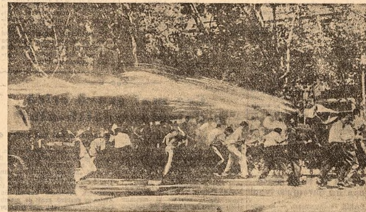
SANTIAGO DE CHILE. Poliția împărșite cu ajutorul pompierilor de apă o demonstrație în sprijinul candidaților opoziției în alegerile parlamentare.

Din birou mai fac parte reprezentanții ai Marii Britanii, Cehoslovaciei, Franței, Indiei, Indoneziei, Italiei, Spaniei, S.U.A., U.R.S.S. și Venezuelei.