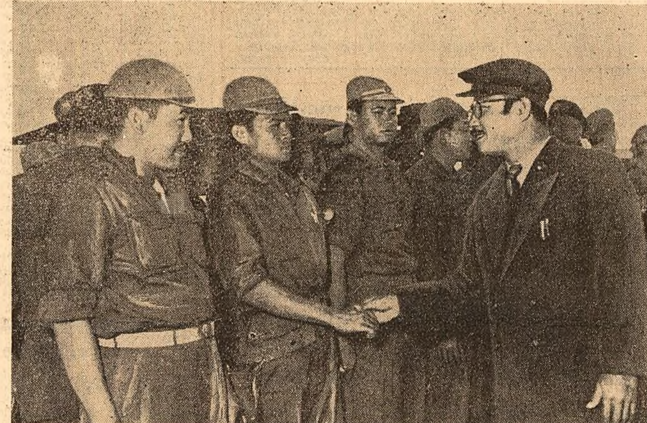
Presedintele C.C. al Partidului Neo Lao Haksat, prințul Sufanuvong, felicită un grup de ofițeri pentru succesele raportate în luptă.

Pe marginea acestui „fapt divers“, opinia publică face diferite reflexii: este oare vreo legătură între pasiunea pentru jocurile de noroc și tendința manifestată a virfurilor Pentagonului de a juca la masa verde soarta a milioane de oameni?