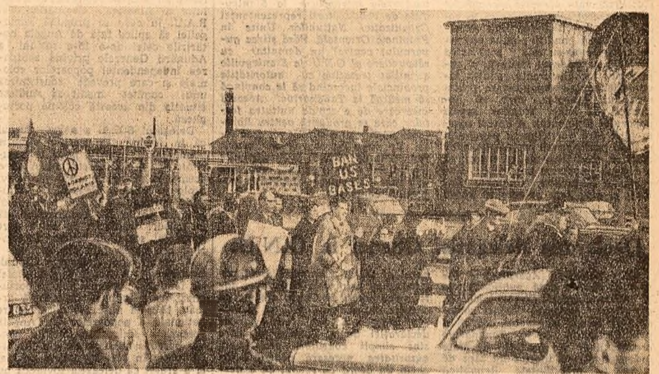
Aspect de la demonstrația împotriva bazelor aeriene americane de la Ruislip (Anglia).

NEW YORK 16 (Agerpres). — În raportul „Statele Unite și comerțul mondial”, un grup special al Comisiei senatoriale pentru problemele comerțului exterior și ale comerțului între statele S.U.A. recomandă Congresului să acorde președintelui împuternicirile necesare pentru încheierea unor acorduri comerciale bilaterale sau între mai multe țări cu Uniunea Sovietică și cu alte țări socialiste. Autorii raportului critică în mod deschis actuala politică comercială a Statelor Unite față de țările socialiste. Ei subliniază că limitarea exportului Statelor Unite în țările socialiste „a sugramtat comerțul cu măruri care, în mod evident, nu au nici o importanță strategică. De aceea majoritatea celor mai apropiați aliași ai noștri sînt tot mai puțin cășpuși și noi sîntem în problemele comerțului dintre Est și Vest”. „Controlul asupra exportului de măruri de importanță strategică, în felul în care se îndeplinesc în ultimul timp, se subînăușe în continuarea raportului reflectă o a-preciere insușitor de realistă a posibilităților tehnice ale Uniunii Sovietice”.