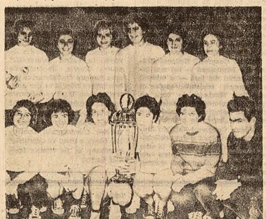
Handbalistele de la Știința-București și antrenorul lor, după victoria de la Praga.

BACĂU (coresp. „Scintei”). Echipa de fotbal Dinamo-Bacău și Petrolul-Floiești au susținut aci prima întîlnire din returul campionatului republican. După un meci echilibrat, în care au dominat pe rînd, tabela de marcaj a arătat scorul de 1-1 (1-0).