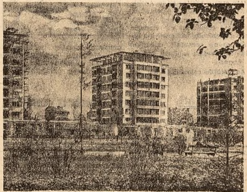
Vedere dintr-un nou cartier de locuințe din Sofia.