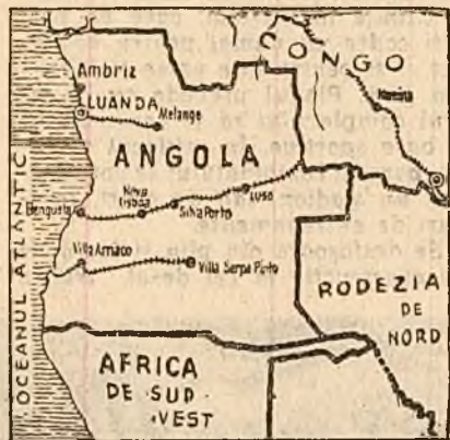
pendentul agenției U.P.I. anunță că autoritățile colonialiste „au dat ordin trupelor, poliției speciale și unităților de parașutiști să pă-

LONDRA 19 (Agerpres). — Lupta pentru eliberarea fraților noștri din Africa de Sud va continua, a declarat președintele Republicii Ghana, Nkrumah, cu prilejul deschiderii noului sediu al Comitetului organizațiilor africane de la Londra. Forțele naționalismului african, a spus președintele Ghana, vor înălța din calea lor ultimele rămășițe ale colonialismului și reacțiunii. În prezent africanii nu pot să nu se gîndească la continentul african în ansamblu. Telul nostru este eliberarea deplină a continentului african.