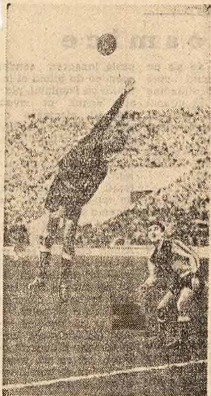
Fază din meciul C.C.A. — Farul-Constanța

Rareori dorințel de a revedea pe sportivii cei mai rădătați, timpul i-a dăruit o astfel de duminică. Soare, primăvară lirică în grădini, cu pomi frumugiți prematur, un stadion în haine de gală (adică gazon tuns cu mașina, drapelul de mătase futurind în ușoara bătaie a vântului, pistă bine marcată, o urea ce nu-a mers la inimă „Bine că veniți” și... 80.000 de entuziaști gata să aplaude) iată imaginea succintă a după-amiezii de marți care a marcat începutul sezonului campionatului de fotbal. Schelele noului blocuri din apropierea marelui stadion 23 August puteau oferi un spectacol unic privitorului pretentios. În secunda cînd Leachevi, centrul atacant al echipei Rapid, puneă mingea în joc, buldoarele din jurul imensului stadion se goliseră ca prin farmec. O astfel de punctualitate de mare impune orice. Curiozitatea de a revedea la lucru pești patruzeci de jucători porțiți pe drumul îmbunătățirii jocului cu balonul rotund ne a-