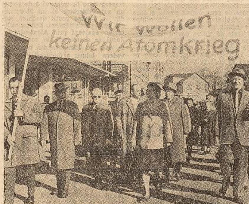
Demonstrație de protest în orașul vest-german Schweinfurt împotriva înarmării atomice a R.F.G. și a creării unei baze de rachete în apropierea orașului.

De pe sonda cosmică s-ar putea obține „ultimel informații” despre lucașul de seară. Se poate lansa o sondă cosmică pe o orbită în jurul Pământului și al planetei Venus fie de pe Pămînt, comunicîndu-i o viteză de 11,7 km./sec., fie de pe un satelit artificial care s-ar roți la o altitudine de 200 km. În ultimul caz sonda ar trebui să se comunice o viteză de 3,7 km./sec. După 105 zile sonda ar intersecta orbita planetei Venus. Sonda cosmică s-ar deplasa pe o elipsă a cărei semiaxa mare de 123.300.000 km. La nouă luni de la lansare, ea s-ar însopta la orbita Pământului care, însă, ar-avea încă timpul să ajungă la locul lansării. Distanța dintre sondă și Pămînt ar fi atunci de 211.000.000 km. Dar trei ani mai târziu, după patru revoluții ale sondei, ea s-ar întîlni cu Pămîntul. În acest moment, la o distanță transmisă de pe Pămînt, s-ar putea obține informații și rezultate măsurătorilor efectuate de aparatul sondei. În perioada care des-