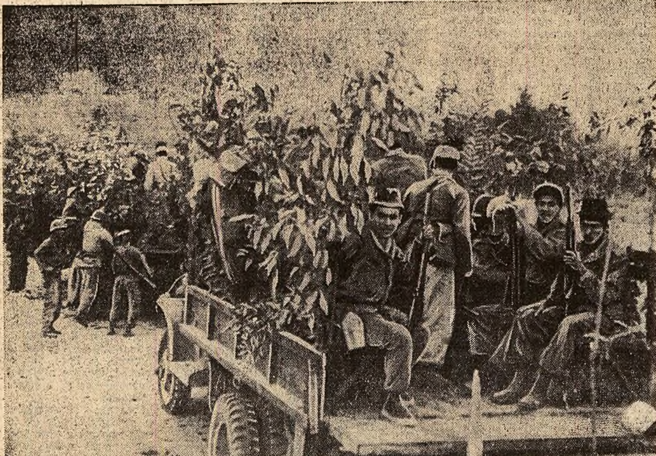
O unitate a forțelor patriotice laolene se pregătește să pornească în urmărirea rebelilor.

Deputatul laboriștii Short (din partea circumscricției electorale Newcastle) a declarat că în circumscricția lui mii de oameni trăiesc în condiții groaznice.