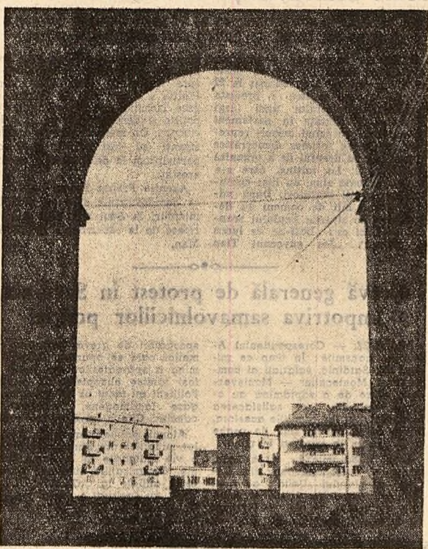
Nou pelsaj bñimãrea.