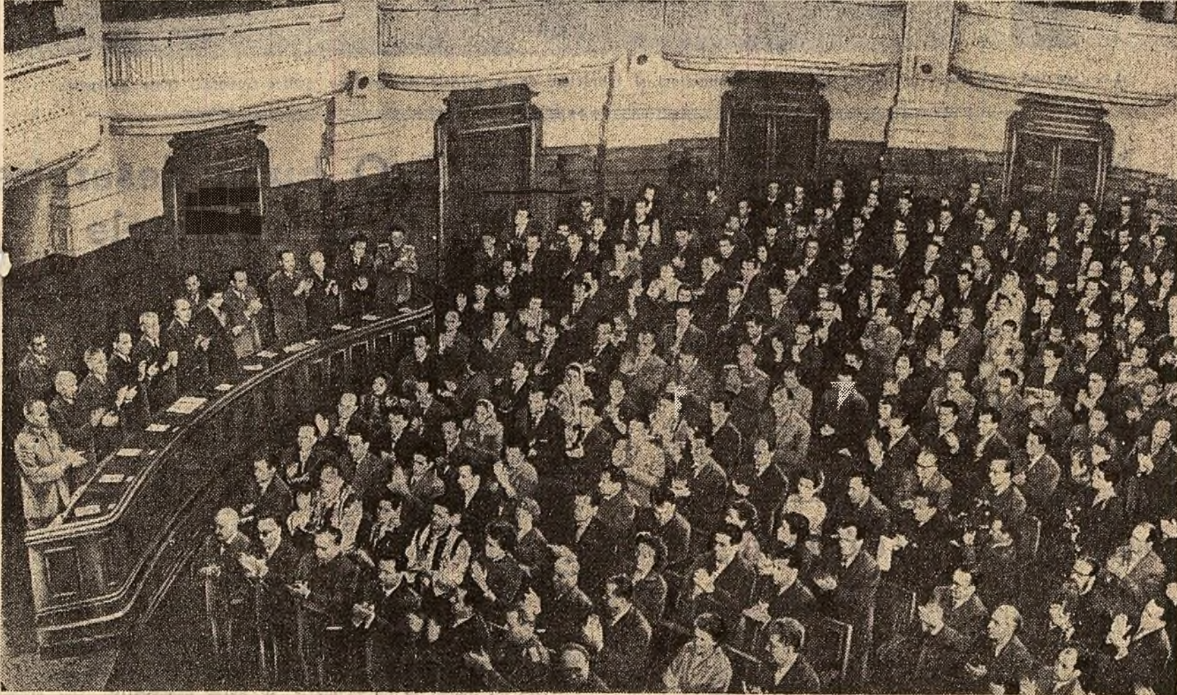
Aspect de la ședința de încheiere a lucrărilor sesiunii Marii Adunări Naționale.

Miercuri au luat sfârșit lucrările primei sesiuni a celei de-a IV-a legislaturi a Marii Adunări Naționale.