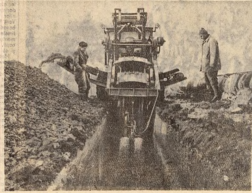
Pe șantierul conductei de țije din Slovãcia. În foto: O mașinã sovieticã modernã, sãpînd șanțul viitoareii conducte.