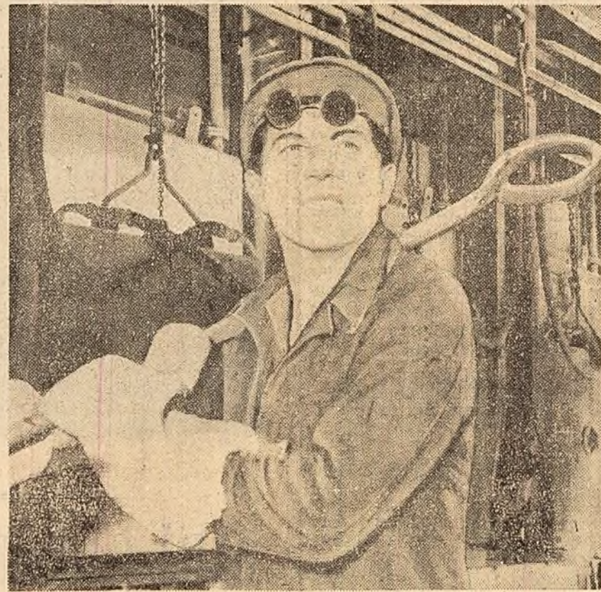
In cinstea aniversării a 40 de ani de la înființarea partidului oțelarii reșini și-au luat angajamentul ca, odată cu intensificarea luptei pentru îndeplinirea planului...