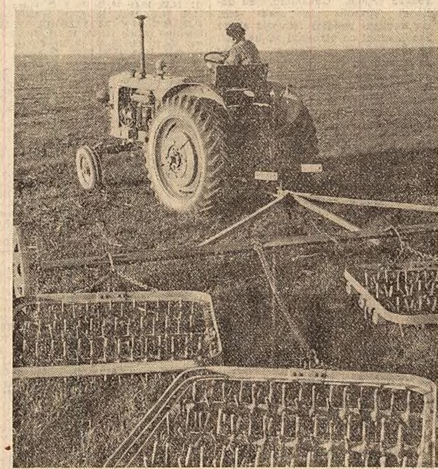
Lucrările pentru menținerea apei în sol au o mare însemnătate în vederea obținerii unor recolte mari la hectar. În fotografie: tractoriștii de la G.A.S. Vîtănești, raionul Alexandria, grăpescăz tenurile semănate cu grîn de toamnă.