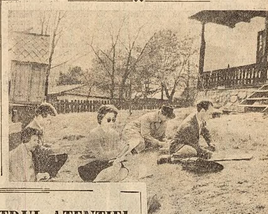
Artiștii amatori, la muzeul satului din Capitală.

Motonava Transilvania într-o nouă croazieră Azi, 2 aprilie, motonava Transilvania pleacă într-o croazieră de 5 zile pe Marea Neagră, avînd la bord aproape 400 de turiști romini, care vor vizita orașele Odesa, Ialtă, Soci. În această lăună motonava va mai efectua 3 asemenea croaziere.