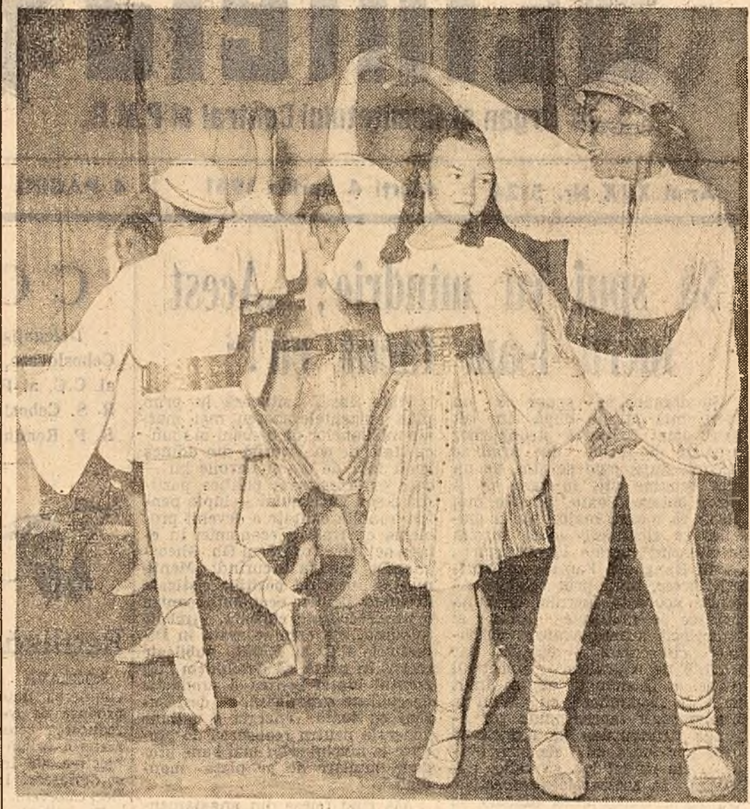
Tabloul din scenariul coregrafic „Rod bogal”, pe care-l pregătește formația de dansuri a copiii de la Palatul de cultură din Pitestii...