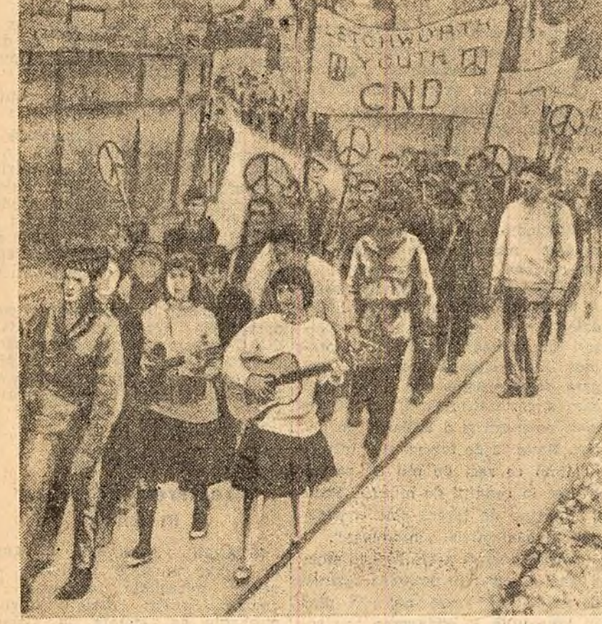
7.000 de tineri din Wethersfield (Anglia) au întreprins un marș spre Londra, manifestând pentru interzicerea armelor nucleare.

LONDRA 4 (Agerpres). — După cum s-a mai anunțat, la 3 aprilie în piața Trafalgar din Londra a avut loc un grandios miting la care au participat circa 150.000 de persoane.