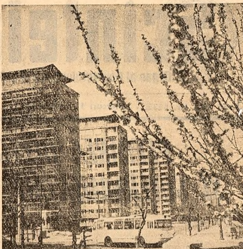
Se înalță noi clădiri pe bulevardul Dincu Goleescu din Capitală

PRIN VALORIFICAREA LEGUMELOR TÎMPURII Membrii gospodăriei colective „Filibon Sîrbu” din apropierea orașului Constanța cultivă în flecare an suprafețe întinse cu legume. Anul acesta au repartizat grădini de legume peste 110 ha. Brigada de legumicultori, lucrînd cu multă hîrnicie, a și valorificat pe plața orașului Constanța o mare cantitate de salată, spanac, ceapă verde, ridichi etc. Pe cele câteva mii de kg. trufandale vindute pînă acum pe plață gospodăria a încasat peste 14.000 lei. (de la Gheorghe Gheorghiu, muncitor).