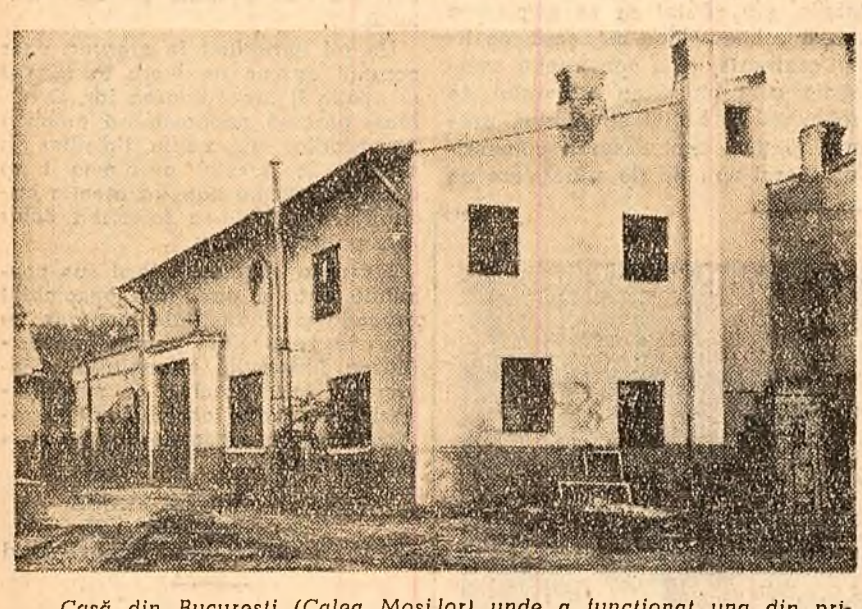
Casă din București (Calea Moșilor) unde a funcționat una din primele tipografii comuniste ilegale.