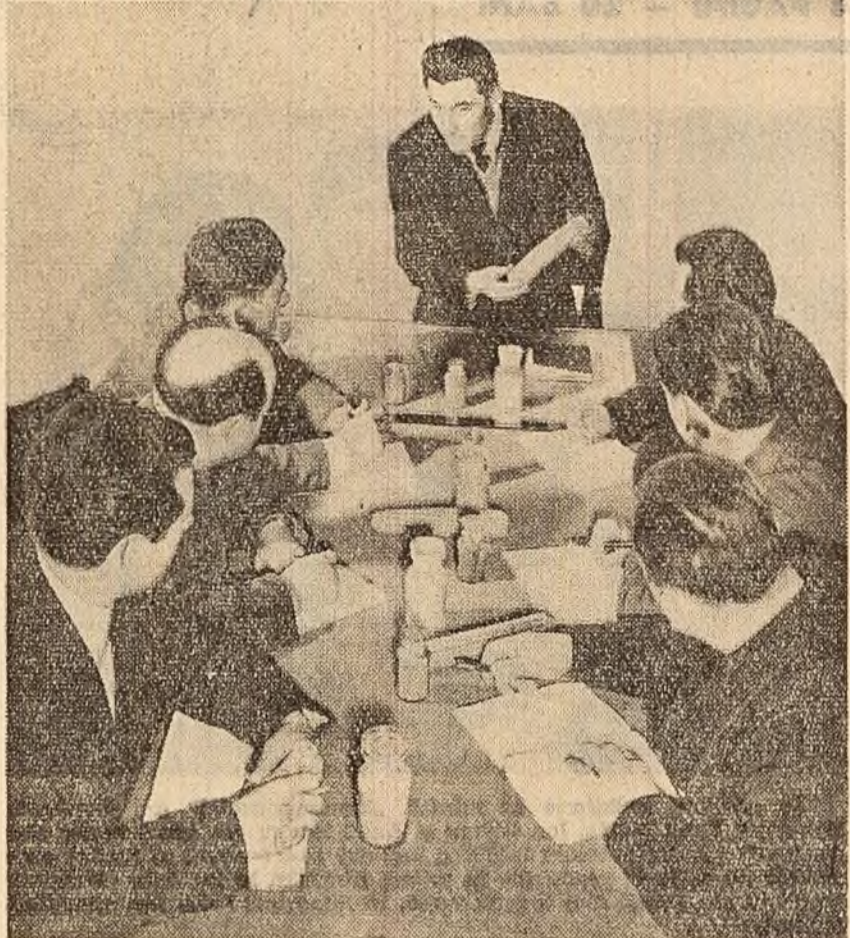
La sediul comitetului raional de partid, instructorii teritoriali participă la un instructaj despre importanța culturii de porumb dublu hibrid.