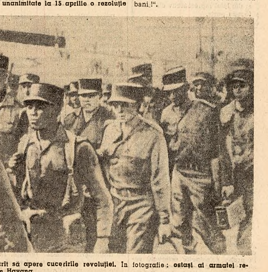
Poporul cuban este ferm hotărît să apere cuceririle revoluției. În fotografie: ostași ai armatei revoluționare în marș, pe o stradă din Havana.