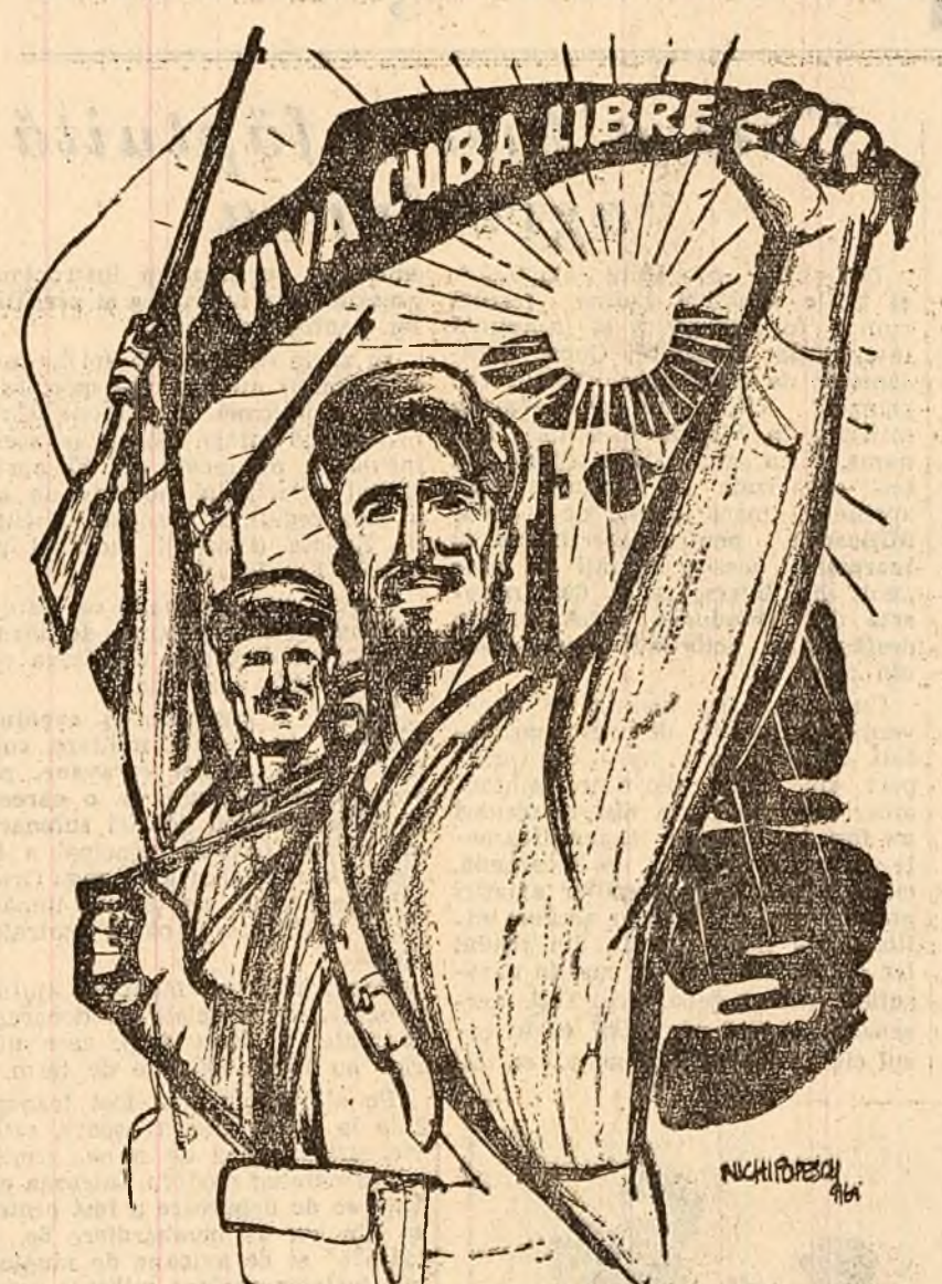
(Desen de N. POPESCU)

Cunoșterea bine care a fost scopul agresiunii împotriva poporului cuban — a spus tov. Andrei Popa, di-