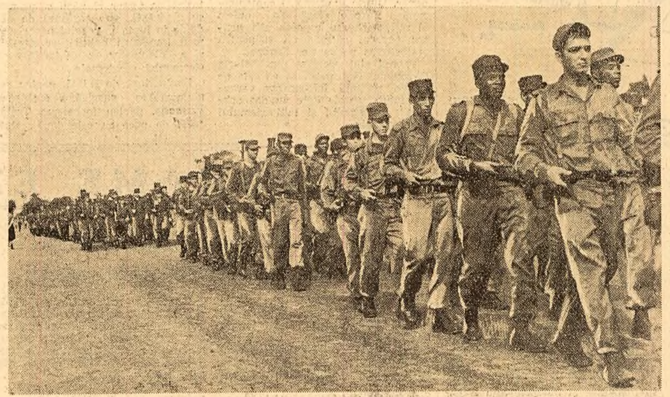
Deplasamente ale armatei Cubei revoluționare

În aceste zile, în întreaga țară au avut loc mitinguri purlînd pecelea