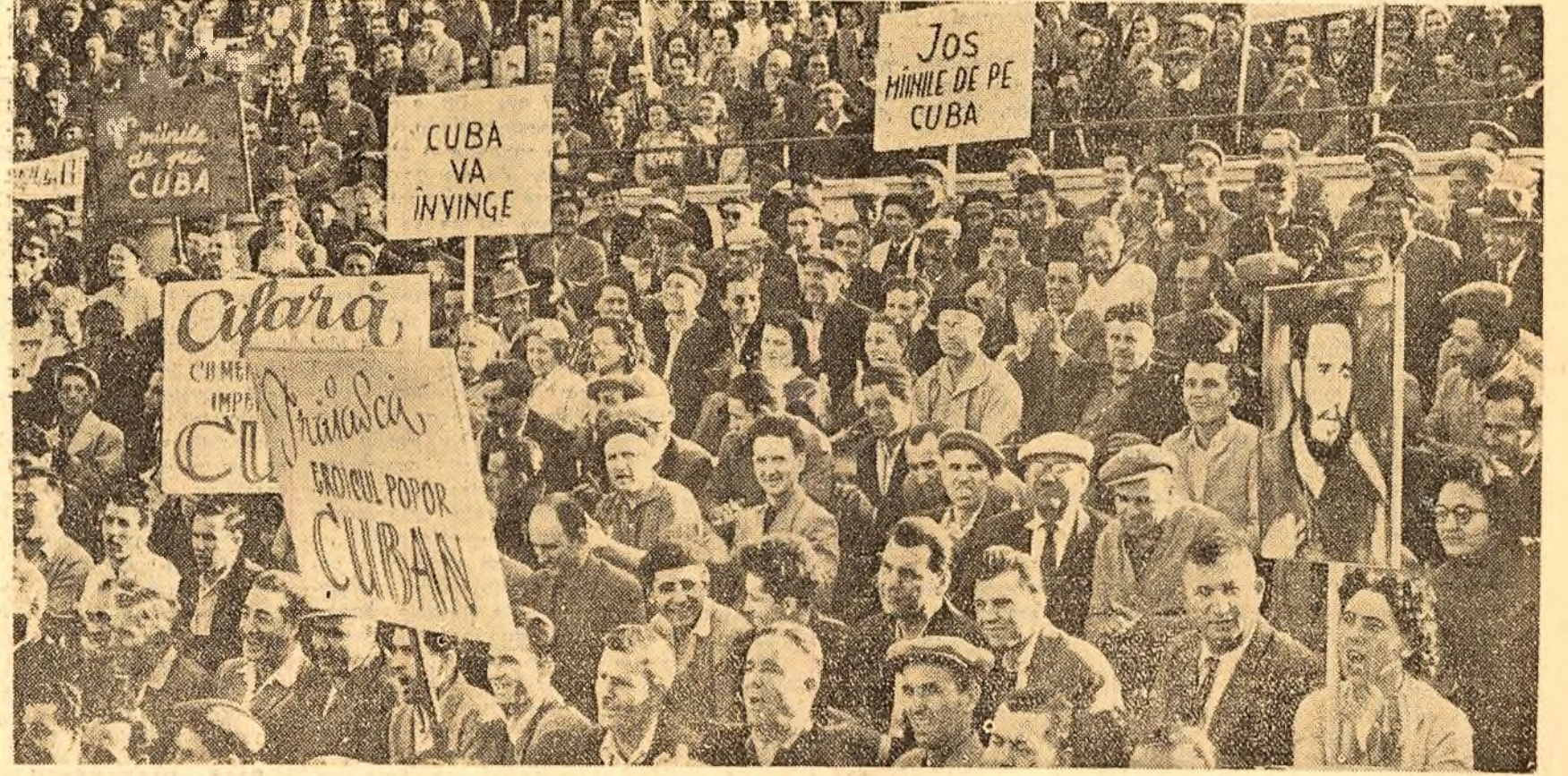
Mile de oameni ai muncii din Capitală își exprimă solidaritatea cu lupta eroică a poporului cuban.