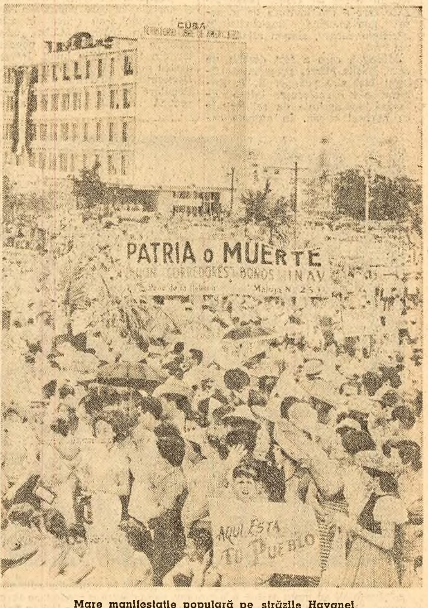
Mare manifestație populară pe străzile Havanei

Adlai Stevenson luînd cuvîntul la O.N.U. a exclamat patetic: „Lozincă noastră este cea de totdeauna: progresul — da, tirania — nu”. A june, domnilor! Lozincă dv. a fost și rămîne — „tîlhărie — da, libertate — nu”. Tocmai de aceea v-ați mobilizat întotdeauna împotriva dictaturii clasei muncitoare, dictaturii poporului îndreptățit împotriva exploataților. Vă inspiră „temeri” participarea largă a maselor populare la dezvoltarea țării, cele mai largi drepturi democratice ale oamenilor muncii care nu cunosc șomajul, bursa brațelor muncii, concedierile în masă și alte atribuțe ale faimoasei „lumi libere”.