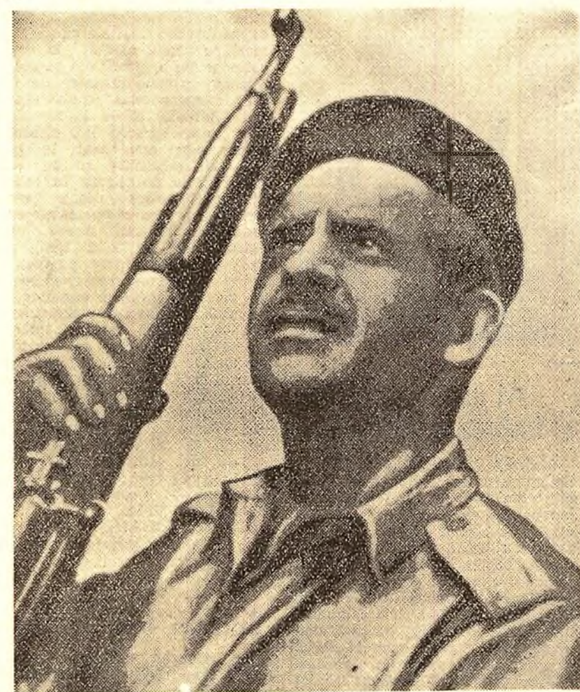
Cuba, 1961. De strață revoluției

HAVANA 23 (Agerpres). — Poporul cuban a zădărnicit în mai puțin de 72 de ore o mare armată pe care ofițerii yankei au instruit-o mai bine de un an pentru a-și însuși tactica ducerii războiului modern de partizani, pregătind-o special pentru acțiuni împotriva țării noastre, se spune într-un articol redacțional al ziarului „NOTICIAS DE HOY”.