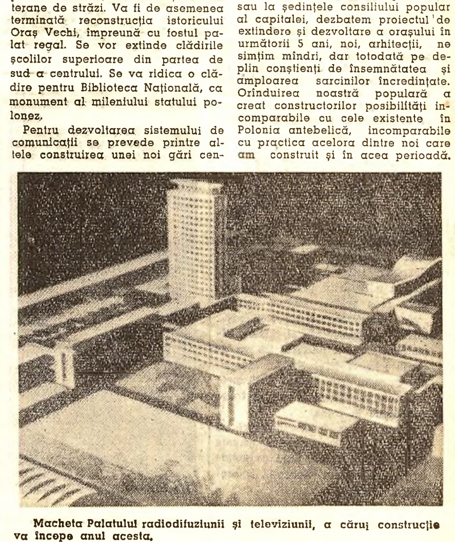
Macheta Palatului radiofuziunii și televiziunii, a cărei construcție va începe anul acesta.