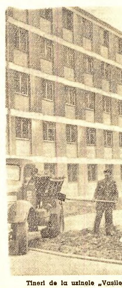
Tineri de la uzinele „Vasile Roașă” — la muncă patrioțică în noul cartier din Drumul Murgului.