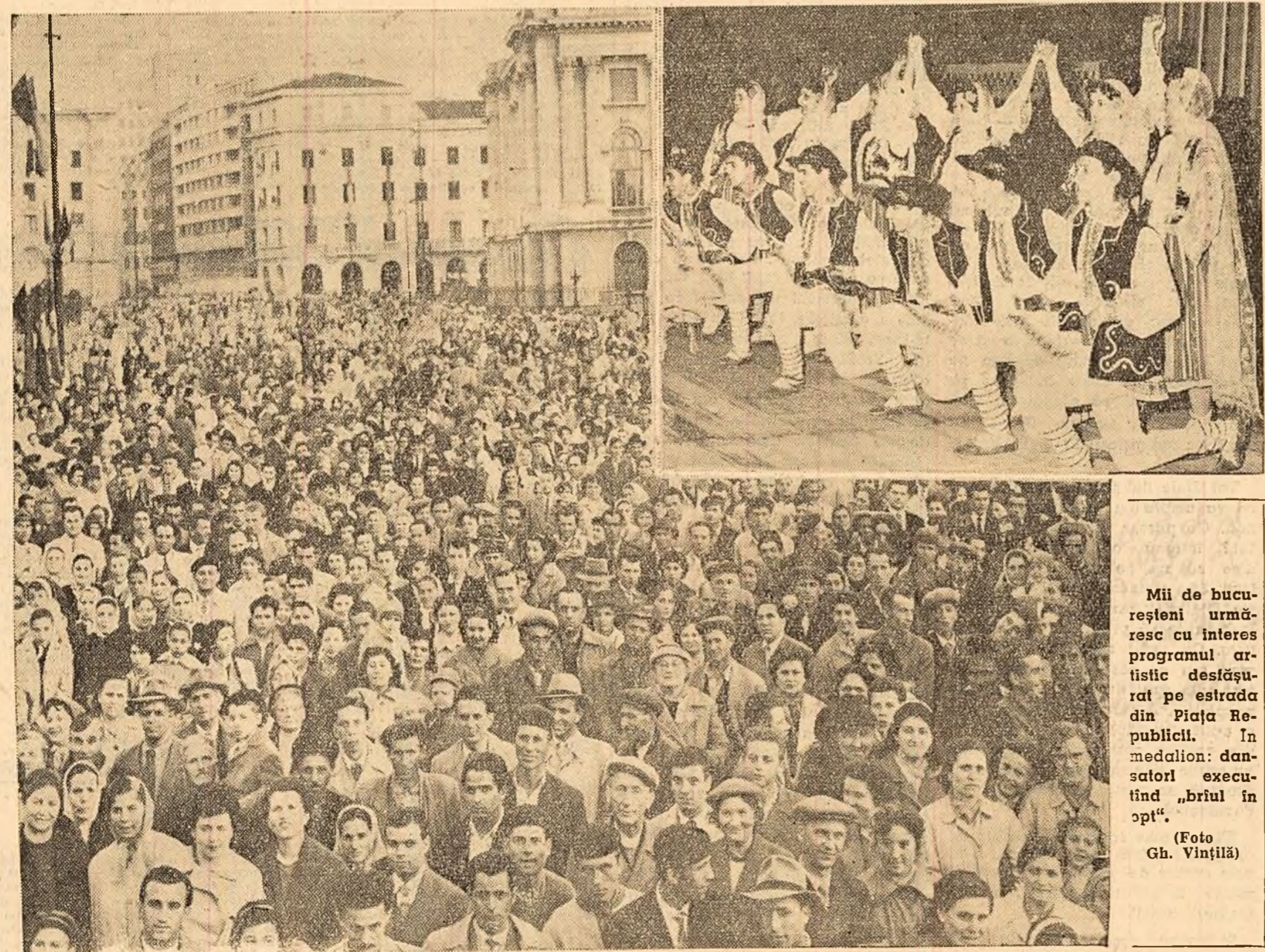
Mii de bucureșteni urmăresc cu interes programul artistic desăvîșit pe estrada din Piața Republicii. În medalion: dansatorii executînd „bricuri în opt”.

Alături de colectivele industriale, oamenii muncii din agricultură obțin victorii prețioase în lupta pentru o recoltă bogată. Astfel, Comitetul regional de partid Maramureș arată în telegrama sa — pe lîngă alte realizări — că planul însămînțării de primăvară a fost îndeplinit în bune condiții agro-horticole. Astfel de telegrame s-au mai primit din partea multor întreprinderi, organizații și organe locale de partid, comitete executive ale stațiilor populare.