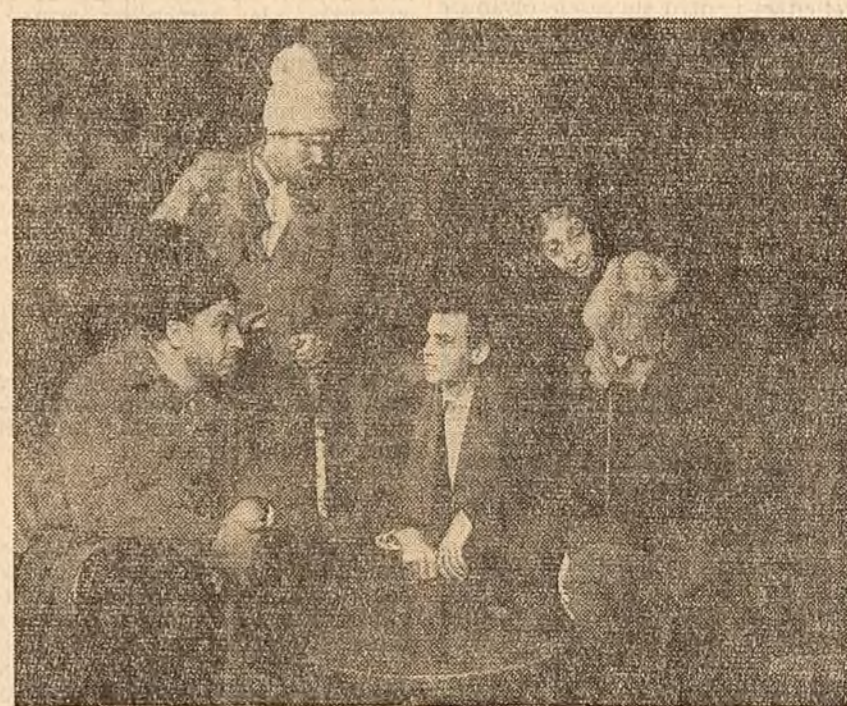
Teatrul „C. Nottara” prezintă în cinstea celei de-a 40-a aniversări a înființării partidului poemul dramatic „Primăvara” de Aurel Mihalac. Piesa aduce pe scenă momente din luptele desăvîșurate în primele luni ale anului 1945 de oamenii muncii, sub conducerea partidului, pentru sprijinirea frontului antihitlerist, realizarea reformei agrare și cimentarea alianței dintre clasa muncitoare și țărâniimea muncitoare.