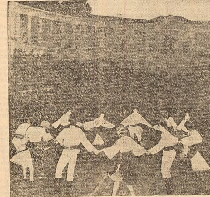
Echipe de dansuri a uzinelor „Tudor Vladimirescu” din Capitală, prezintă d miilor de spectatori adunați ieri după-amiază la Arenele Libertății un pitoresc dans popular.

A r fi bine să-l iau pe scriitor și să-l plimb prin blocuri. Să-i arăt cărțile de vizită de la apartamente: muncitori, profesori, medici, ingineri, artiști. Și am să-i spun scriitorului fără lipsă de modestie, că în cutînt cartierul nostru va concu-