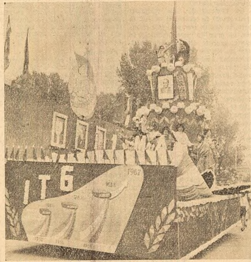
Carul alegoric al textilistilor gălățeni a prezentat la demonstrație cele 11 modele noi, create în cinstea zilei de 1 Mai.

Întreaga țară a sărbătorit cu entuziasm ziua de 1 Mai. Cu acest prilej oamenii muncii și-au manifestat dragostea nețărmurită față de partid, hotărîrea de a întîmpina glorioasa aniversare a partidului cu noi și însemnate realizări în construcția socialistă. Ei și-au exprimat totodată atașamentul profund față de cauza păcii și prieteniei între popoare.