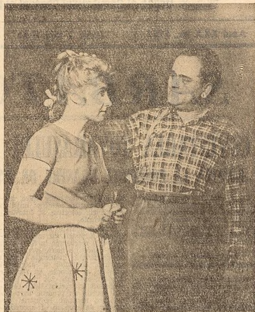
Noua piesă a lui V. Em. Galan „Prietenia mea Pix” confruntă două concepții despre tinerețe și fericire, condamnă vechea mentalitate individualistă, ipocrită, cultivată de burghezie, relevă frumusețea și puritatea relațiilor de dragoste și prietenie, care se dezvoltă firesc în ambianța muncii entuziaste pentru făurirea viicii noastre noi.