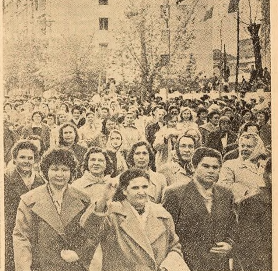
Aspect de la demonstrația oamenilor muncii din Constanța.