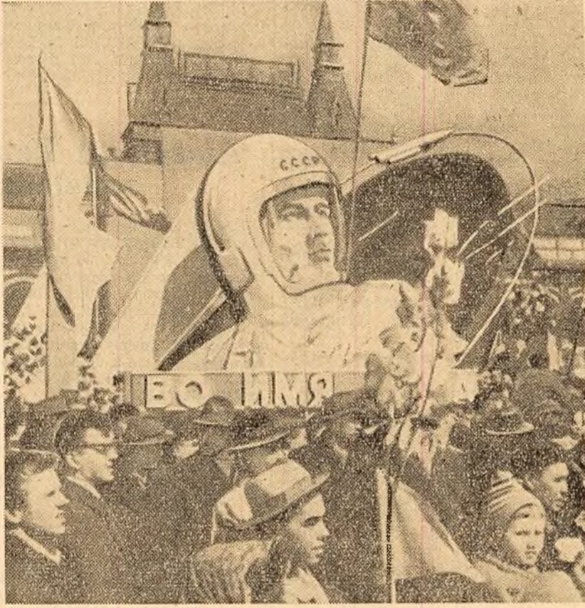
Un aspect al marii demonstrații populare din Piața Roșie

Poate e inutil să descriu interesul stîrnit de apariția la tribuna Mausoleului a primului cosmonaut, I. Gagarin, eroul care a săvîrșit cu 18 zile în urmă primul salt al omului în Cosmos. Gagarin a fost urmărit de privirile a zeci de mii de spectatori și fotografiat din toate unghiurile și pozițiile posibile de către fotoreporterii. Machetele navelor cosmice purtate de manifestanți erau salutate în diverse limbi ale pămîntului. Am văzut africani aplaudind cu entuziasm, indiene fluturîndu-și șalurile de mătase, cubani rîzînd lejer. Am văzut priviri admirative ale mulțimii urmărid macheta unei nave îndalîndu-se spre cer și pierzîndu-se printre nori și am