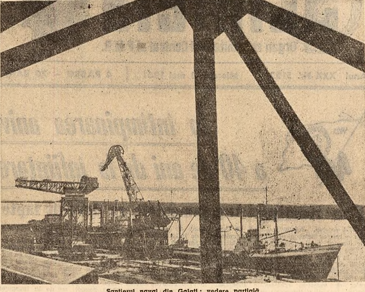
Șantierul naval din Galați: vedere parțială