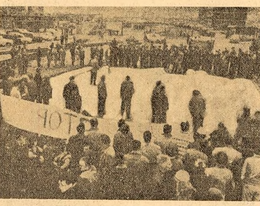
Aspect de la recenta grevă a 150.000 de muncitori din Danemarca.

care au avut loc marșii la Teheran în sprijinul revendicărilor corpului didactic de mărire a salariilor. Demonstrația de marș a fost însoțită de o mare grevă a membrilor corpului didactic din școlile primare și secundare din întregul Iran.