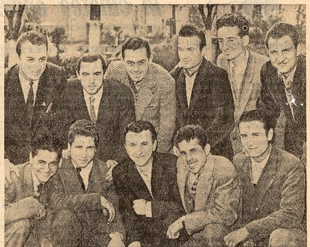
Întă citiva tineri dintr-o brigadă de muncă patriotică de la uzina „Republica” din Capitală. Cei aproape 40 de membri ai brigăzii se numără printre fruntașii în producție al uzinei. Fruntași stă și în munca patriotică. Ei au efectuat, de la începutul anului și până acum, peste 4.400 ore de muncă patriotică.

● Din inițiativa grupelor de partid de blocuri, locuitorii noilor cartiere al meturgilor din Sibiu au plantat peste 100 pomi și au amenajat spații verzi.