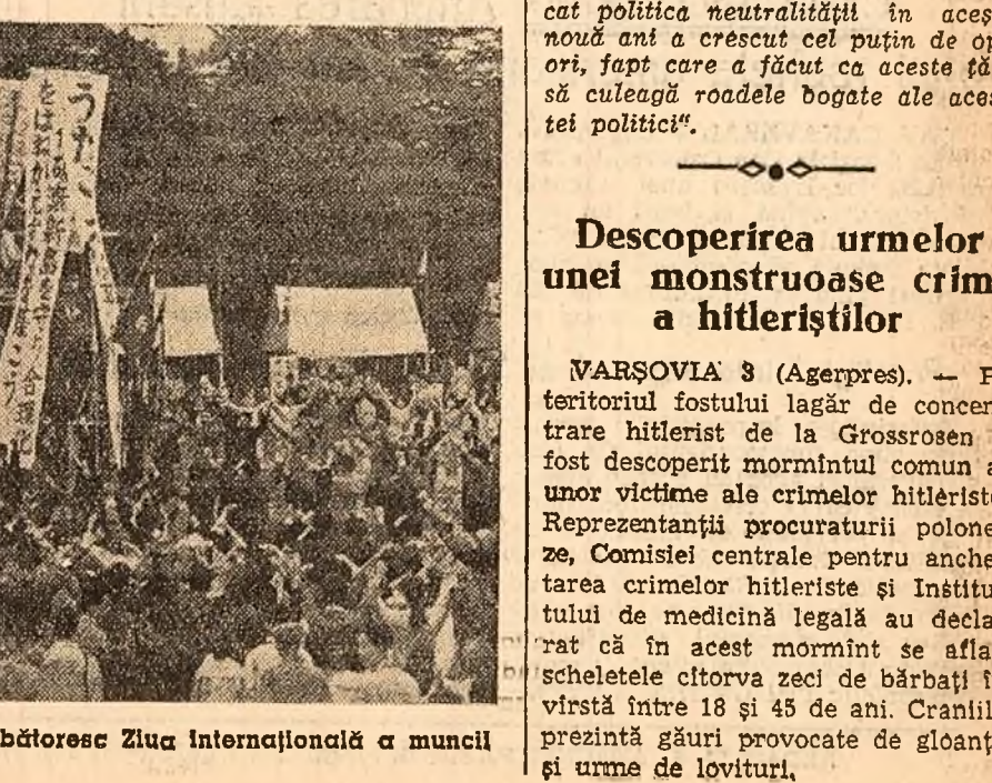
Mii de muncitori japonezi sărbătoresc Ziua Internațională a muncii în Parcul Hama din Tokio.