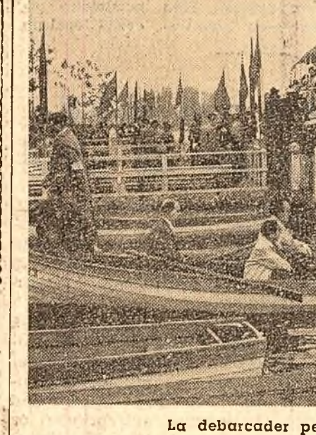
La debarcader pe lacul Herăstrău.

— Alo! Pleacă „Rîndunica”? Curioasă întrebare. Doar și aci ca și în toată țara rînduniele de-abia au sosit din lunga rădătoare. Atunci? Să ne lămurim: este vorba despre cochetul vaporos „Rîndunica” care de obicei face curse de agrement pe Bega. De data aceasta însă „Rîndunica” s-o fi speriat poezia de noii cenșii care au a-